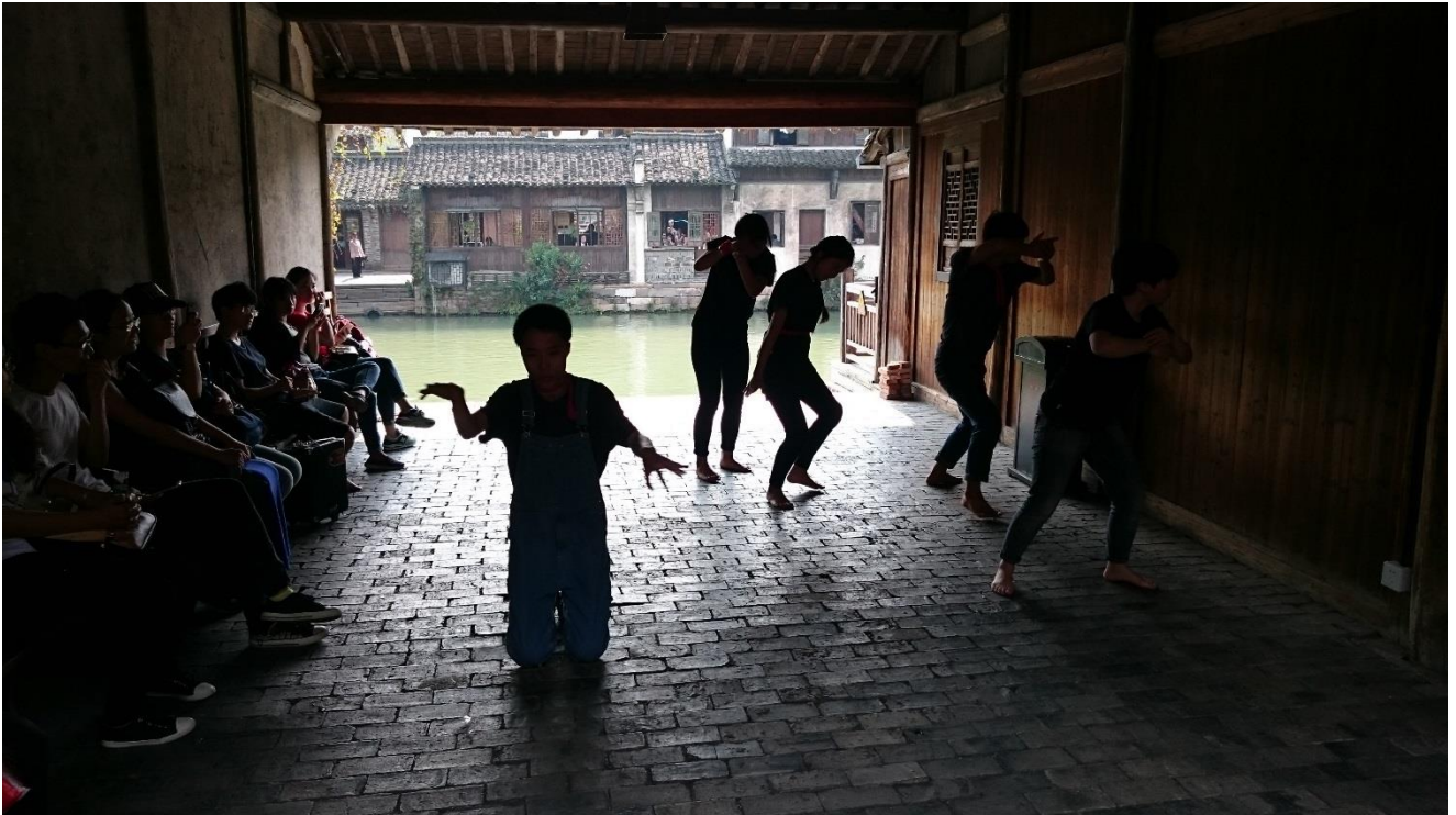
烏鎮戲劇節—小鎮嘉年華