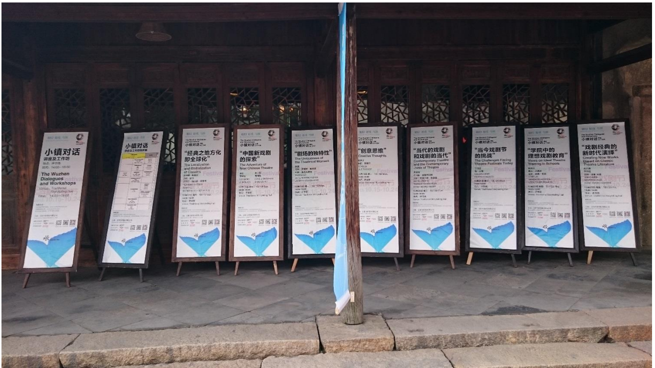
烏鎮戲劇節一國樂劇院「小鎮對話」立牌