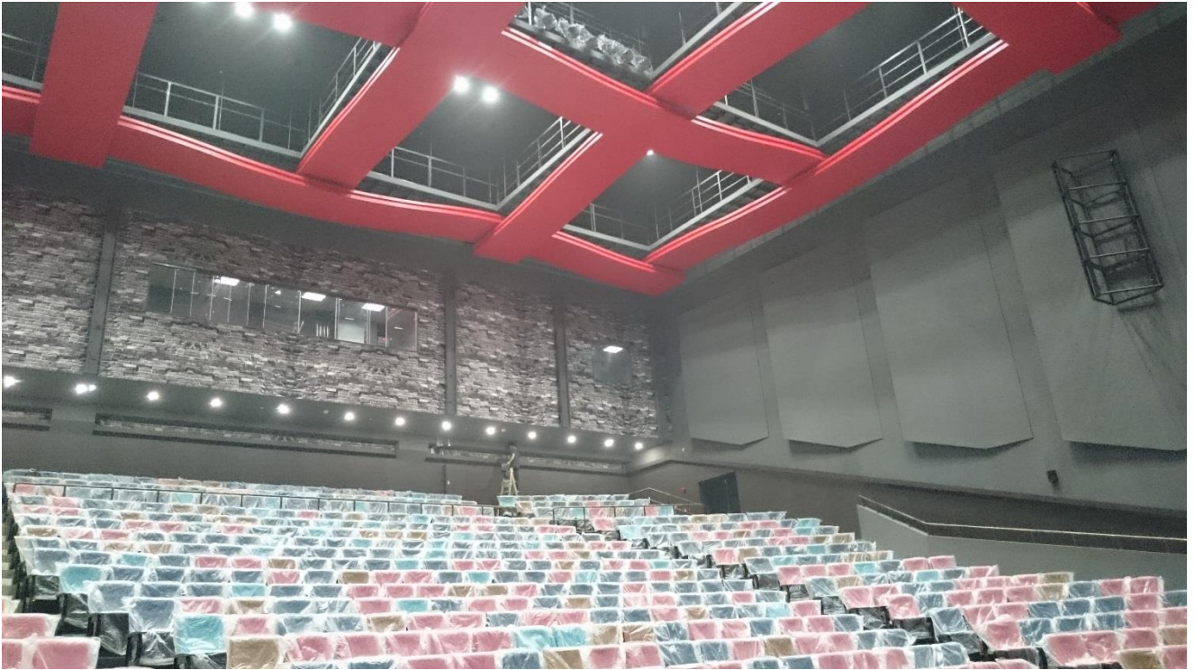
上劇場觀眾席（未完工）