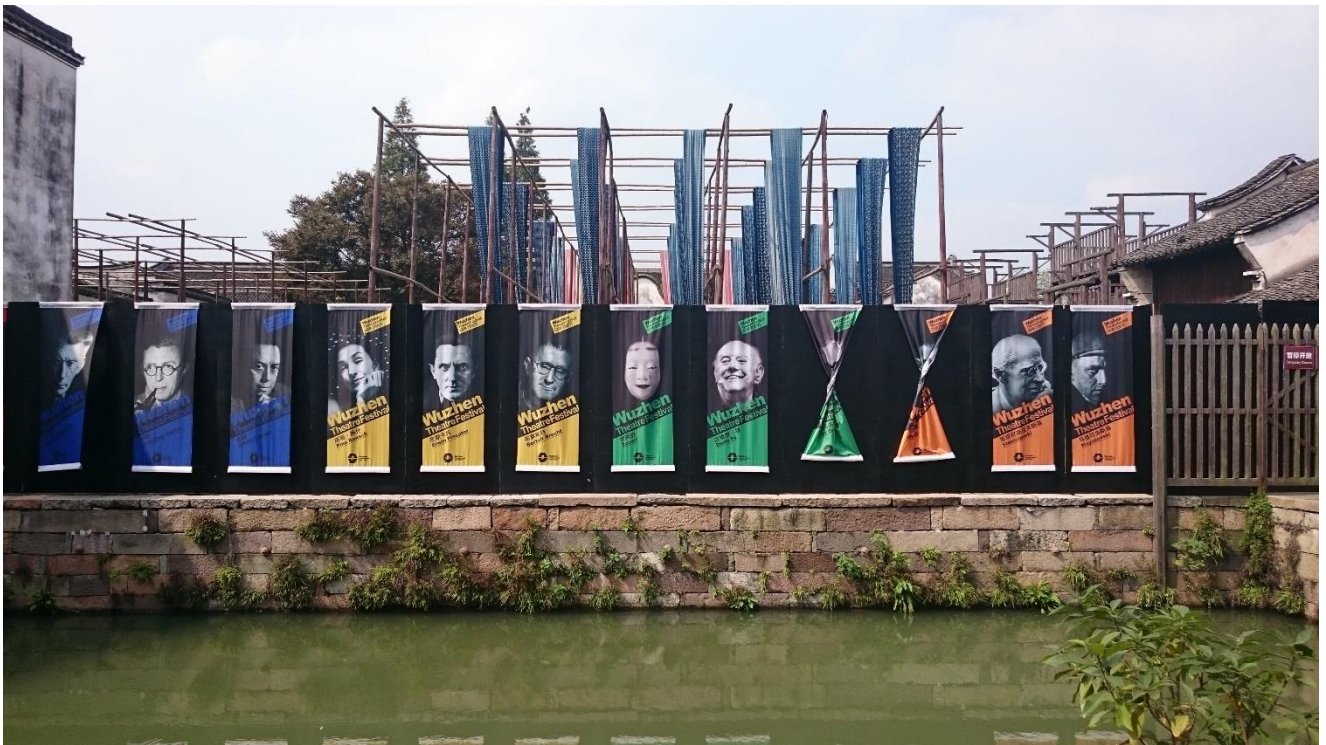
烏鎮戲劇節—染布坊