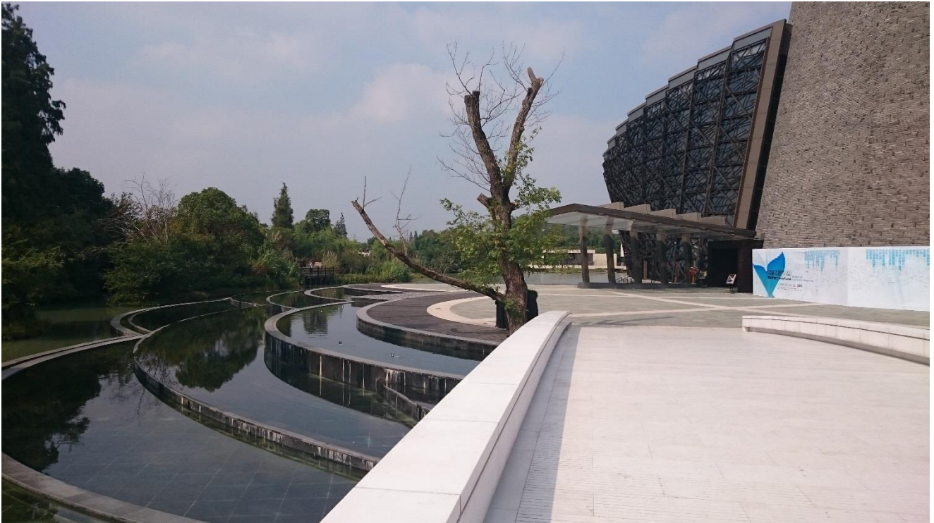
烏鎮戲劇節—烏鎮大劇院外觀