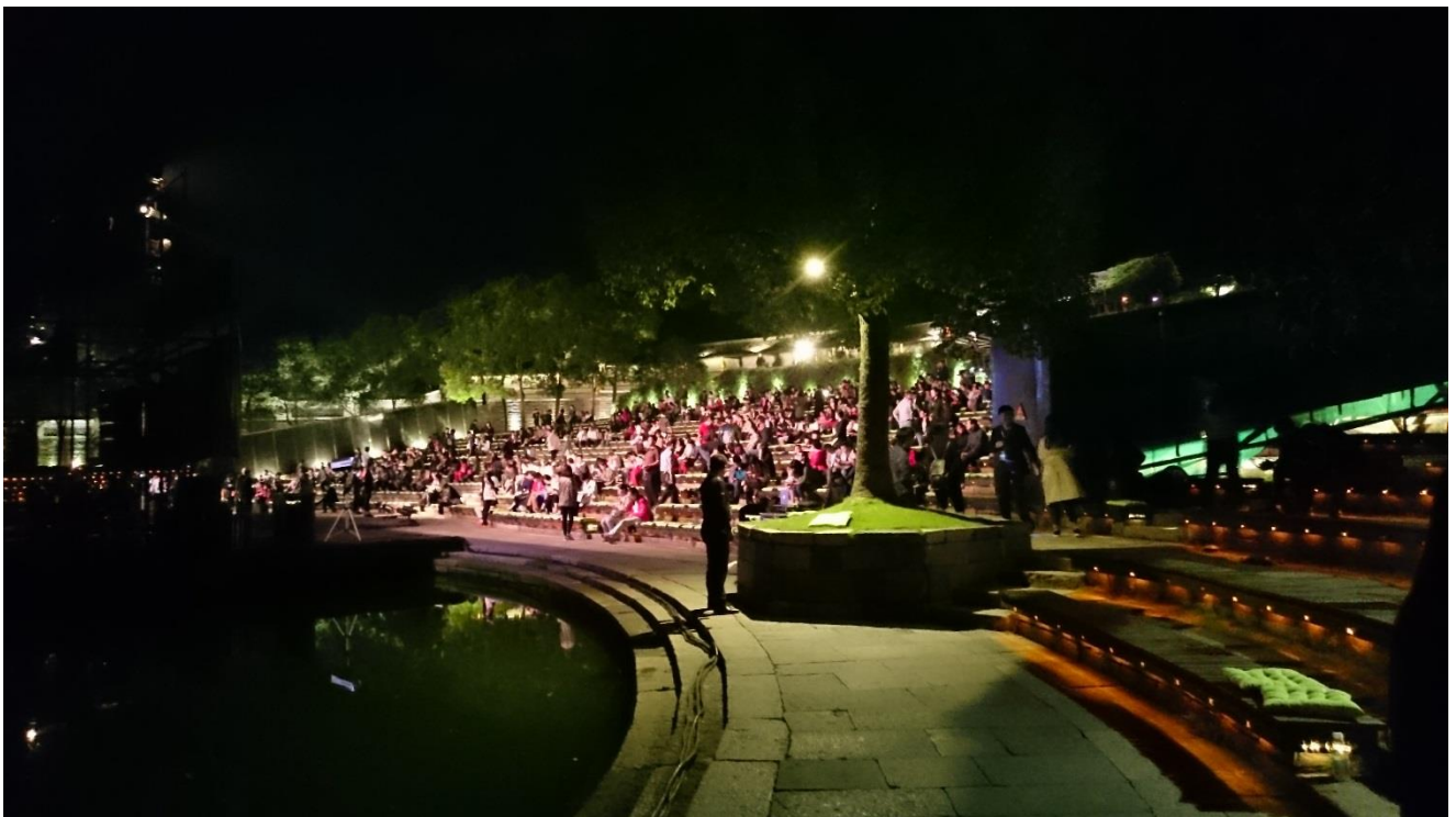
烏鎮戲劇節—水劇場