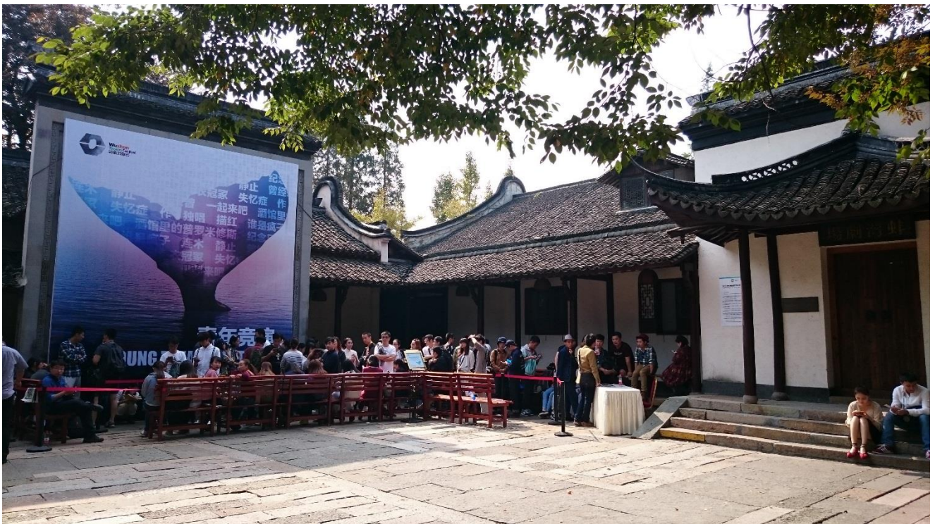
烏鎮戲劇節—蚌灣劇場