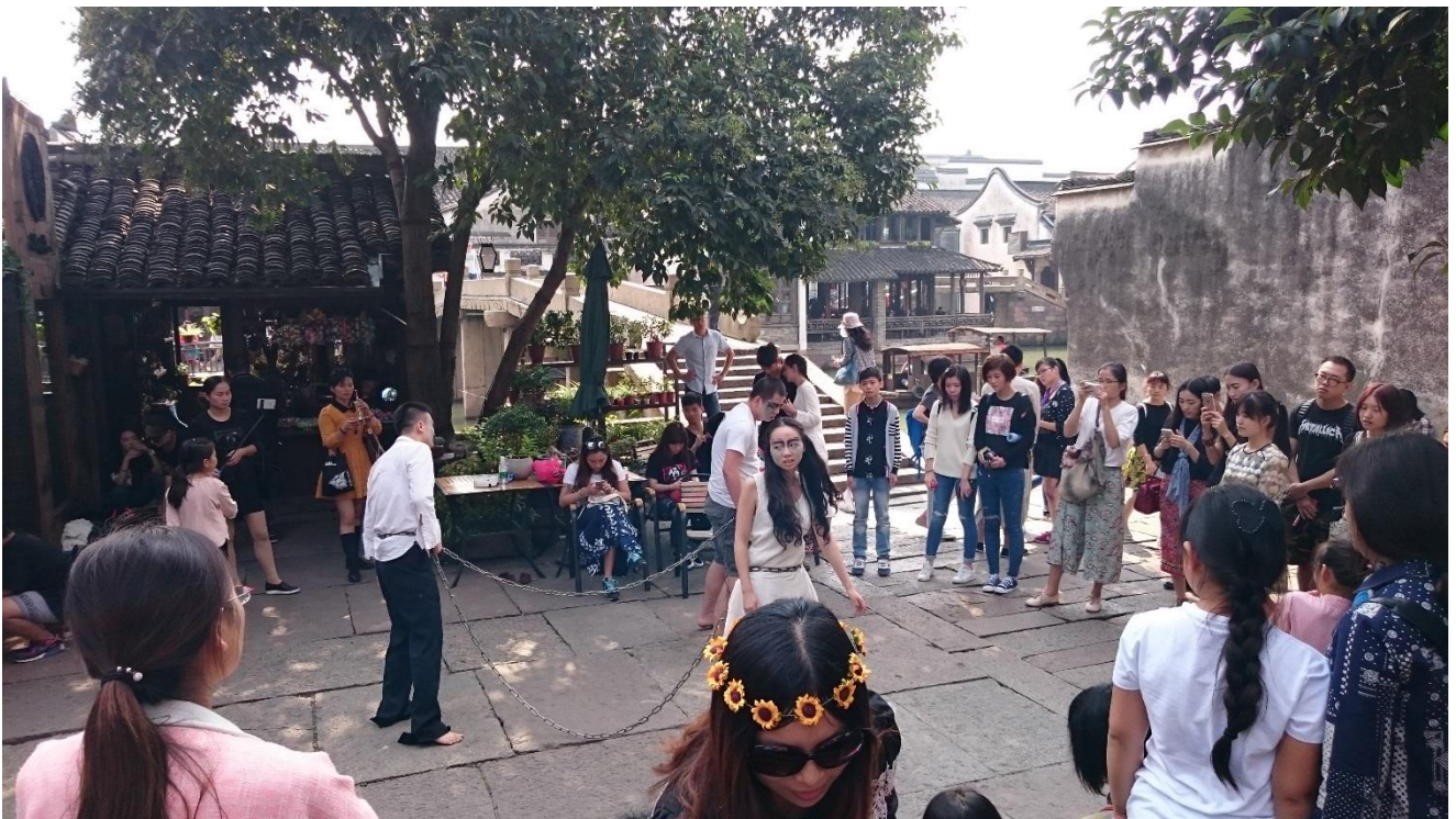
烏鎮戲劇節—小鎮嘉年華