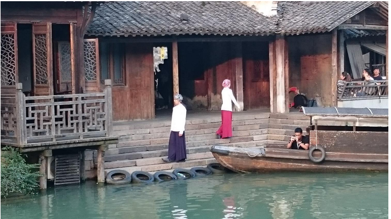
烏鎮戲劇節—小鎮嘉年華