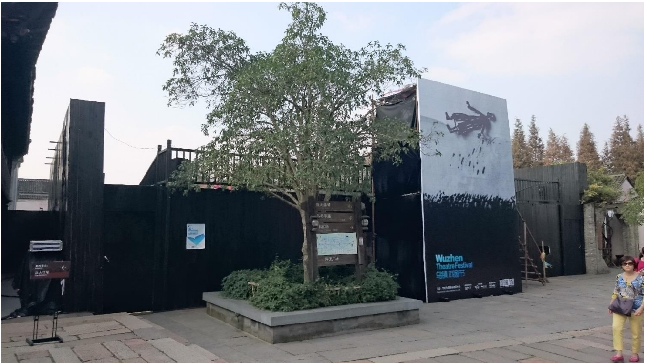
烏鎮戲劇一節詩田廣場