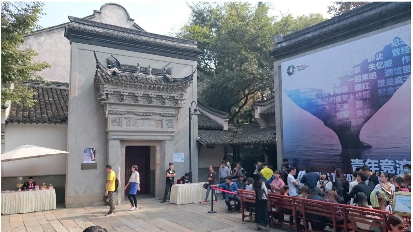
烏鎮戲劇節—秀水廊劇院