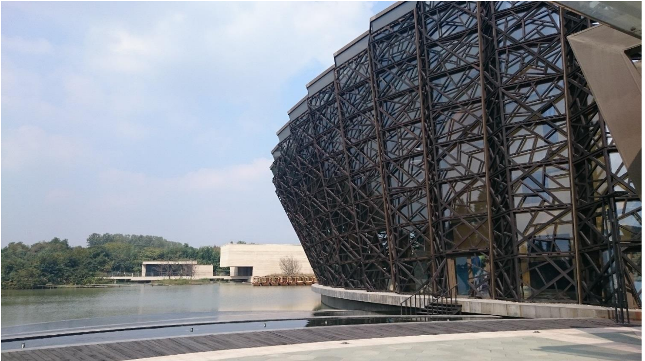
烏鎮戲劇節—烏鎮大劇院外觀