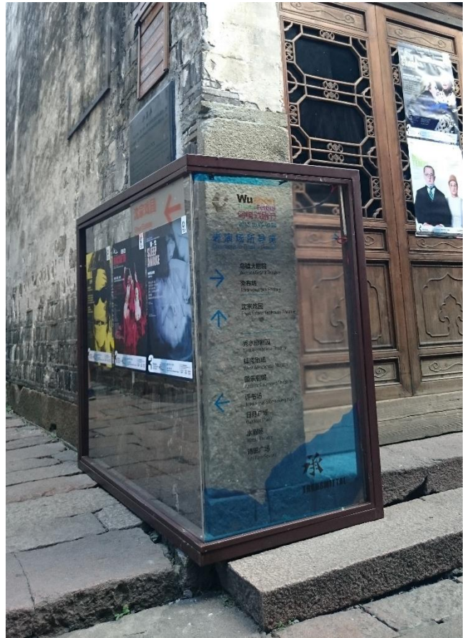
烏鎮街角指標系統及演出海報