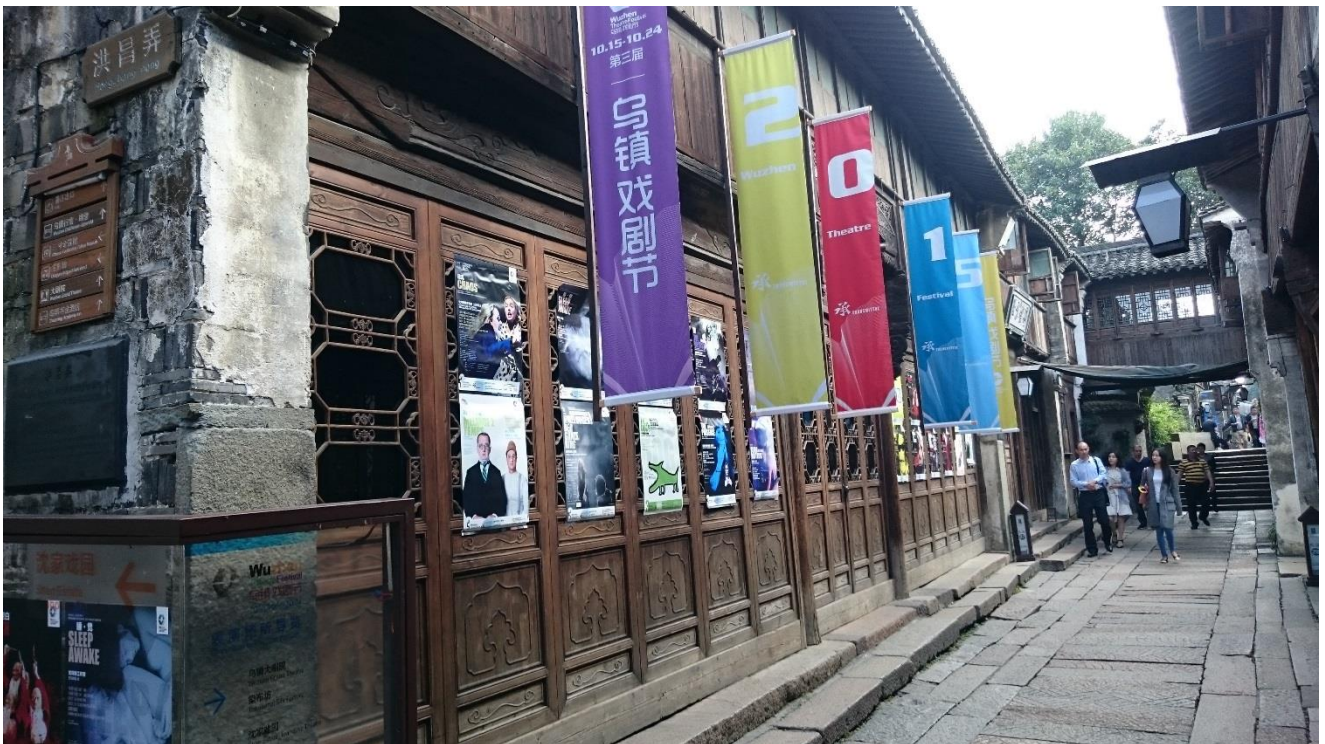
烏鎮戲劇節售票處