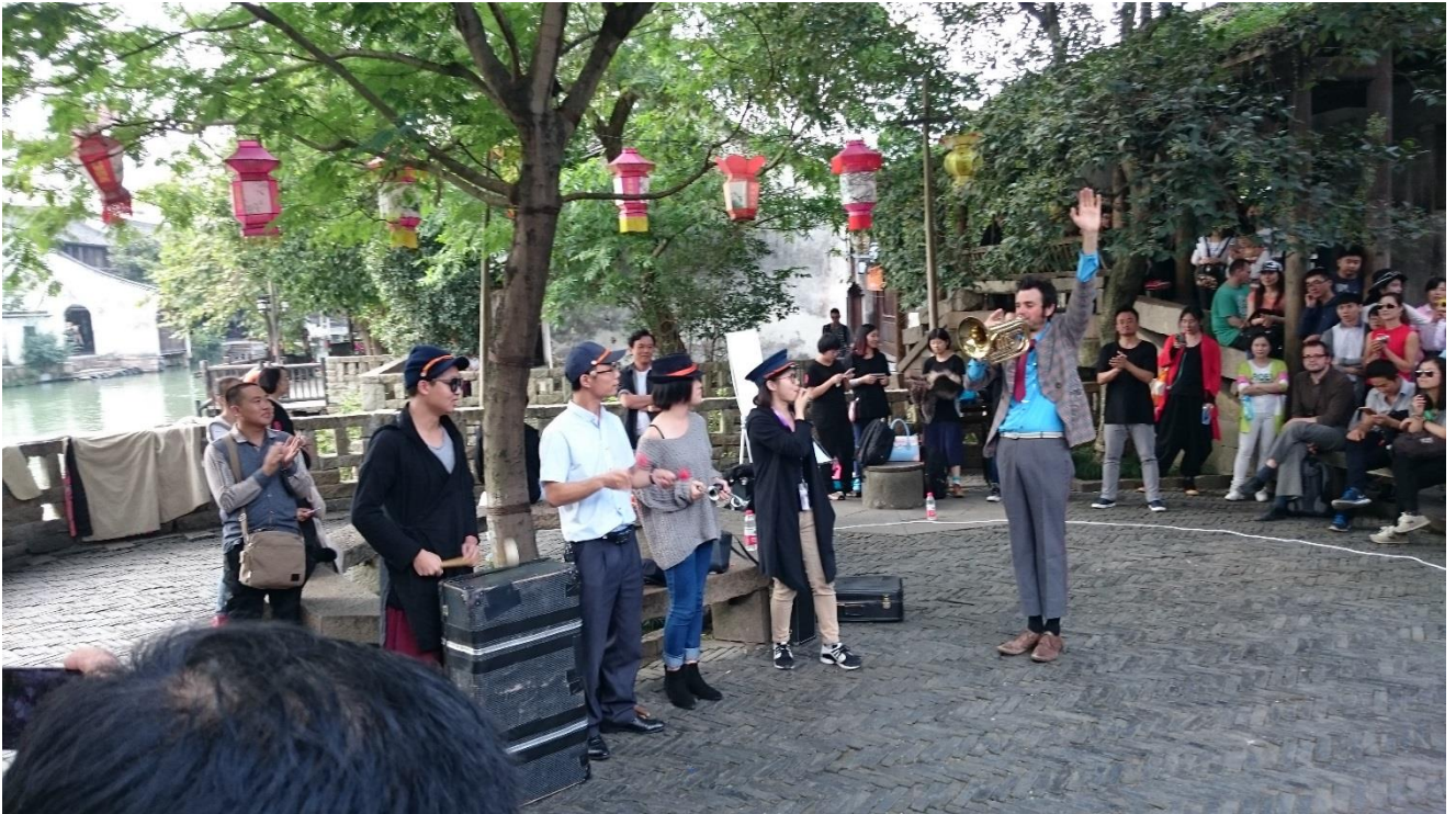
烏鎮戲劇節—小鎮嘉年華