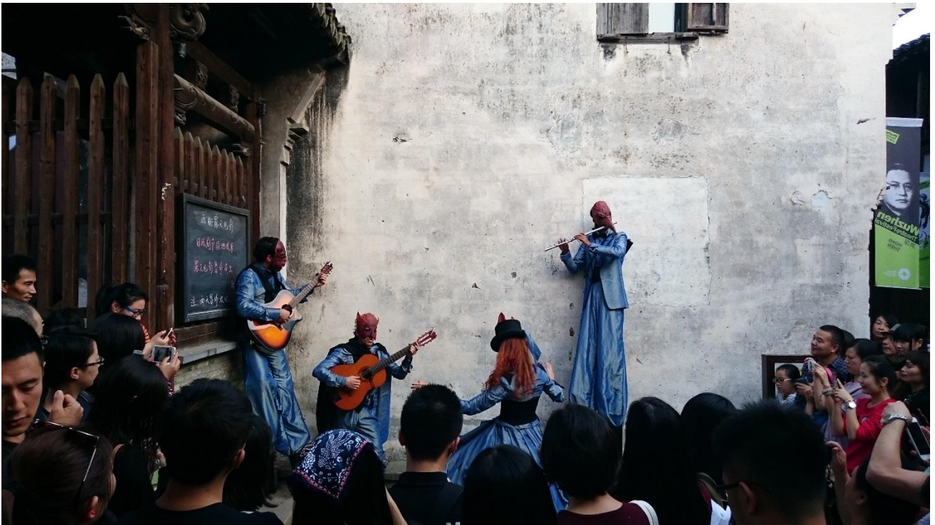
烏鎮戲劇節—小鎮嘉年華