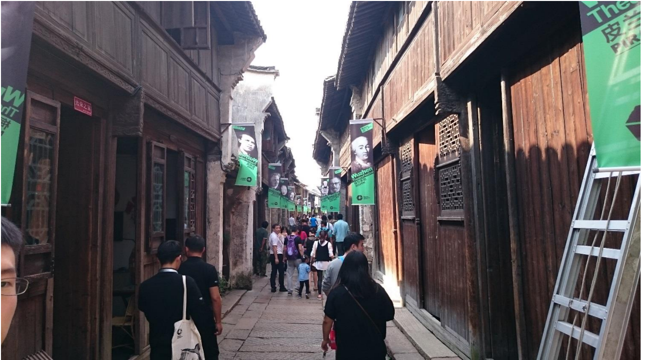
烏鎮街頭藝術大師旗招