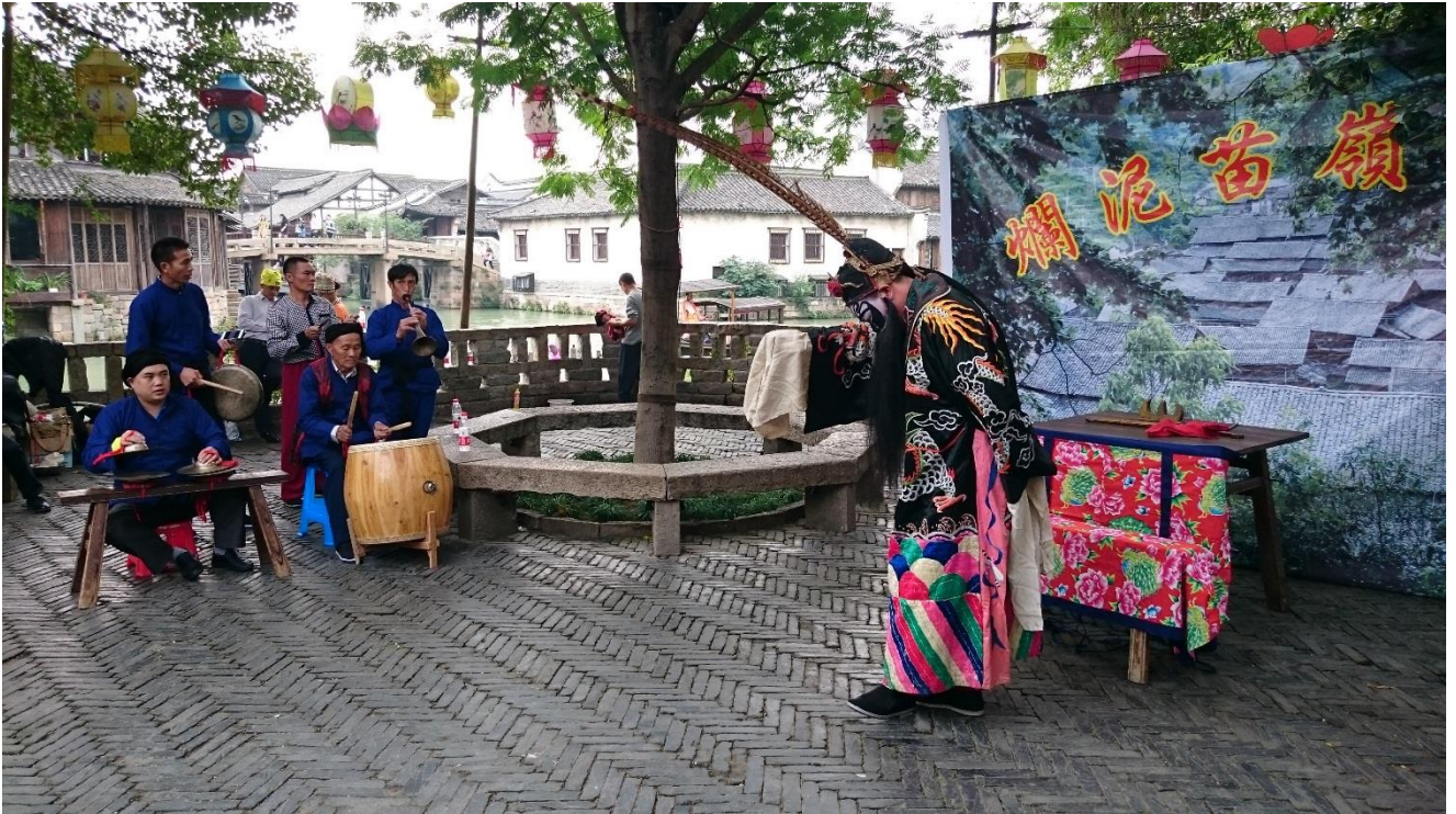
烏鎮戲劇節—小鎮嘉年華