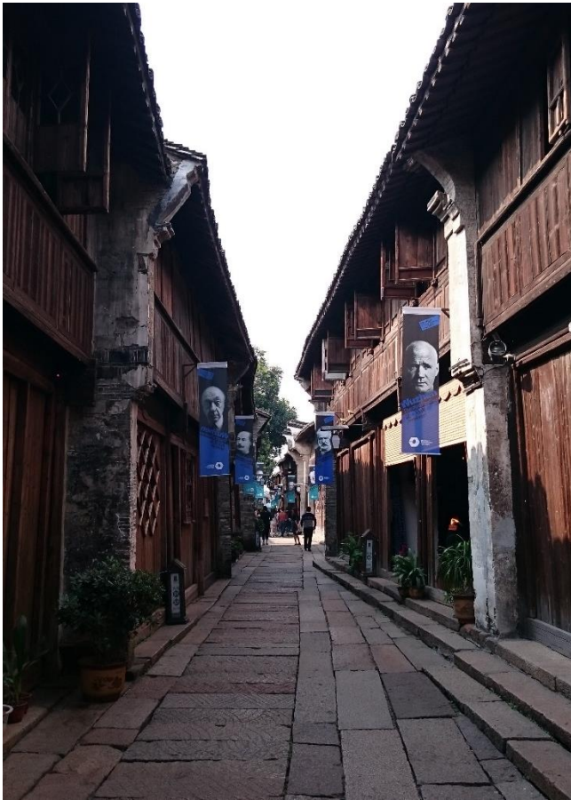
烏鎮街頭藝術大師旗招