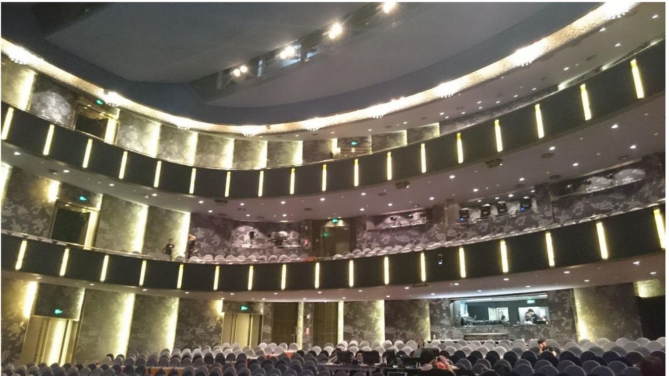
烏鎮戲劇節—烏鎮大劇院觀眾席