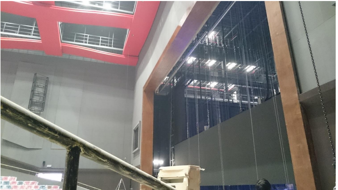
上劇場舞台（未完工）