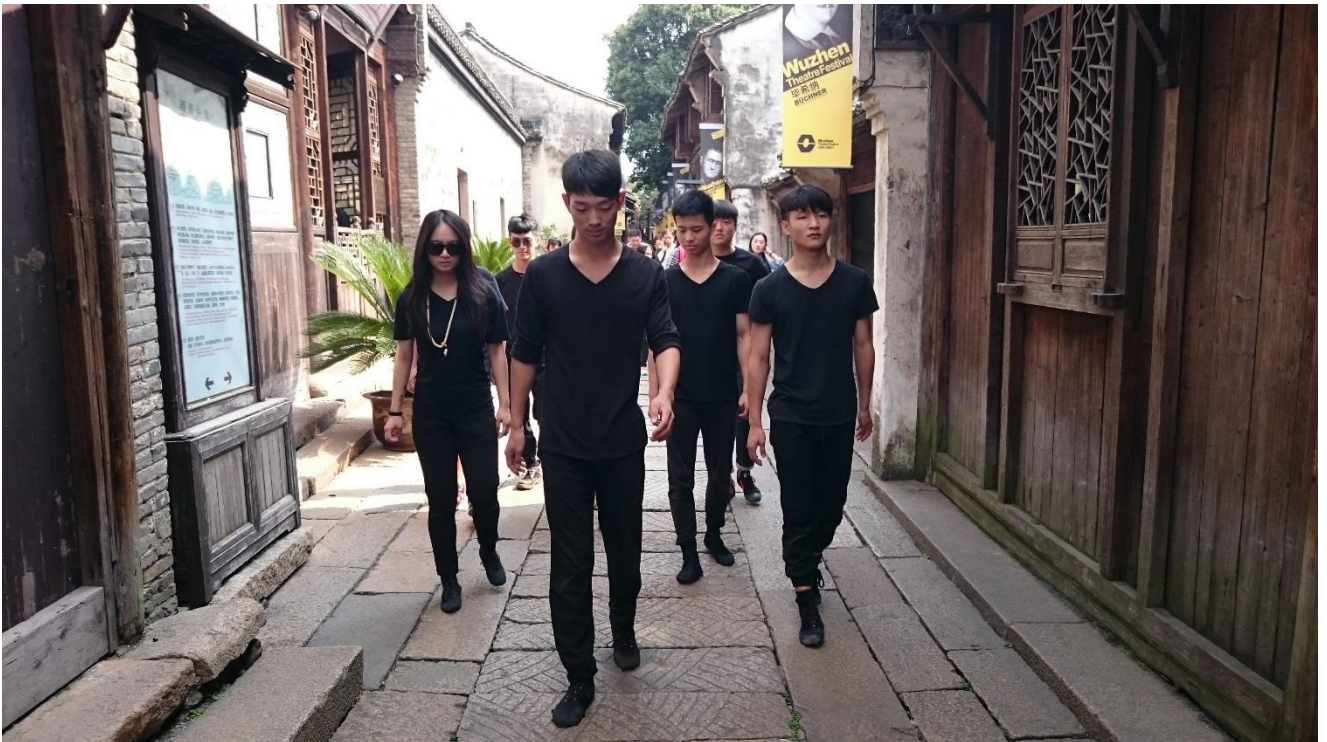
烏鎮戲劇節—小鎮嘉年華