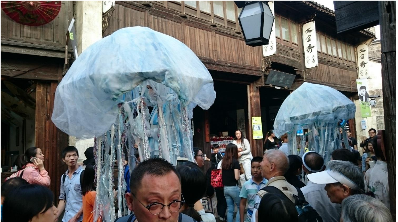
烏鎮戲劇節—小鎮嘉年華