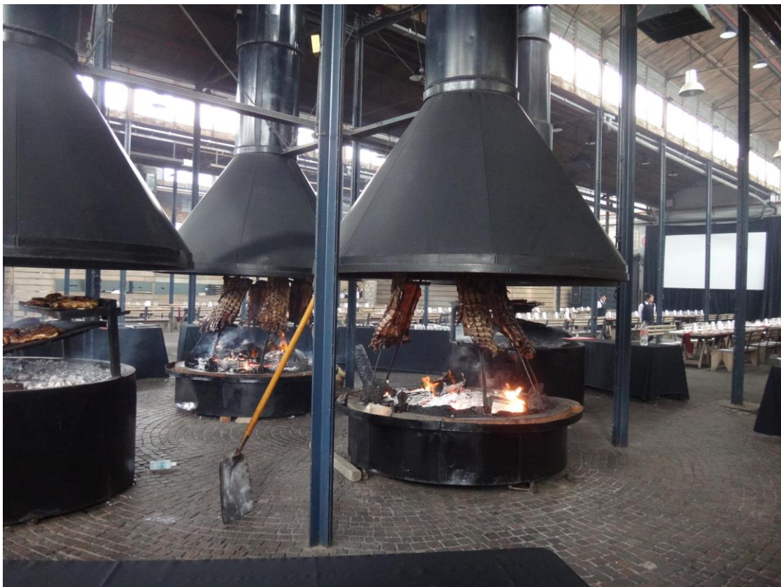
La Rural 會議中心附設的大型餐廳