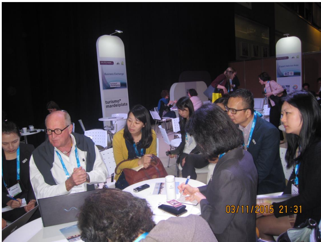
向馬來西亞古晉 ICCA 年會主辦單位請益