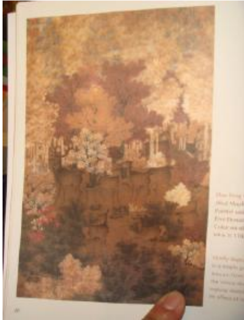
(大陸出版商疑似未經授權使用本院圖像)