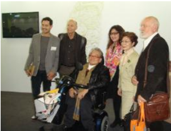
(台灣館開幕貴賓)

故宮此次嚴選參展書目包括《故宮院史留真》、《德佳趣-乾隆皇帝的陶瓷品味》、《日月光華-清宮畫珐瑯》、《水到渠成-清代河工檔案輿圖特展》、《溯古話今談故宮珠寶》、《通曉輕揚-鼻煙壺文化特展圖錄》、《敬天格物-中國歷代玉器》、《河嶽海疆-院藏古輿圖展圖錄》、《20件非看不可的故宮金文》、《親子攜手遊故宮-書畫圖書文獻篇》、《金成旭映-清雍正珐瑯彩瓷》、《順風相送-院藏清代海洋史料