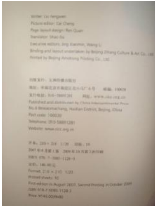
(大陸出版商疑似侵權之出版品版權頁)