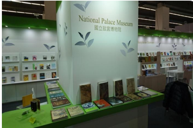
(國立故宮博物院展區)

乎所有的通關旅客都要經過仔細的盤問才得放行。10月13日到達書展會場，本院工作人員隨即展開布展工作，將帶來參展之出版品妥善佈置。隔日開展後，可隨時接受同業及參觀民眾之諮詢，此外，亦赴各展覽館及重點攤位考察出版、授權、出版品類與發展趨勢等相關業務，並與此次同行的官方及台灣出版業界人士互訪交流交換心得。