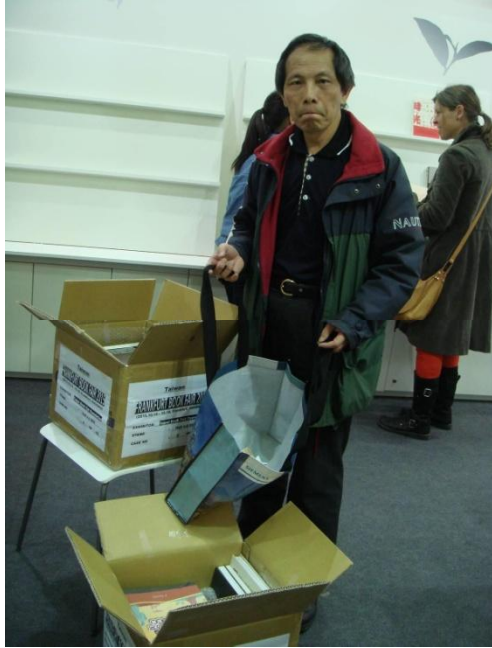
(駐德外館人員檢視出版品)