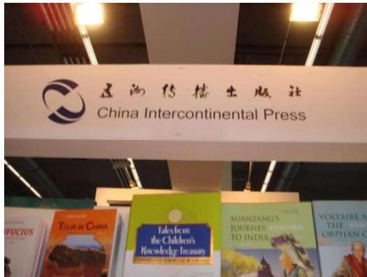
(大陸出版商疑似侵權之出版商公司名稱)