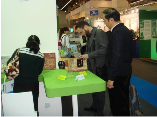
(本院工作人員現場解說)

特展》、《古籍密檔-院藏圖書文獻珍品》、《履踪-台灣原住民圖畫文獻特展》、《明四大家-沈周》、《明四大家-文徵明》、《明四大家-唐寅》、《明四大家-仇英》、《集瓊藻-院藏珍玩菁華展》、《精彩一百-國寶總動員》等。