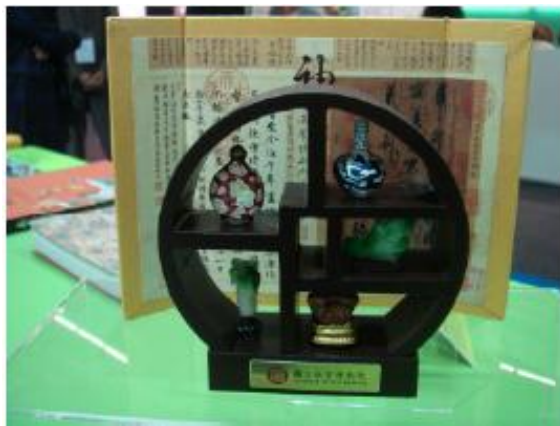
(本院文創商品頗為吸睛)