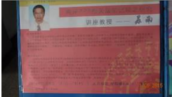
蘇南教授演講海報