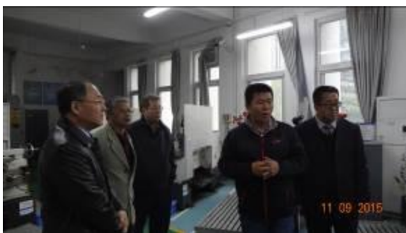
參觀工程實踐創新中心