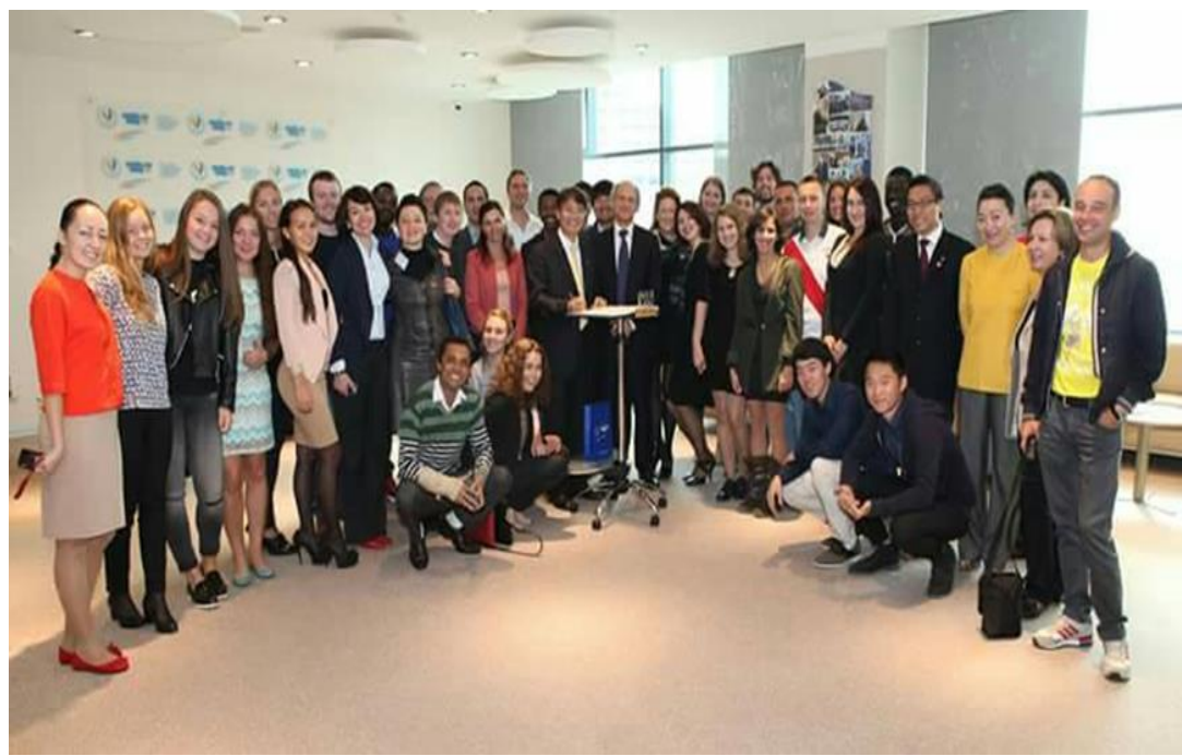
演講後，高校長與學校師生合影