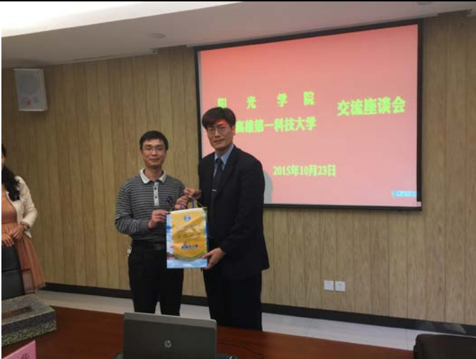
贈陽光學院紀念旗