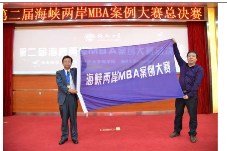
海峽兩岸 MBA 舉辦權交接儀式