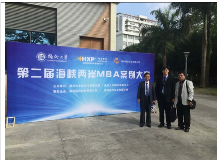
二屆海峽兩岸 MBA 案例大賽會場