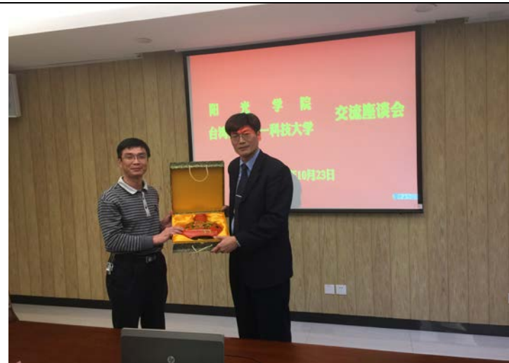
贈財金學院紀念品