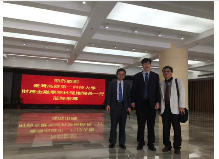
閩江學院圖書館前