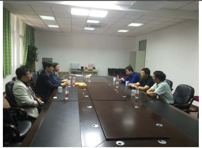
與福州大學經濟與管理學院簽約儀式會場