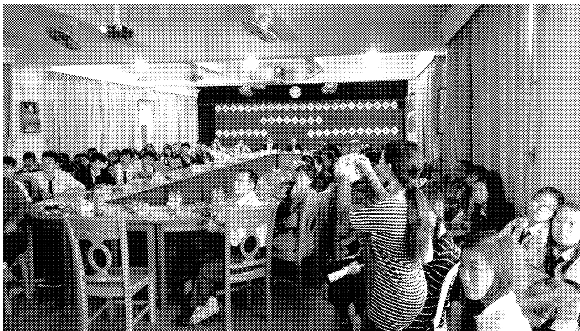
曼德勒宣導會現場參加人員專注聽解宣導內容