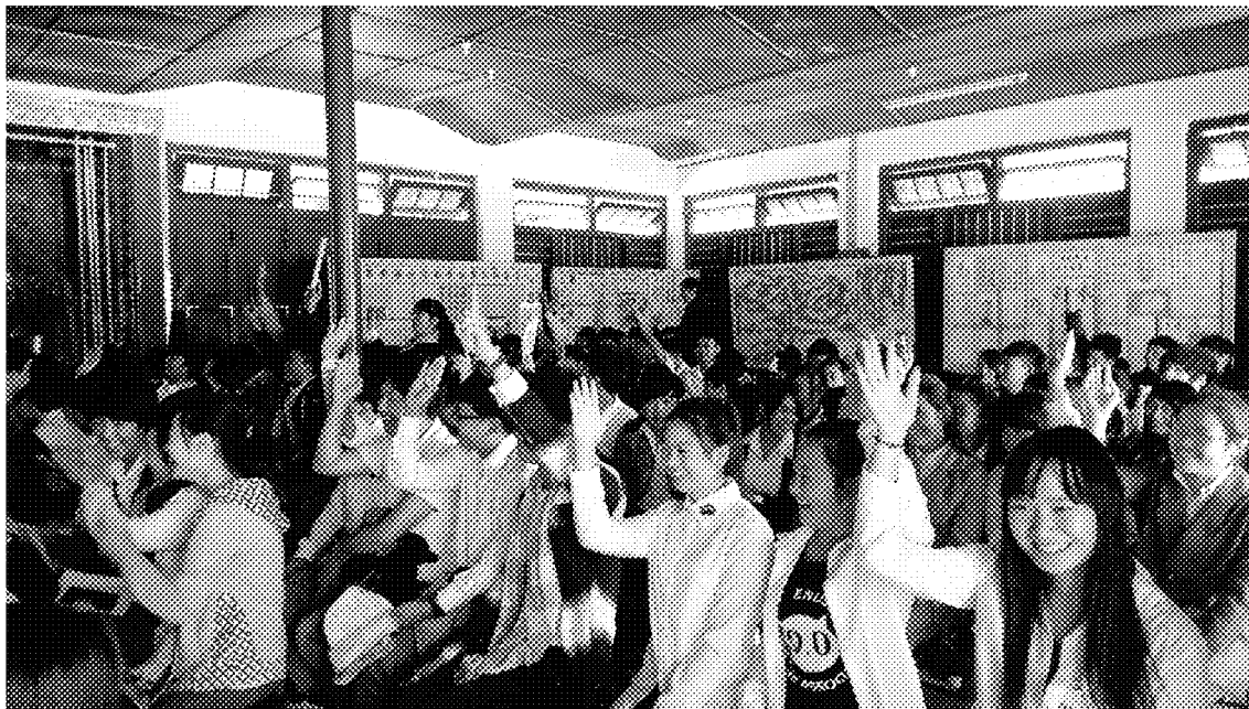
眉苗佛經學校宣導會現場參與學生提問情形