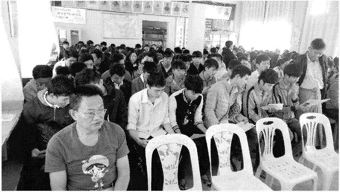
密支那宣導會現場參加學生閱覽宣導資料暨交流