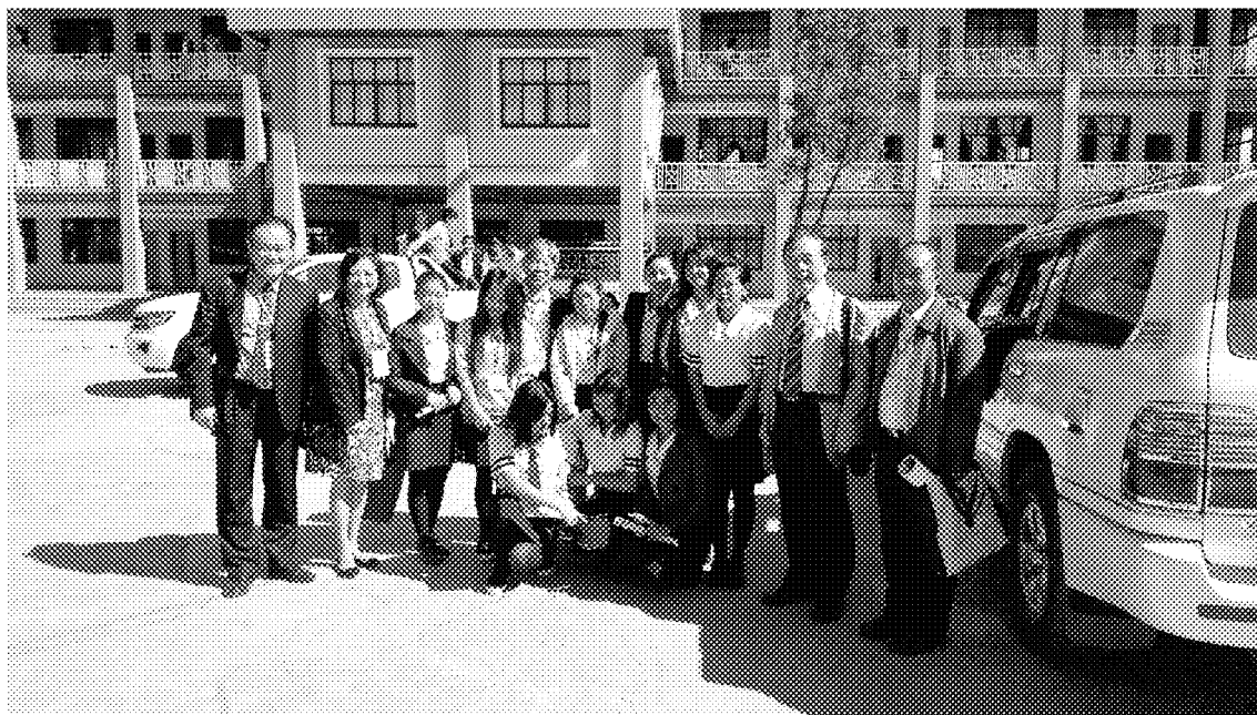
臘戌宣導會後校務人員及輔導幹部於校內參訪