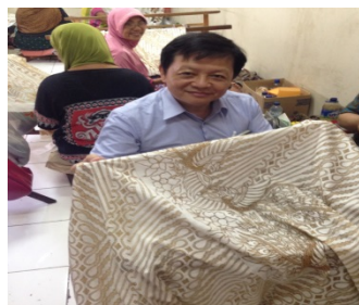
學術交流討論、協議書、博物館與傳統服裝店