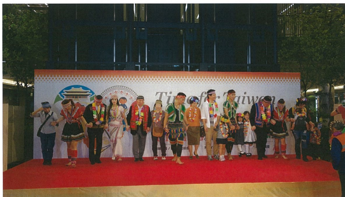
邀請現場民眾一同上臺共舞同樂