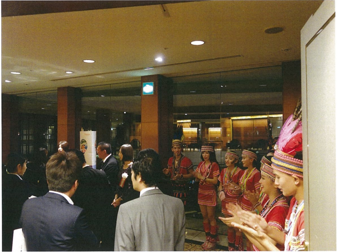
懇親會結束，歡送業者