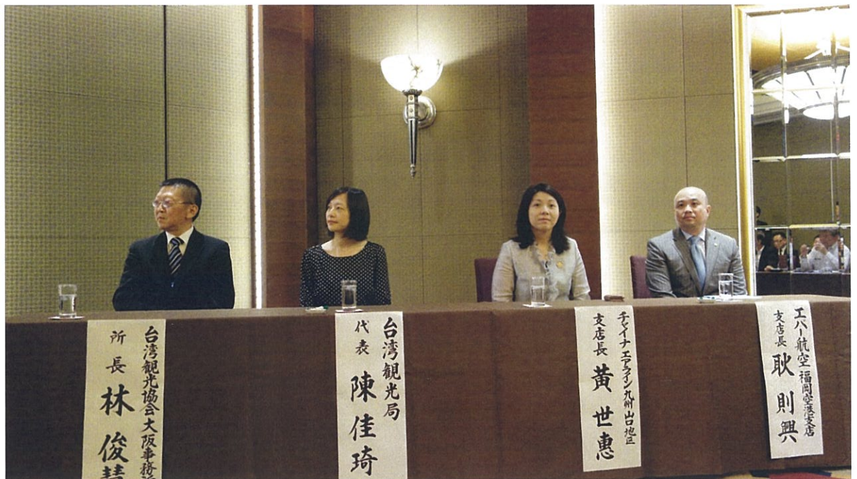
本局人員與中華航空、長榮航空代表列席聽取業者意見