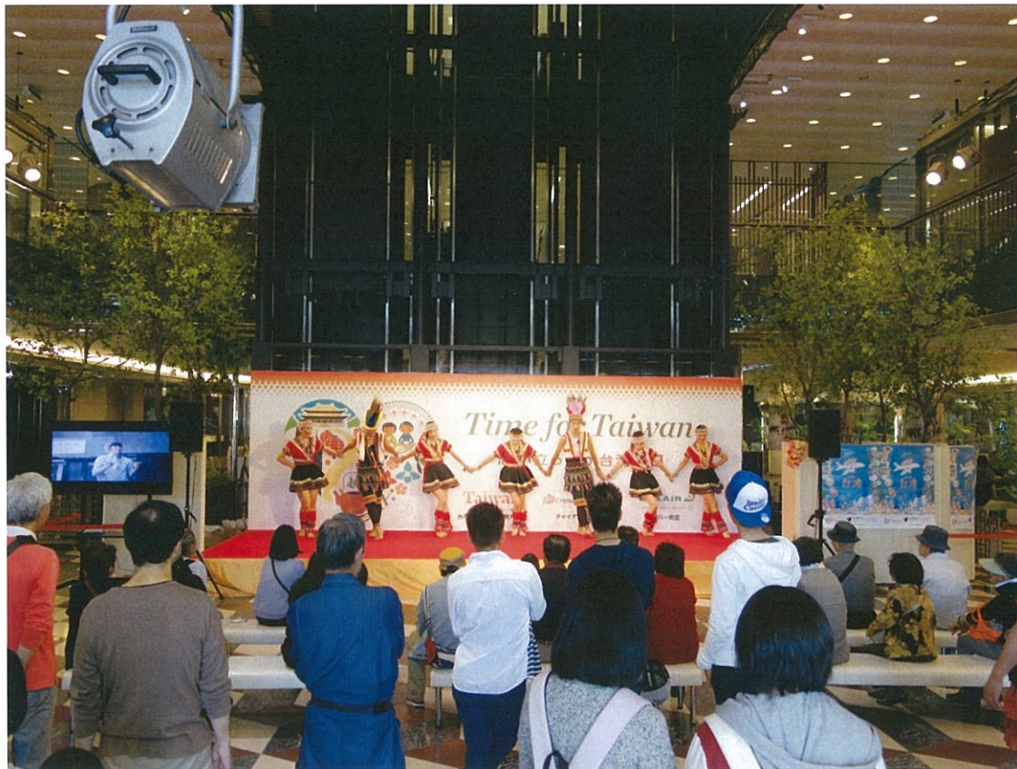
酋長文化村團員精彩的表演吸引眾多民眾駐足觀賞，一旁電視播放最新臺灣觀光宣傳影片