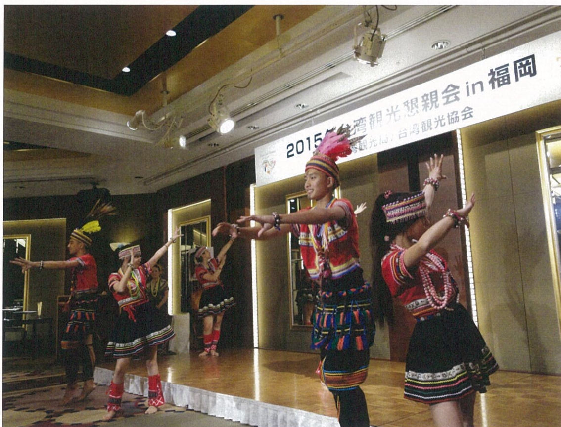
懇親會上原住民歌舞表演情況