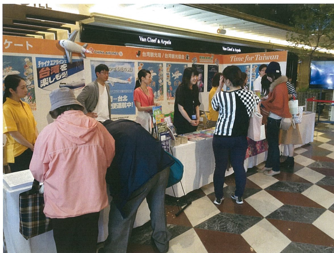
民眾前往舞臺旁攤位詢問臺灣旅遊訊息及索取文宣