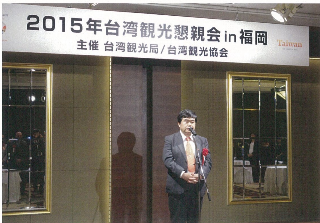
台北駐福岡經濟文化代表處戎義俊處長親臨並於懇親會致詞