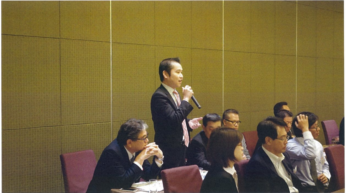
說明會 Q&A 時間，業者提出臺灣觀光推廣建言