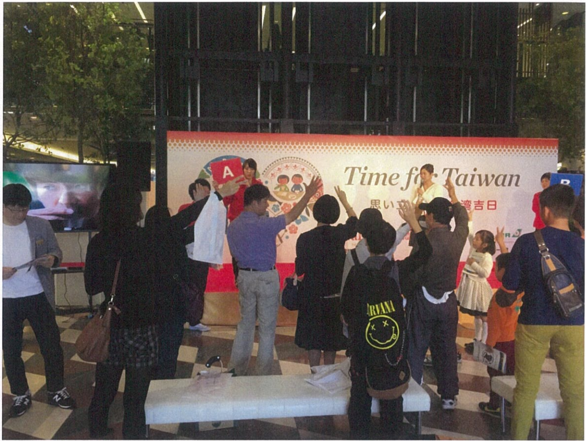
臺灣觀光景點猜謎活動現況 參加者踴躍