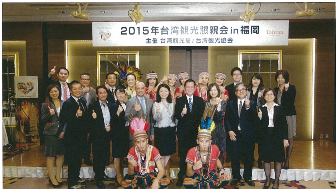
推廣結束後所有工作人員合影