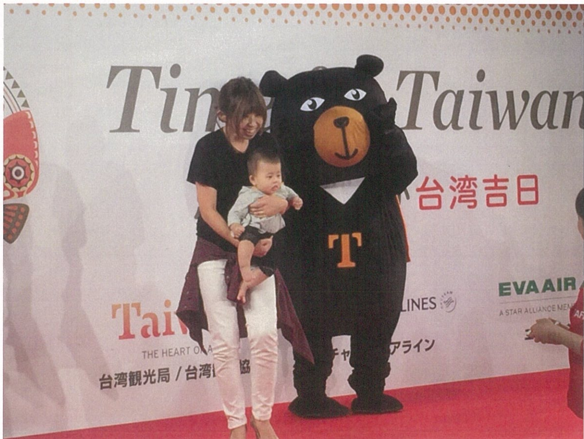
民眾開心與喔熊組長合影