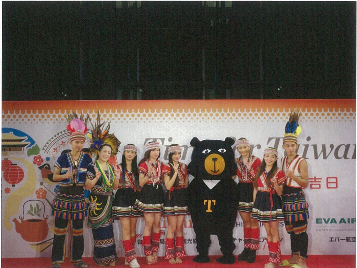
酋長文化村團員與本局超級任務組喔熊組長合影