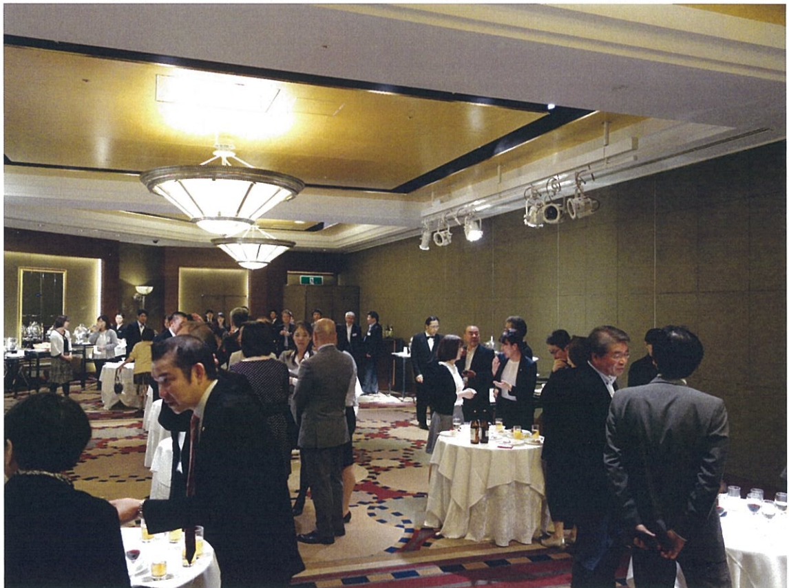
懇親會上業者交流情況