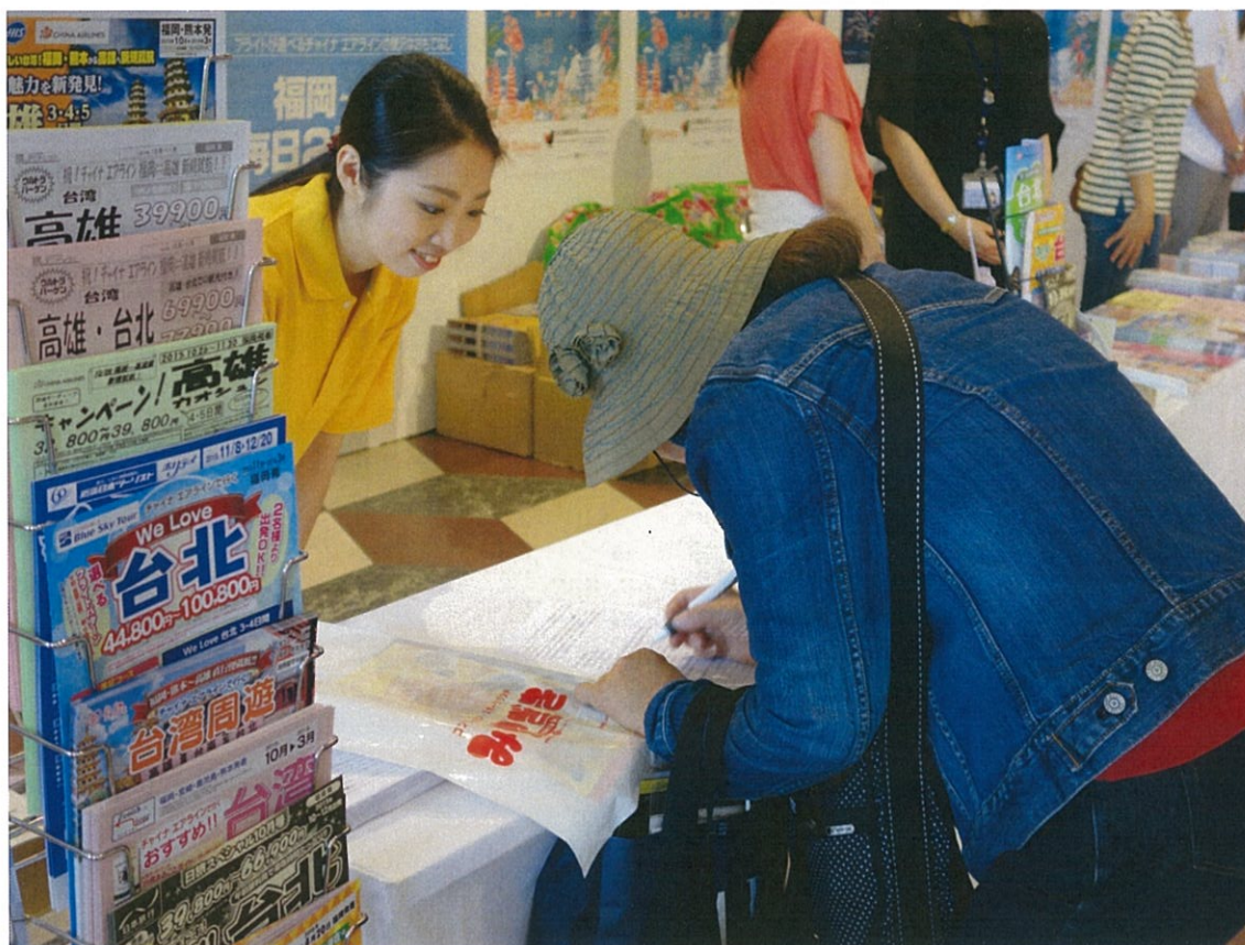
參觀民眾填寫問券