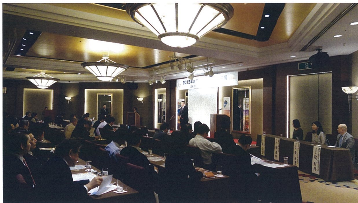
臺灣觀光推廣說明會舉辦實況