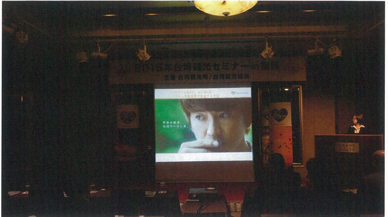
説明會時播放由國際名導吳宇森及知名藝人木村拓哉合作拍攝之臺灣觀光宣傳影片