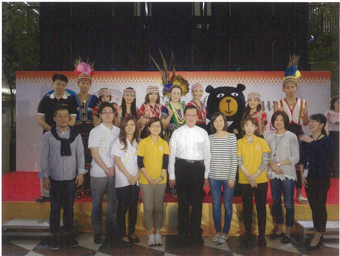
街頭展演及臺灣攤位廣宣活動順利結束後，現場工作人員合影