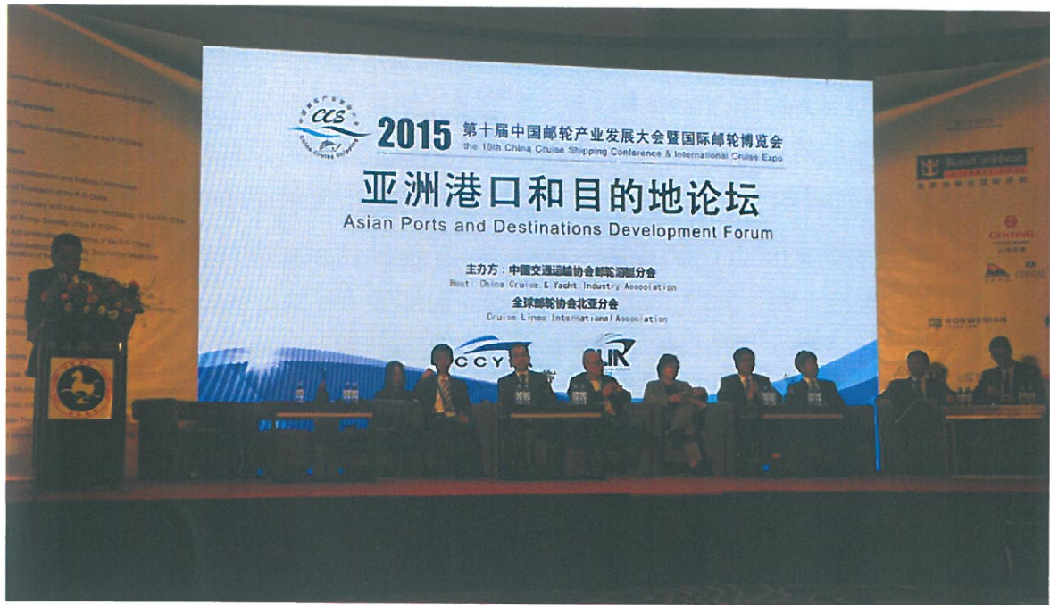
圖 1. 亞洲港口和目的地論壇