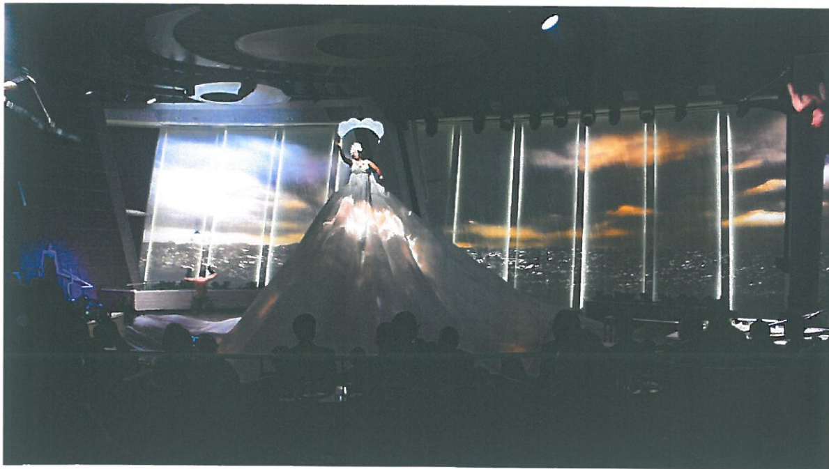
圖 13. Vistarama 的落地玻璃幕牆