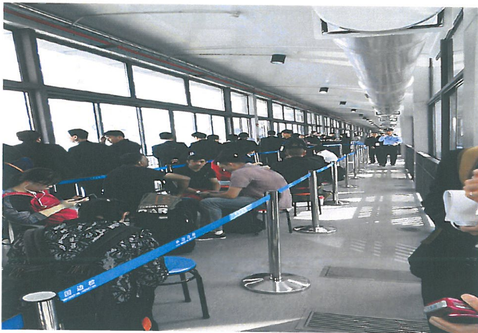
圖 10.上海吳淞口國際郵輪碼頭登船迴道候登船