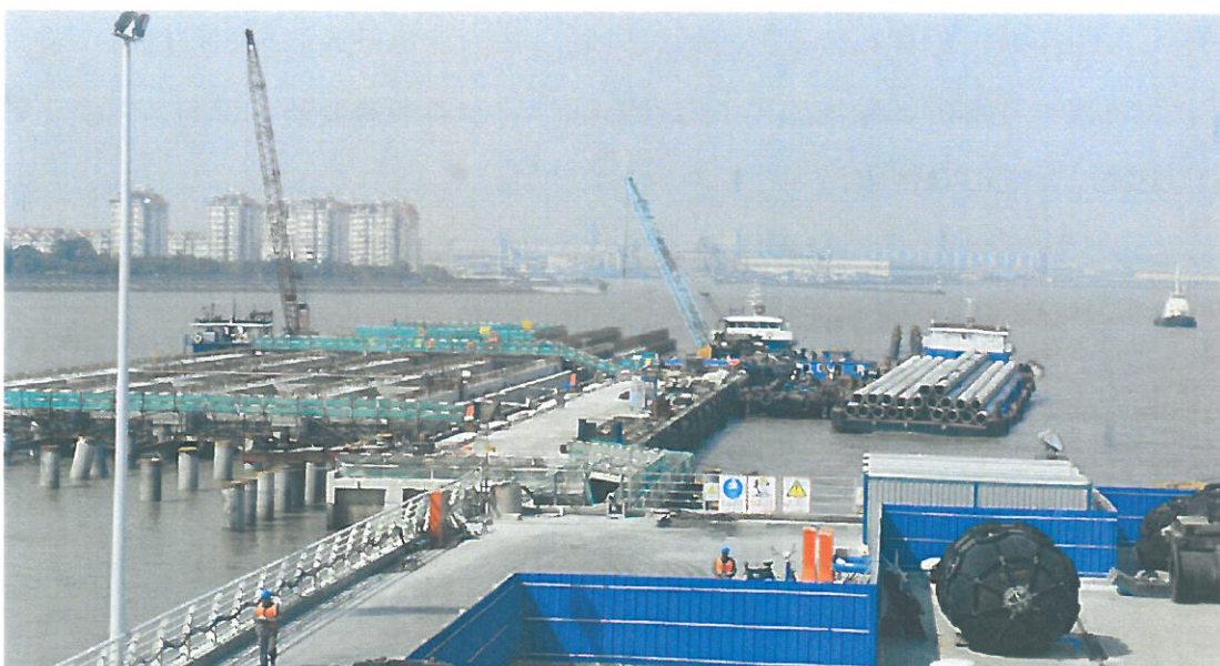
圖 6 .上海吳淞口國際郵輪碼頭擴建施工圖