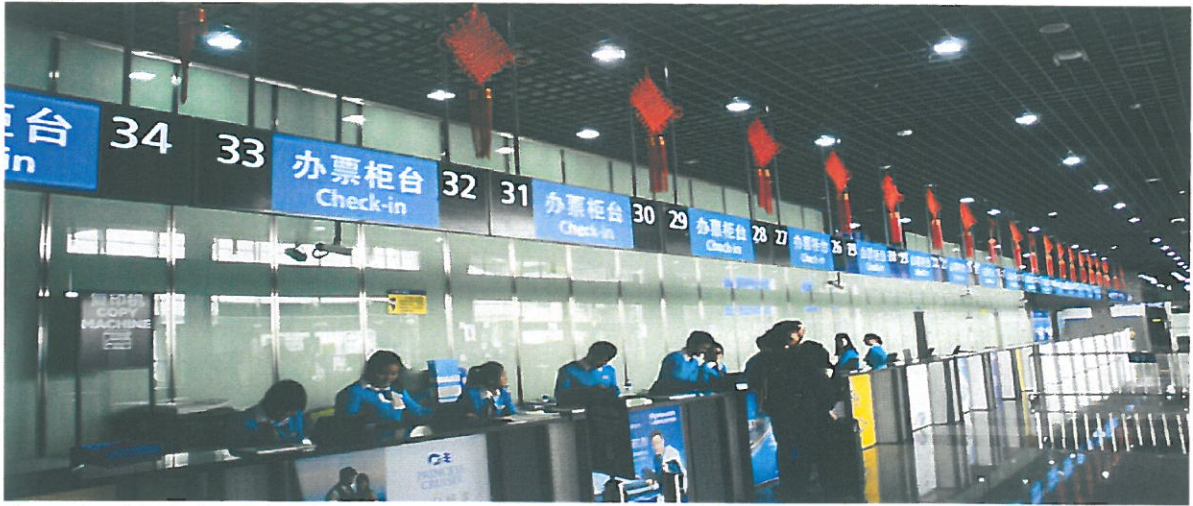
圖 7.上海吳淞口國際郵輪碼頭售票處