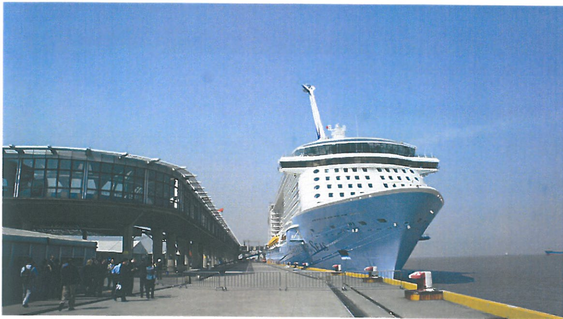
圖 5.海洋量子號泊靠上海吳淞口國際郵輪碼頭

由於碼頭只能同時停靠 2 艘 8 萬噸以上的大型郵輪，2015 年已啟動碼頭擴建工程，預計 2017 年擴建部份即可啟動使用。擴建工程主要為增加 2 個泊位，建成後碼頭總長度將達 1,600 米，共可佈置 2 個 22.5 萬噸級和 2 個 15 萬噸級總計 4 個大型郵輪泊位，屆時年旅客總通過量將從現在的 60.8 萬人次提升至 357.8 萬人次。