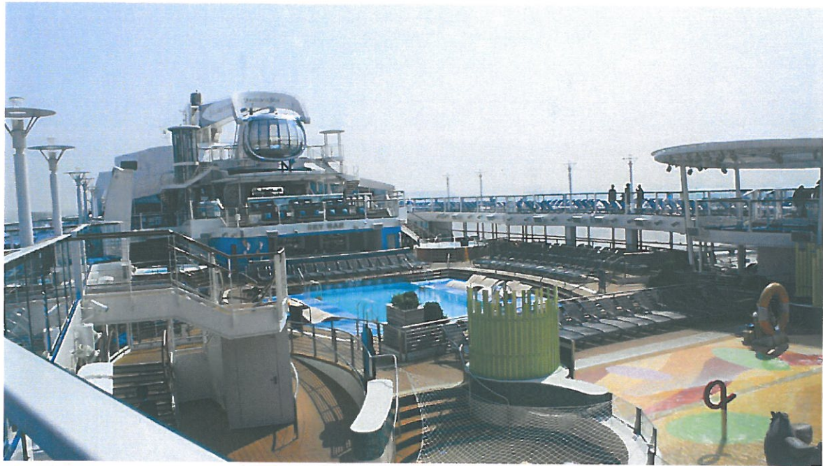
圖 12. 船上新穎的休閒設施