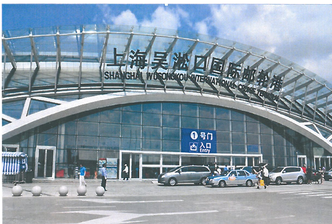
圖 4.上海吳淞口國際郵輪港

上海吳淞口國際郵輪港位於上海吳淞口長江岸線的炮臺灣水域，即長江、黃浦江、蕓藻浜三江交匯處，其優越之天然水深資源及地理優勢，完善的聯外交通網路，使其成為目前亞太地區最為繁忙的國際郵輪母港。