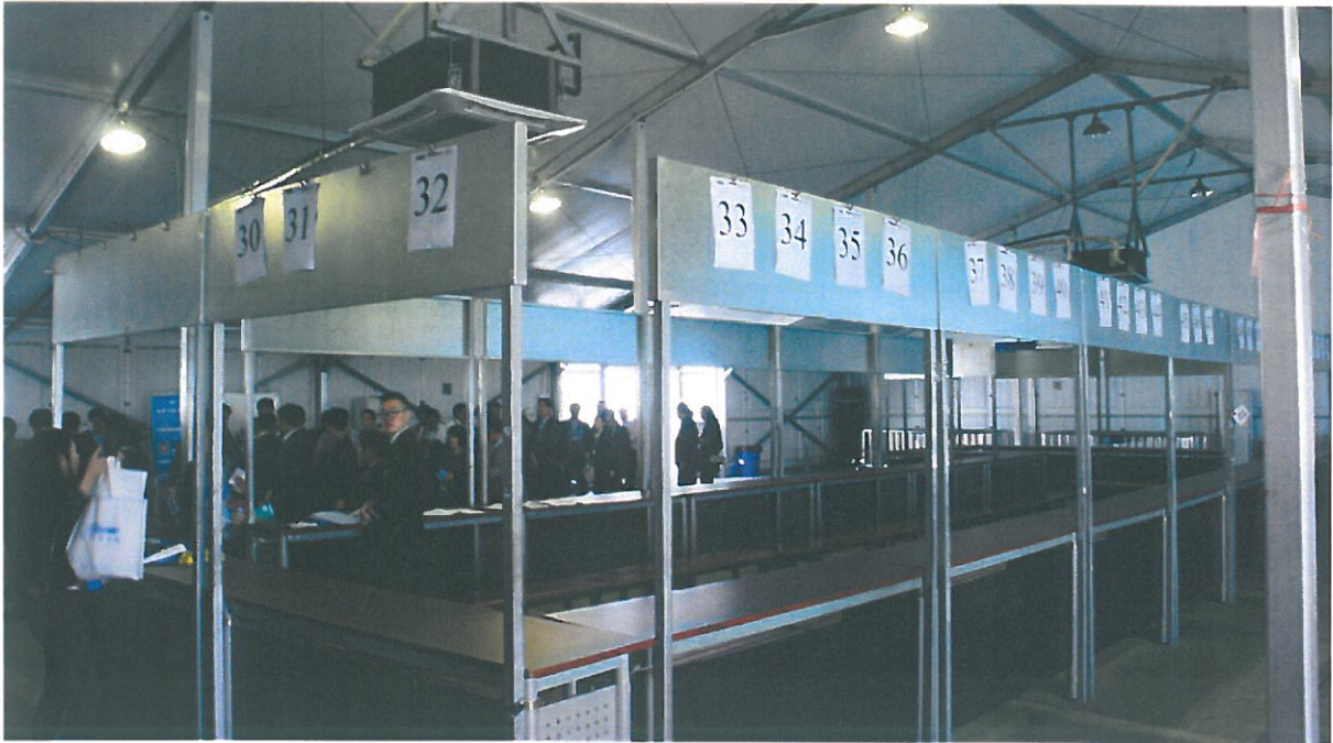
圖 8.上海吳淞口國際郵輪碼頭簡易候船室