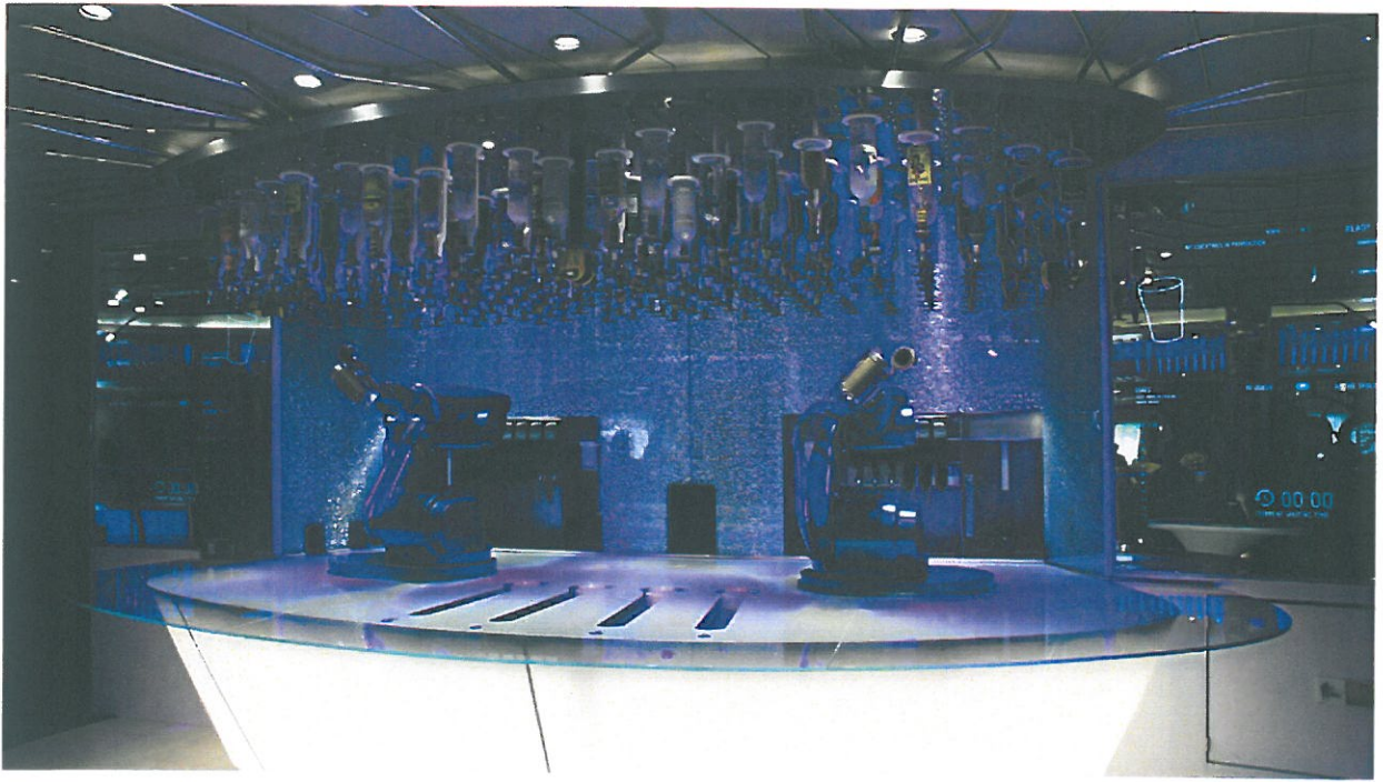
圖 14. 調酒機器人