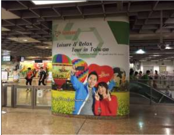
牛車水站的包站式巨幅戶外廣告