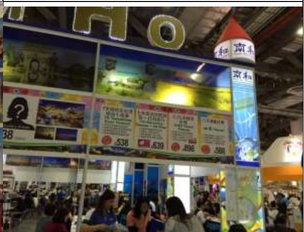
南和旅行社以顯著看板宣傳台灣商品