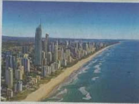
澳洲昆士兰州黄金海岸美景。