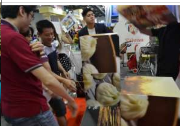
設計台灣美食拼圖活動，加深民眾印象