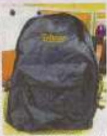
订购台湾配套,送“喔熊”背包。

台湾馆精心准备三大好康与公众分享,还有令人期待的台湾超级宣传偶像——喔熊,也将在现场与大家同乐。