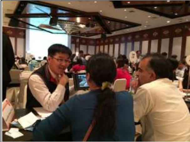
農場業者向印度買家推廣農場休閒遊程