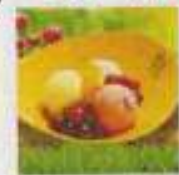
宜兰罗东特色小吃包心粉圆免费品尝。

旅展期间,向各大旅行社订购台湾配套,可在台湾观光局展台换取“喔熊”(Oh Bear)背包,还赠送新鲜芒果,数量有限,送完为止。