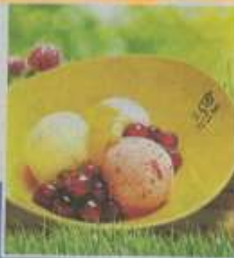
↑台湾宜兰魏姐包心粉圆