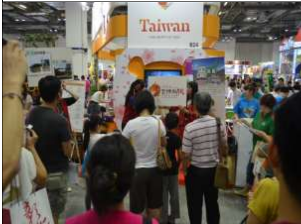
桃園縣政府於舞台上宣傳 2016 臺灣燈會