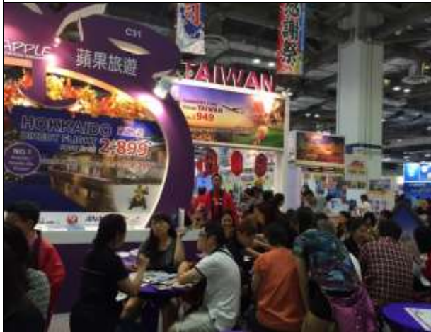
蘋果旅行社台灣商品販售區，民眾訂購踴躍