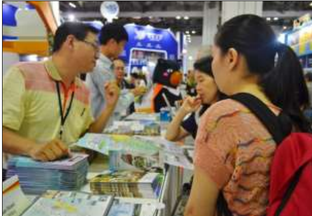
業者細心宣傳自家商品