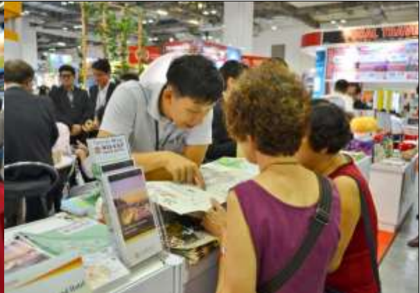
民眾詳細詢問台灣住宿商品