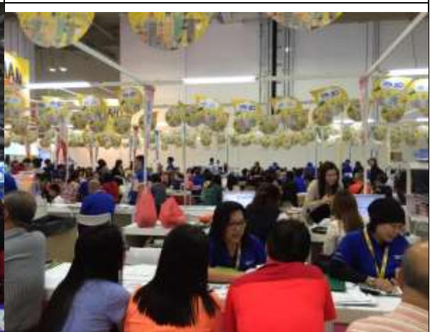
曾兄弟旅行社超大規模的現場預訂情況(前方為臺灣商品)，極為壯觀。