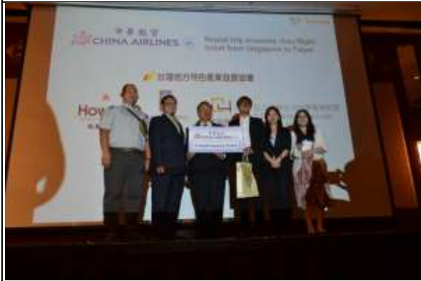
張大同大使頒發首獎-