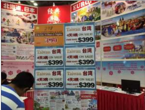
經典旅行社販售多樣的台灣遊程