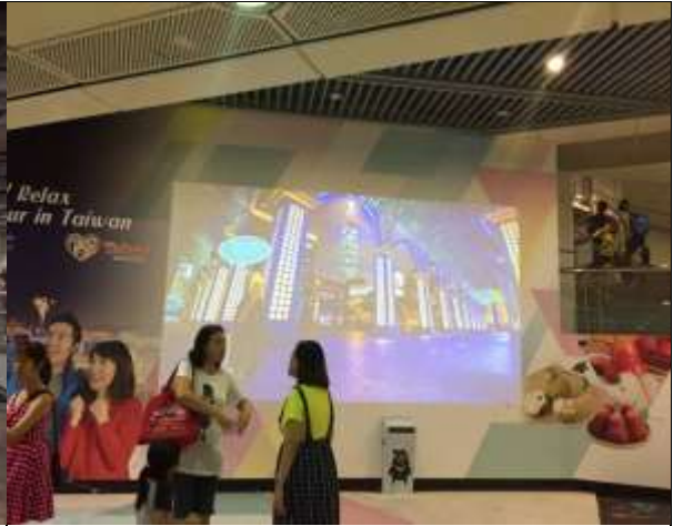
聖多美哥站的台北 101 互動式自拍體驗區