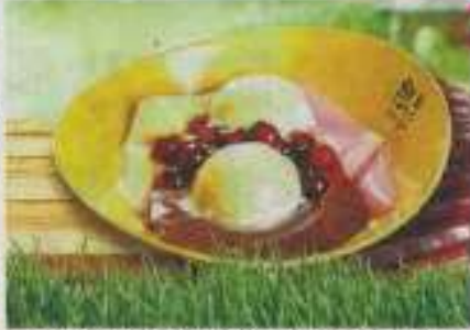
宜兰罗东特色小吃包心粉圆免费品尝。