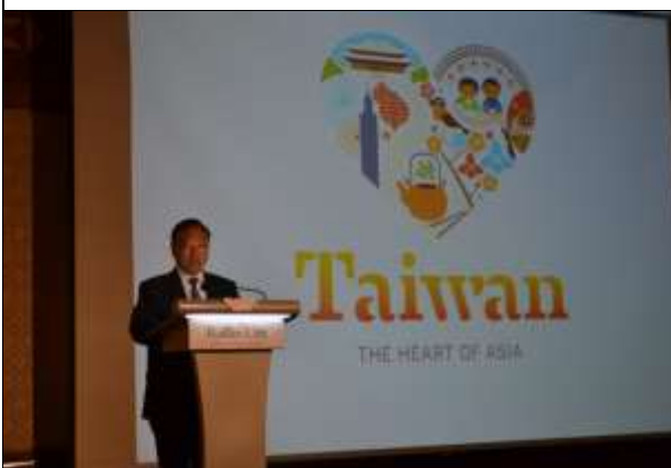
駐新加坡台北代表處張大同大使蒞臨現場指導，為業者加油打氣。