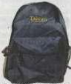
订购台湾配套，送背包。

旅展期间，向各大旅行社订购台湾配套，可在台湾观光局展台换取背包，还赠送新鲜芒果，数量有限，送完为止。