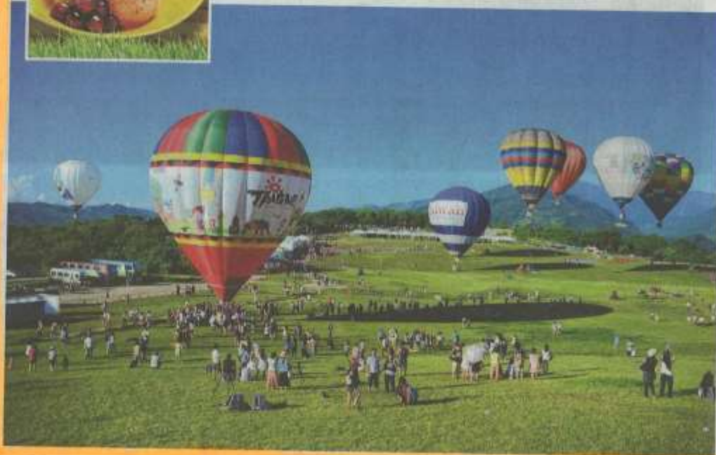
↓台湾鹿野热气球嘉年华