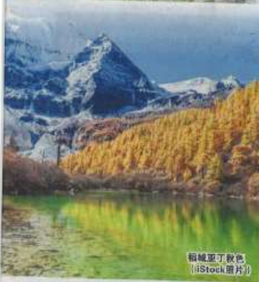
稻城亚丁秋色