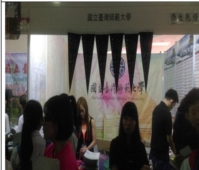
觀摩他校攤位之佈置(二)