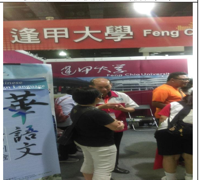
觀摩他校攤位之佈置(一)