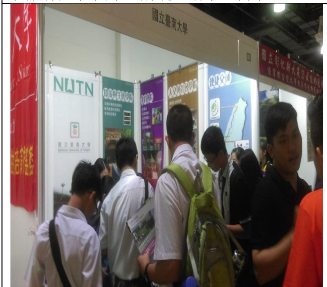
參觀學生在本校攤位洽詢情況(二)