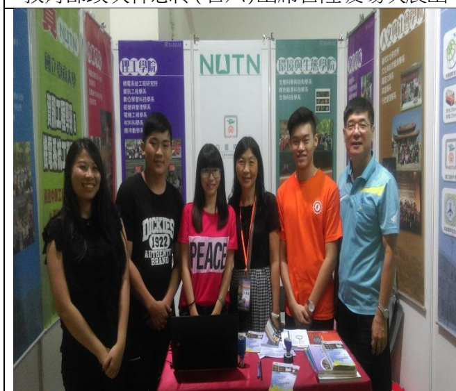
本校參展人員及協助學生