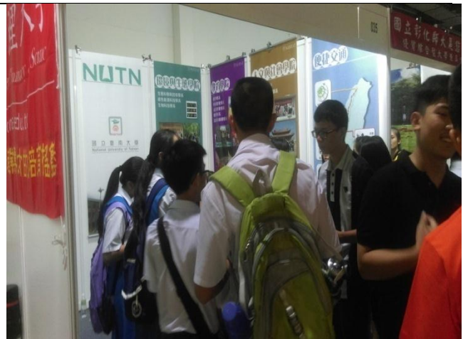
參觀學生在本校攤位洽詢情況(一)