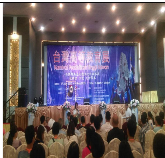
麻坡教育展場次開幕式