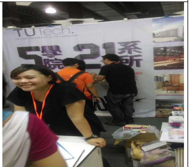
觀摩他校攤位之佈置(三)