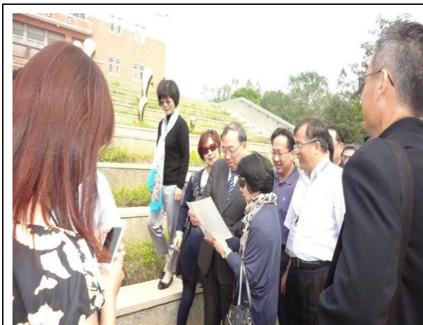
參觀金門大學校園設施實地