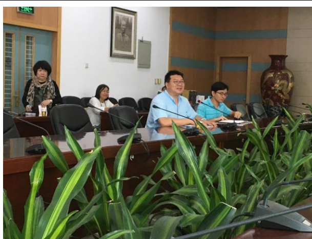
參訪人員與廈門大學經驗交流座談會