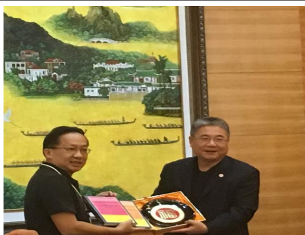
參訪人員與福州大學交換紀念品