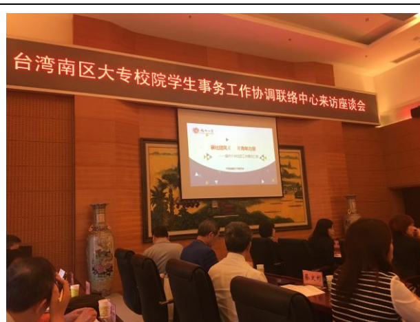
參訪人員與福州大學經驗交流座談會