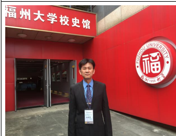
參觀福州大學校史館