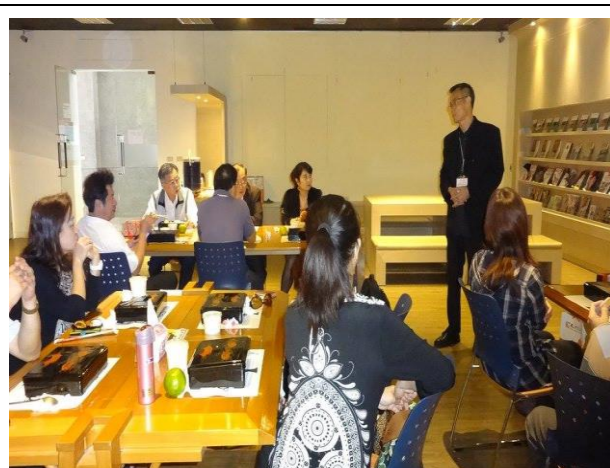
金門大學進行經驗交流分享、餐敘