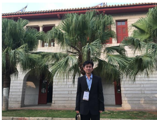
實地參觀廈門大學魯迅紀念館