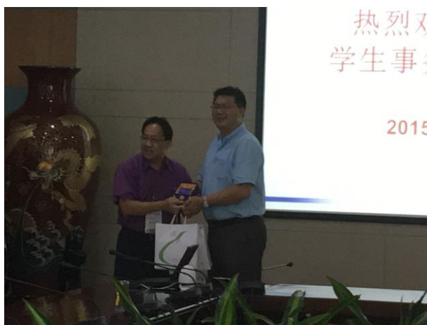
參訪人員與廈門大學交換紀念品