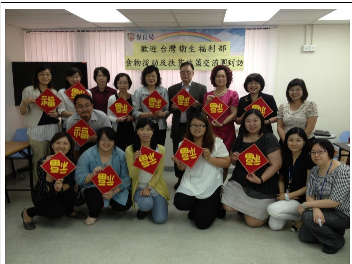
參訪保良局藍田就業服務中心