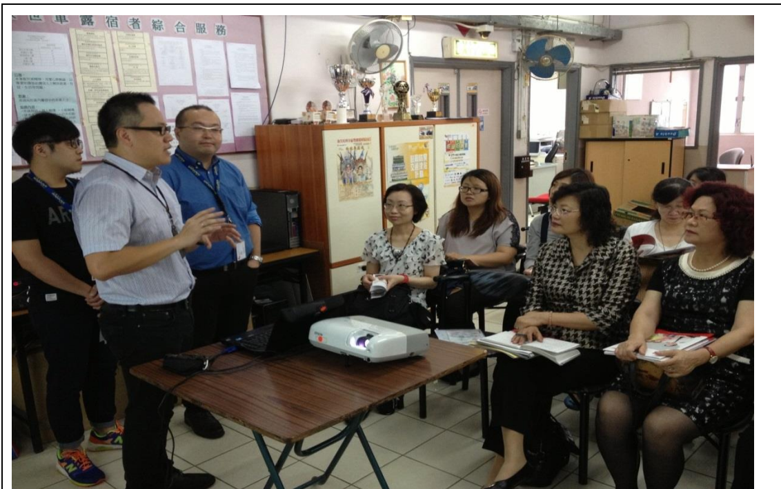
參訪救世軍露宿者綜合服務中心