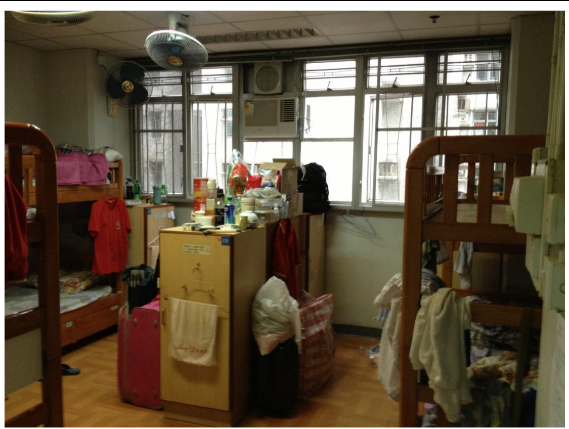
參訪救世軍怡安宿舍