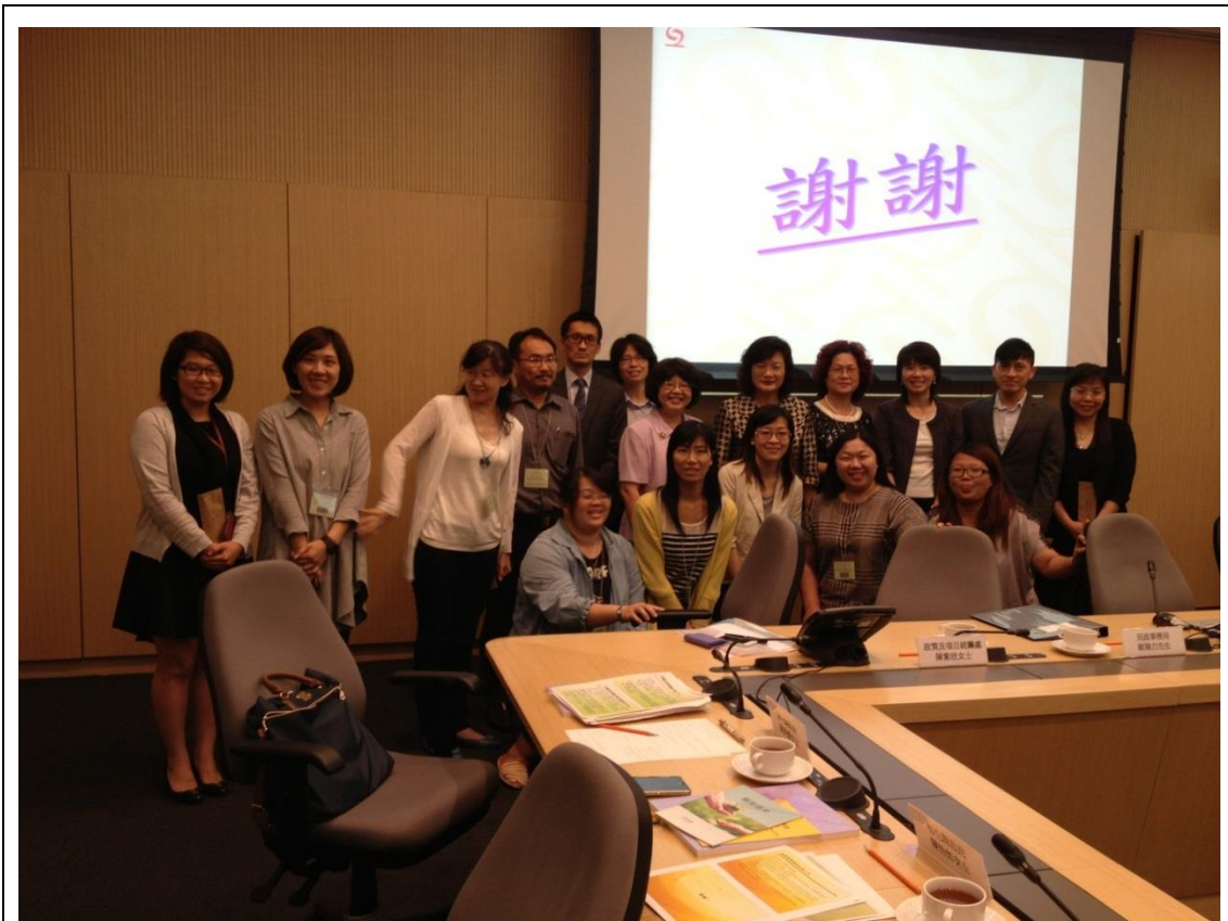
參訪香港特別行政區政府社會福利署及扶貧委員會