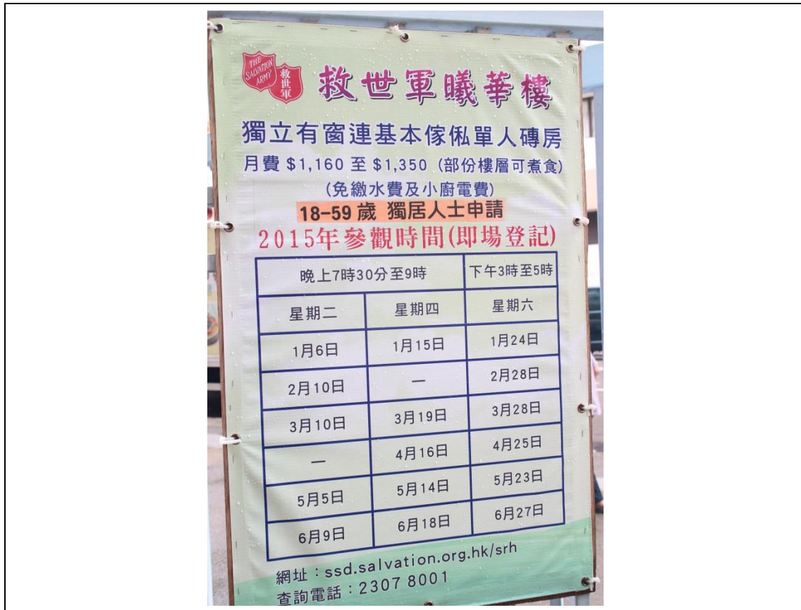
救世軍曦華樓公告資訊