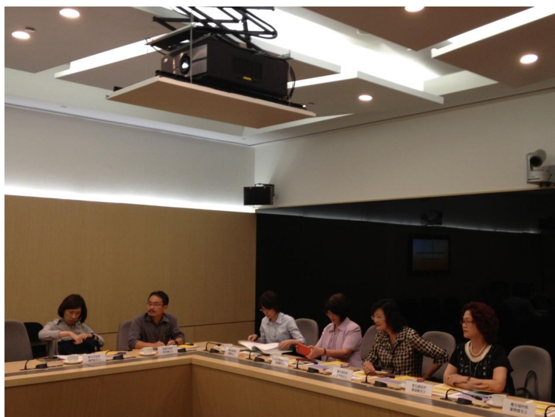
參訪香港特別行政區政府社會福利署及扶貧委員會