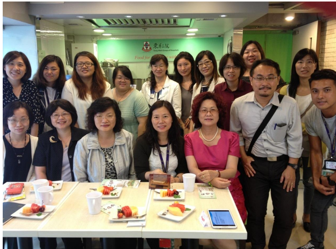
參訪東華三院善膳軒