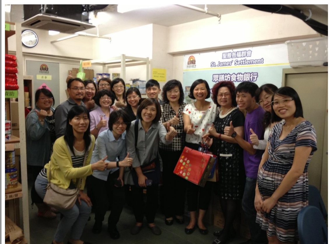
參訪聖雅各福群會西安中心