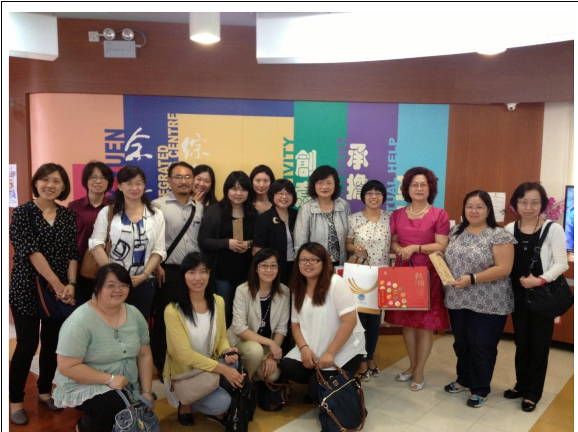
參訪東華三院余墨緣綜合服務中心