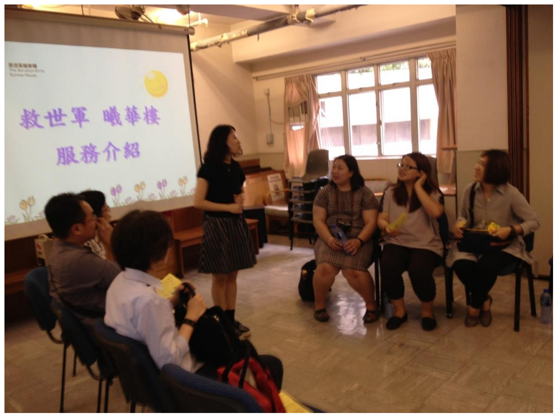
參訪救世軍曦華樓