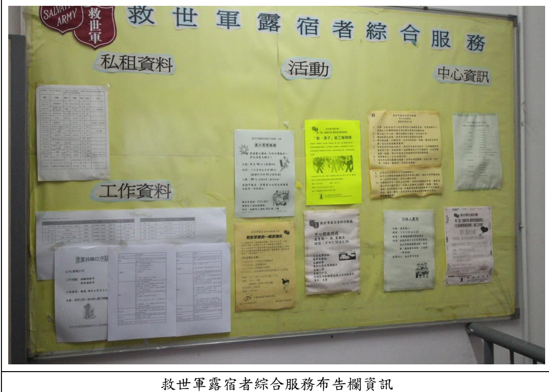
救世軍露宿者綜合服務布告欄資訊