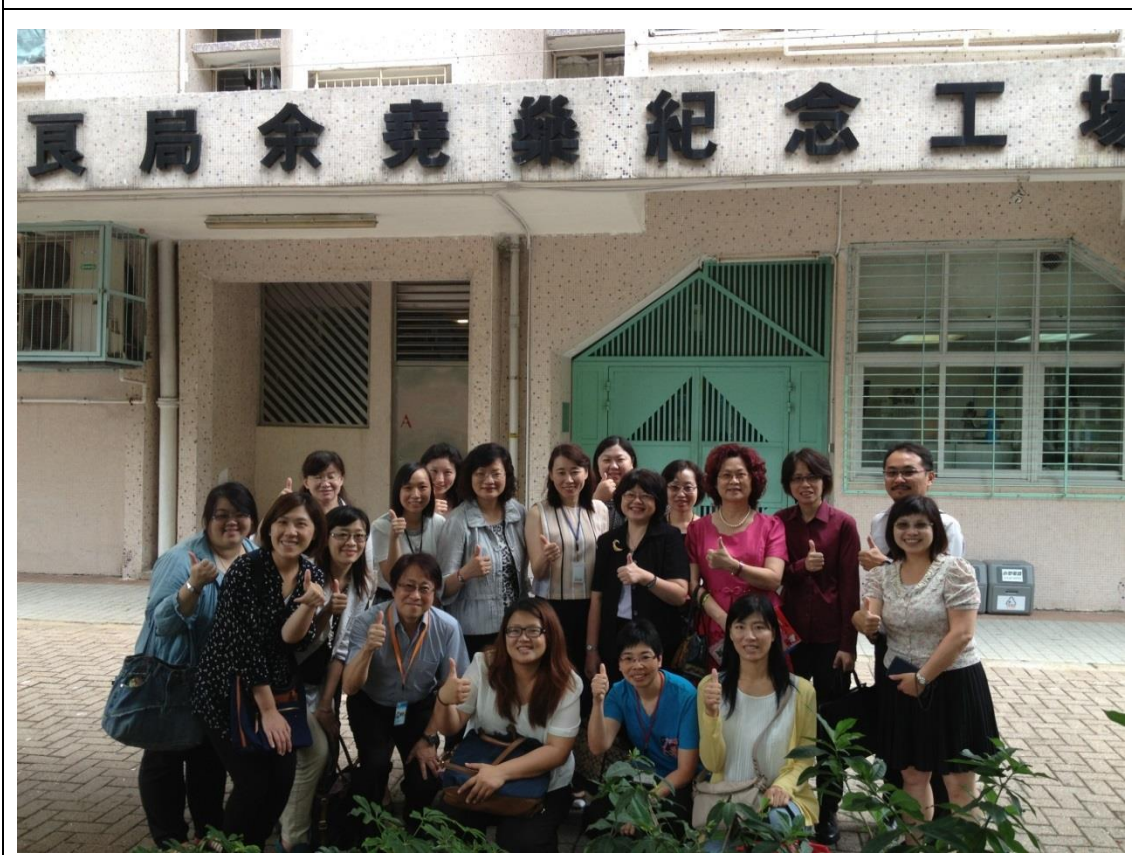
參訪保良局余堯樂紀念工場