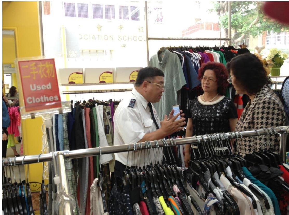
參訪救世軍油麻地家品店