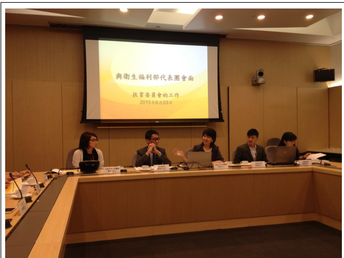
參訪香港特別行政區政府社會福利署及扶貧委員會