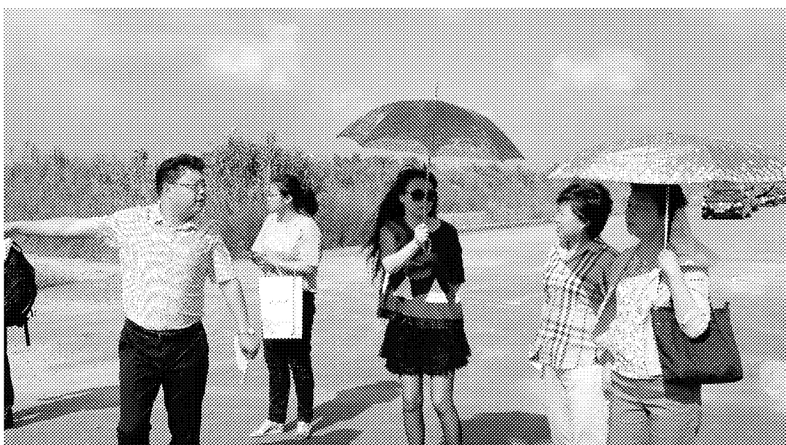
2016 臺灣江蘇燈會交流-後方小徑為連結西津灣兩岸口橋梁之大嘴魚島入口處