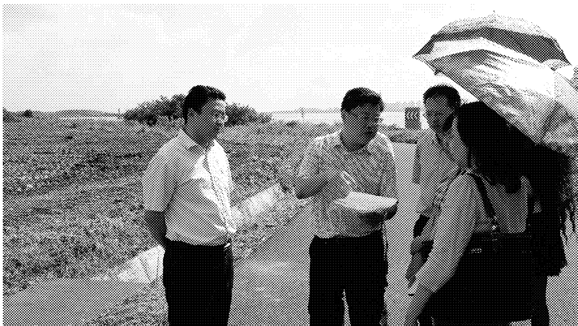
2016 臺灣江蘇燈會交流-臺灣燈區原預定展區現況