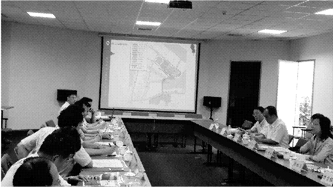
雙方就兩岸燈會交流相關議題進行討論及意見交換-討論展場變更事宜