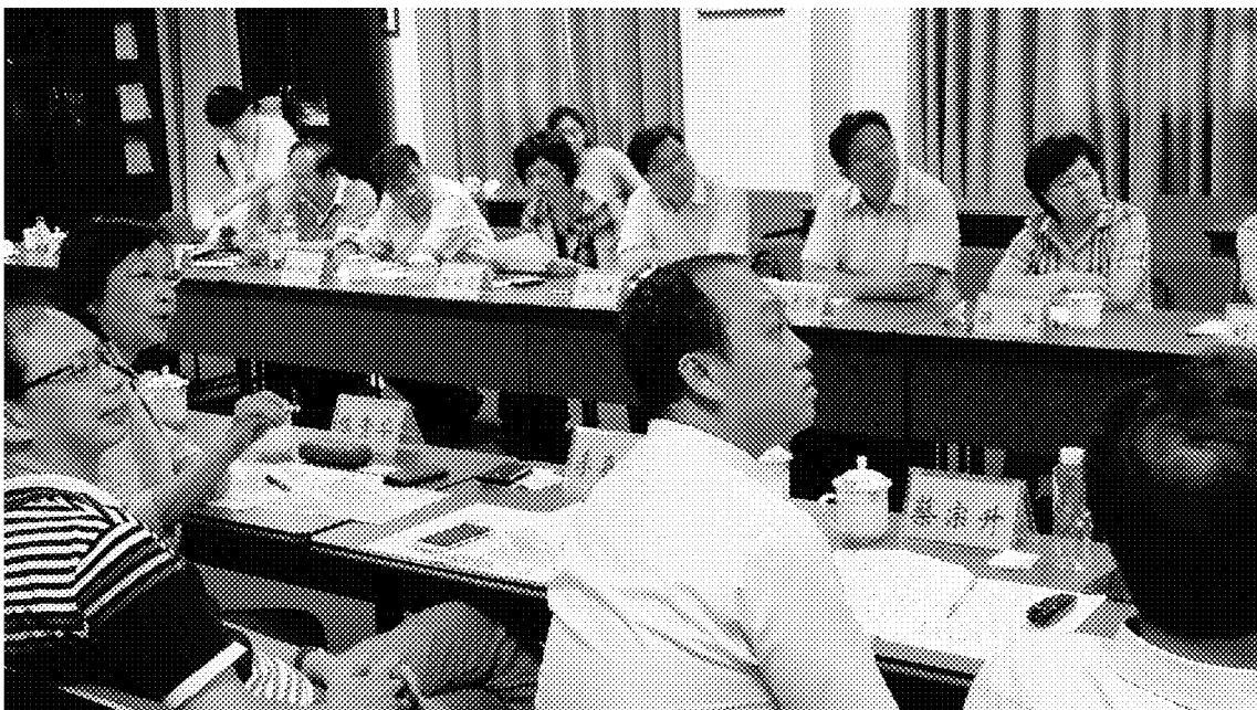
雙方就兩岸燈會交流相關議題進行討論及意見交換