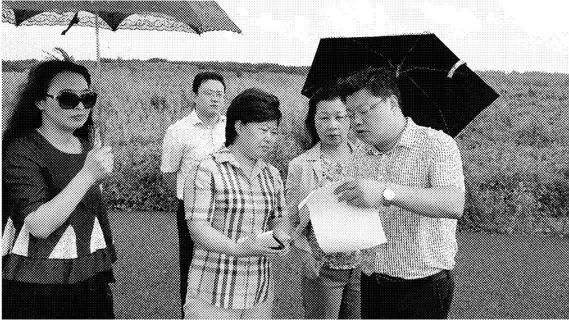
2016 臺灣江蘇燈會交流-後方為預計之臺灣燈區現況