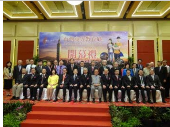
馬來西亞臺灣高等教育展開幕禮