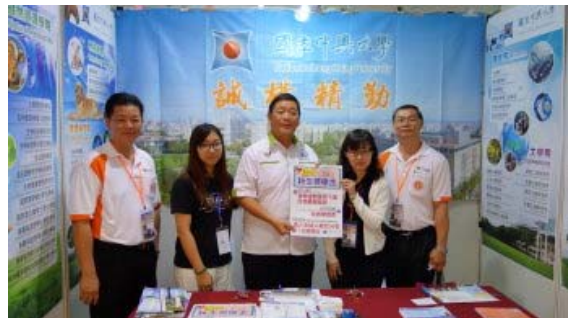
砂拉越美里市長及留臺同學會蔡主席、蕭主席到攤位了解本校參展情形