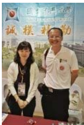
古晉留臺同學會吳副主席到攤位拜訪