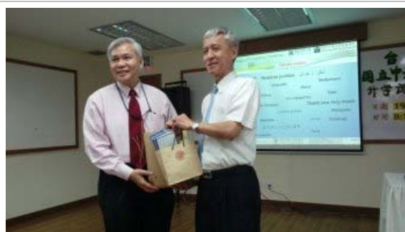
吳教務長與循人中學曾校長互贈紀念品