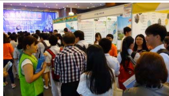
麻坡場次參觀人潮