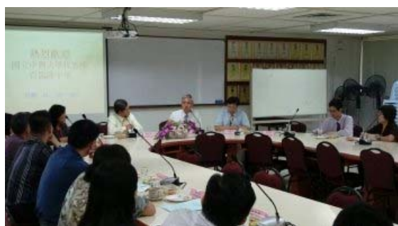
吳教務長、周院長、興北校友會幹部與吉隆坡中華獨中謝校長及行政團隊對談交流