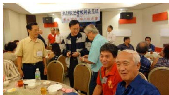
校友聯誼餐會氣氛熱絡