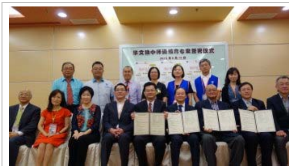
本校與董總完成簽訂獨中師資培育計畫協議書後，所有觀禮貴賓合影