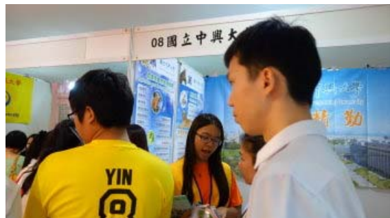
美里展場學生索取資料