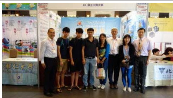
峇株巴轄鄭友德校友及家人到攤位參觀