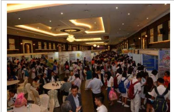
麻坡場次參觀人潮