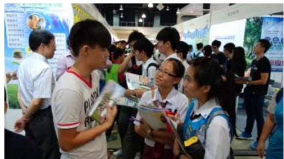
攤位展出人員解說情形