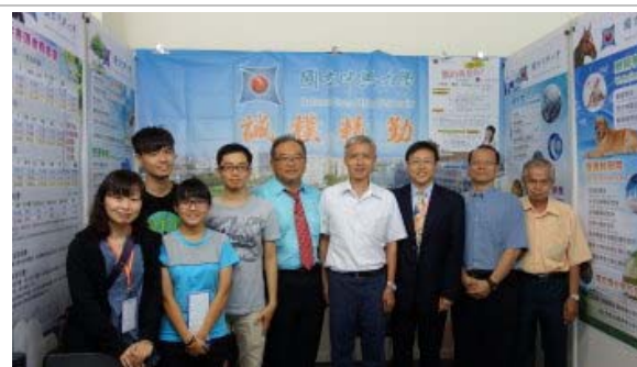
吉隆坡場次展出結束前，所以參展人員一起合影