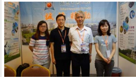
麻坡場次攤位佈置完成，參展人員先一起合影