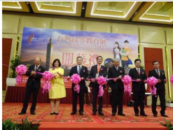
馬來西亞臺灣高等教育展開幕禮