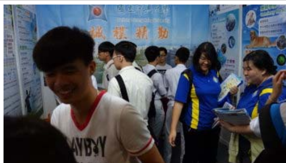
攤位內外都是參觀的學生