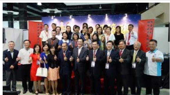
陳嘉庚杯統考成績優秀獎頒獎典禮後，所有觀禮貴賓各得獎學校代表合影