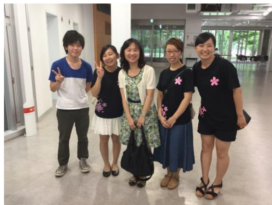
留臺的日本學生與本校教師