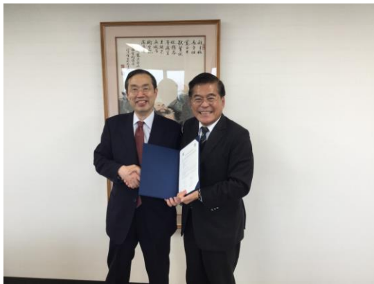
廣島修道大學簽約儀式完成