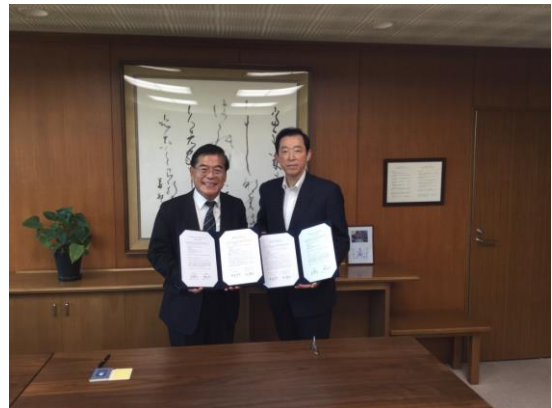
國立大阪教育大學簽約儀式-2