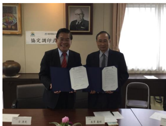
與姬路獨協大學簽約儀式完成