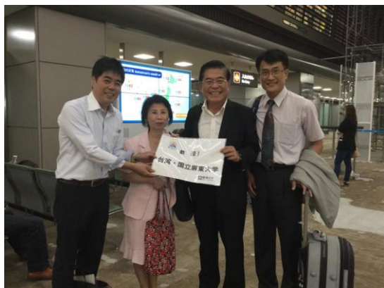
麗澤大學成田機場接機