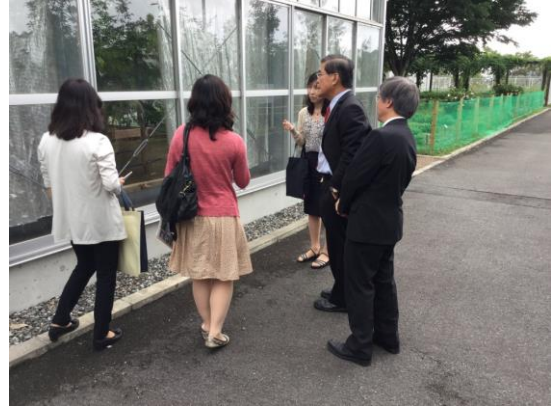
校園藥學植物介紹