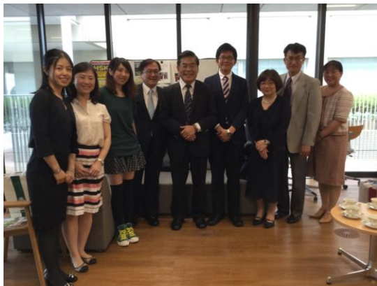
與本校交換生在修道大學國際處合影