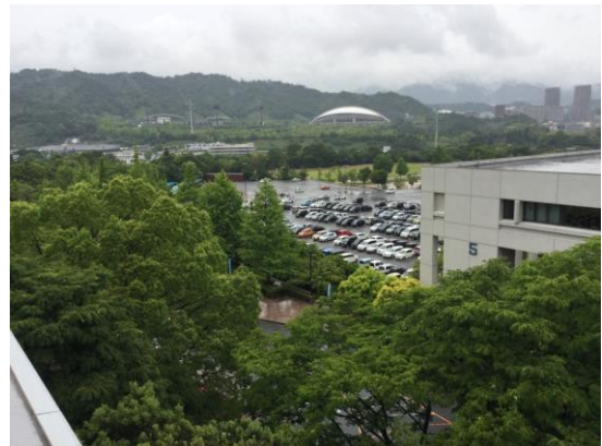
廣島大學校園一隅（前方白頂為廣島亞運會場）