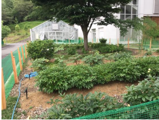
校園藥學植物一隅