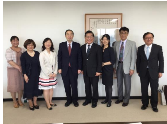
與廣島修道大學簽約儀式後之合影