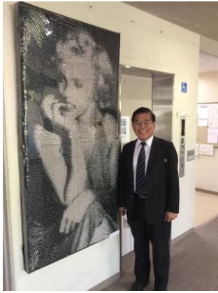
參觀學校的學生藝術作品