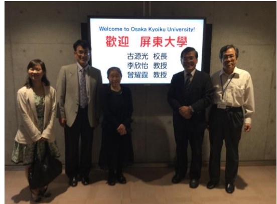
國立大阪教育大學歡迎看板