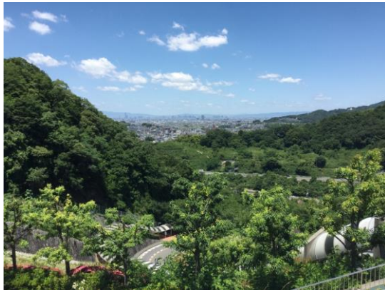
國立大阪教育大學之登山電扶梯與周圍風景