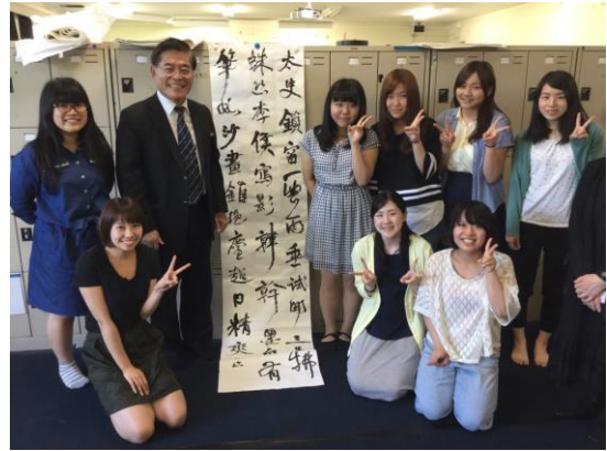
與學習書法的大阪教育大學學生合影