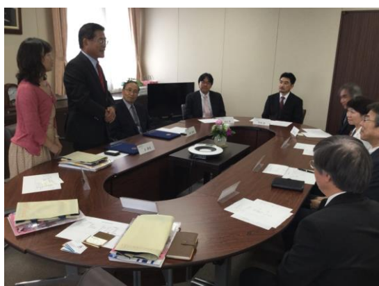
與姬路獨協大學雙方互相介紹認識