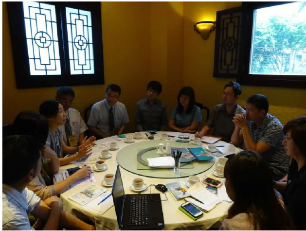
9月30日向中爪哇留臺同學會說明僑生政策