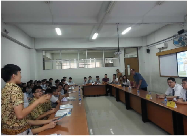
10月1日崇文中學學生提問來臺升學問題