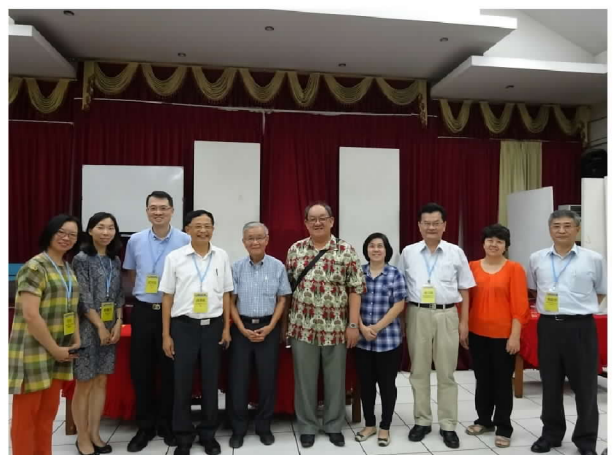
9月27日與西爪哇留臺同學會會長及幹部合影