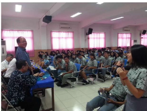
10月1日上午在 WR.Supratman 學校辦理宣導說明會