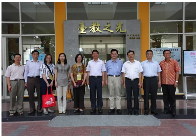
與泗水臺灣學校人員合影