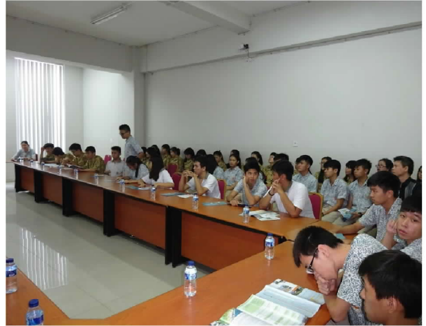
10月1日上午在崇文中學辦理招生宣導說明會