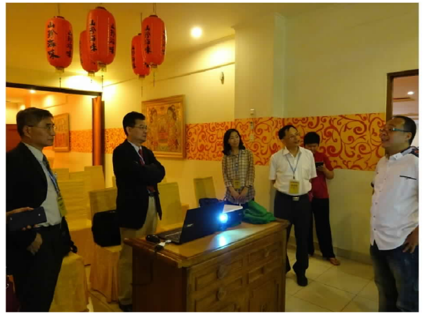
峇厘島台商詢問僑生回國升學問題