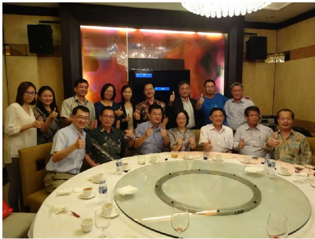
9月28日晚間與雅加達臺灣工商聯誼會座談