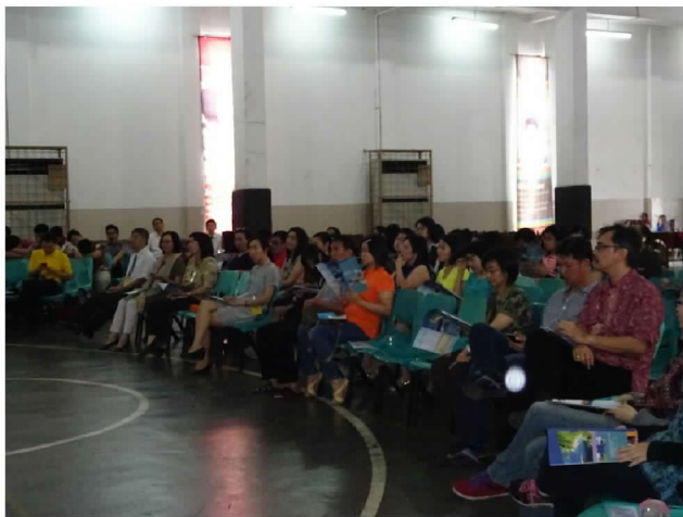
9月30日在三寶瓏三一基督學校辦理招生宣導說明會