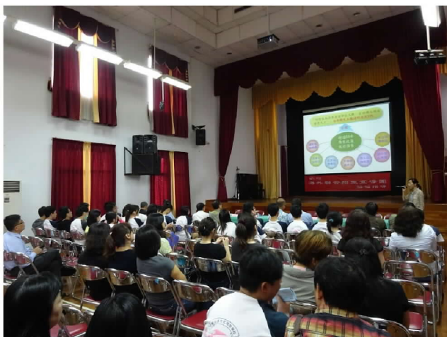
在雅加達臺灣學校介紹僑生政策及在學輔導措施