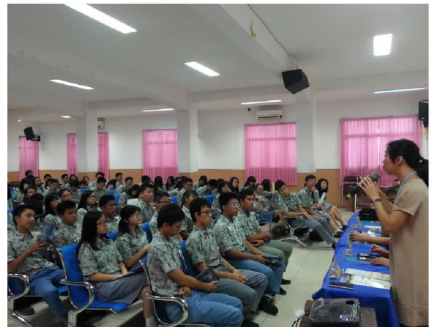
在 WR.Supratman 學校介紹僑生在學輔導措施