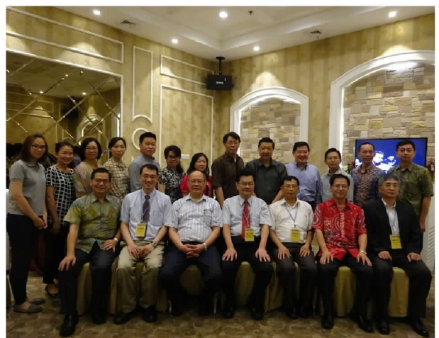
9月29日中午與雅加達留臺校友會座談