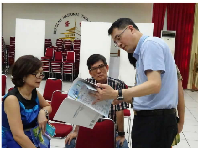
9月27日在萬隆說明會上回答家長提問