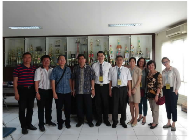
10月2日下午拜會蘇東牧中學