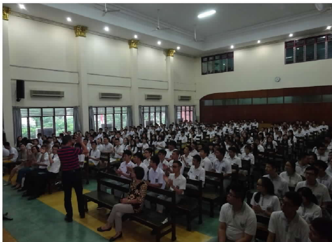
10月2日下午在衛理三校辦理招生宣導說明會