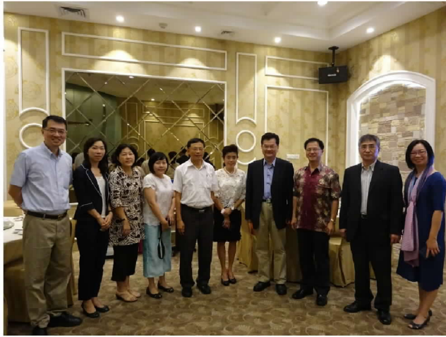
9月28日中午與雅加達留臺校友聯誼會座談