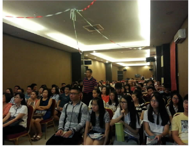
10月2日晚間在喜來登飯店辦理說明會