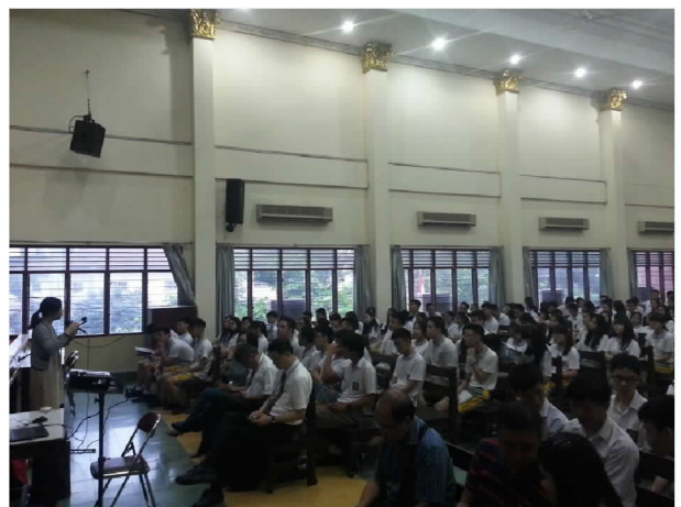
在衛理三校介紹僑生政策及在學輔導措施