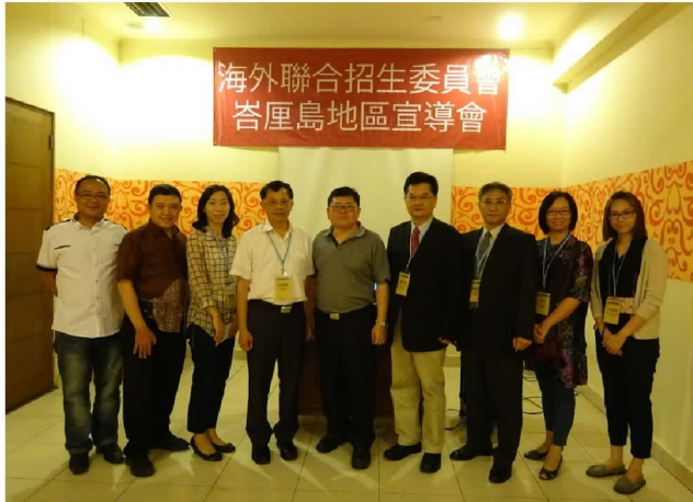
9月25日在峇厘島辦理招生宣導說明會