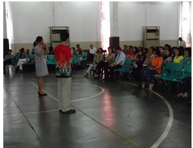
三一基督學校介紹僑生政策及在學輔導措施