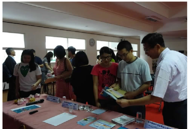
9月26日在泗水臺灣學校辦理招生宣導說明會