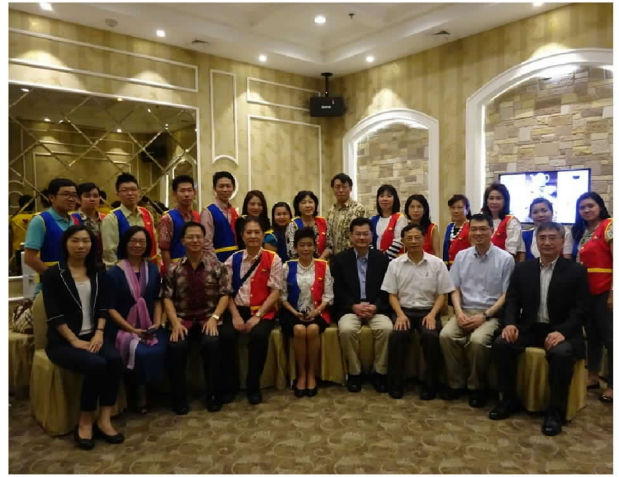
9月28日中午與雅加達留臺校友聯誼會座談