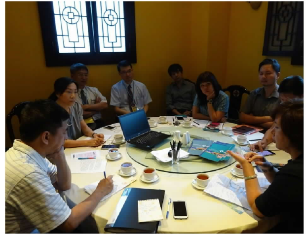
9月30日上午與中爪哇留臺同學會座談