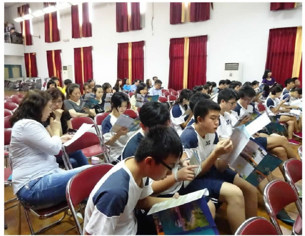
9月29日在雅加達臺灣學校辦理招生宣導說明會