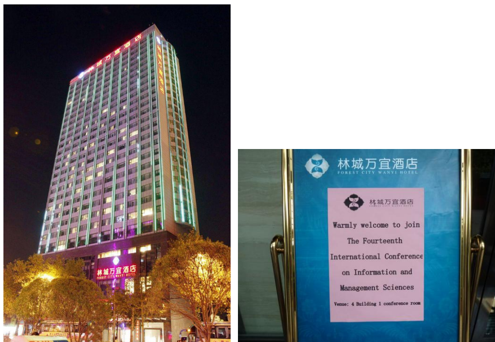
圖 1 貴陽市研討會舉辦地點：林城万宜酒店

本人於八月一日至十日出國期間出國前往大陸貴州省貴陽市，入住研討會舉辦地點林城万宜酒店，於 8/4~8/6 日期間出席 IMS2015 國際研討會，並於 8/7~8/9 日參與研討會舉辦的參訪行程。今年為期三天的研討會在貴州省貴陽市林城万宜酒店(圖 1)舉辦，並於會後安排三日的參訪行程。本人於 8/1 日提前抵達貴陽市，順道參訪花溪生態公園整治成果、花溪大學城，會後並參加研討會(8/7~8/9 日)安排的參訪行程，拜訪黃果樹國家公園、西江苗寨與南江大峽谷風景區。