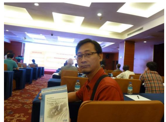
(d) 研討會議程 3