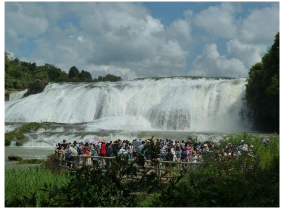
(b) 參訪行程 2