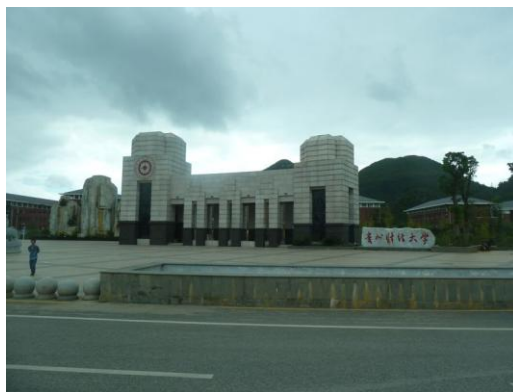
(e) 參訪行程 5