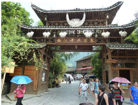
(c) 參訪行程 1