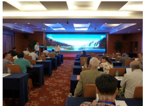
(b) 研討會議程 1