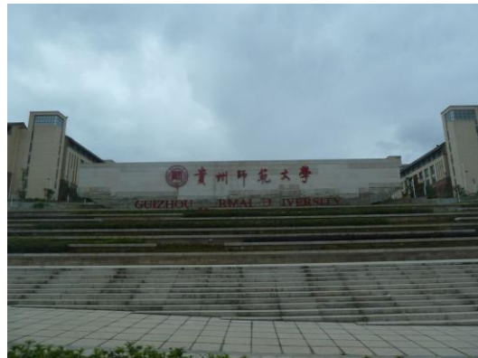
(f) 參訪行程 6