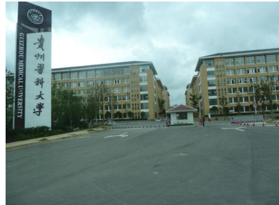
(d) 參訪行程 4