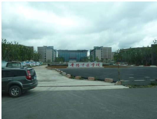
(c) 參訪行程 3