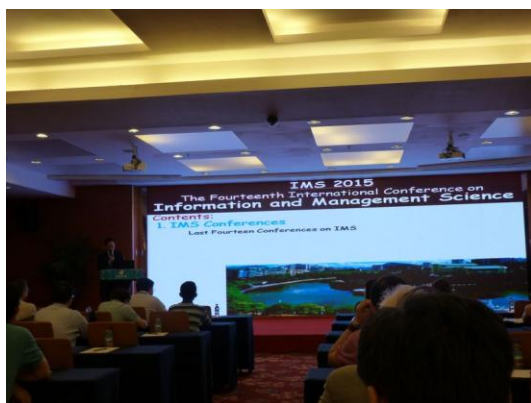
(e) 研討會議程 4