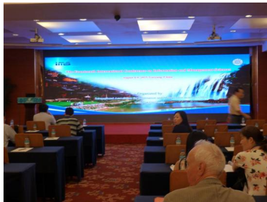
(c) 研討會議程 2