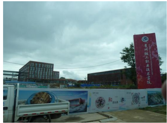
(b) 參訪行程 2