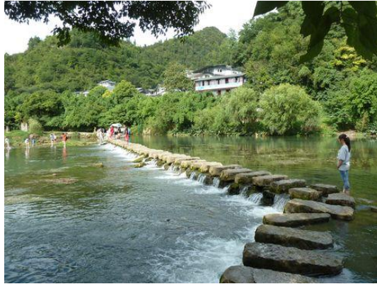
(a) 參訪行程 1