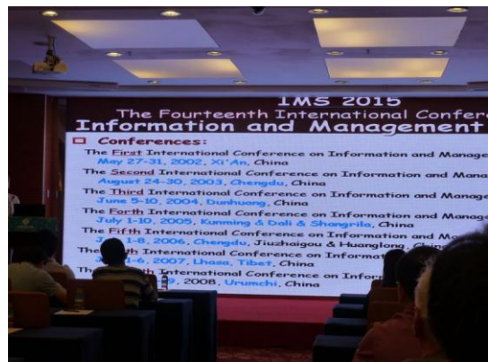
(f) 研討會議程 5