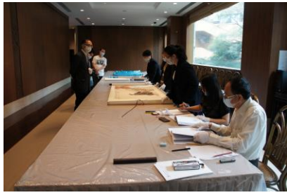
圖 1 借展文物點檢 一