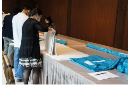
圖 2 借展文物點檢 二