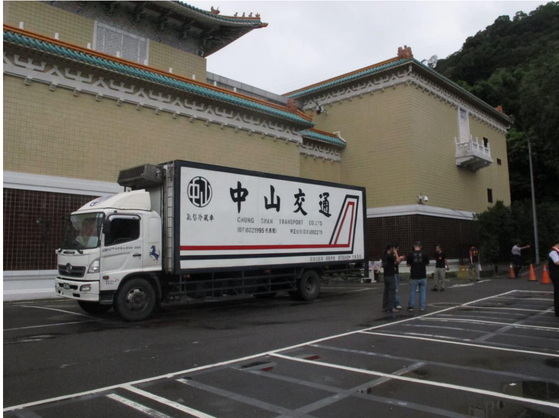
圖 13 廣州藝術博物院借展文物順利抵院