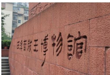
圖 5 參觀南越王墓博物館