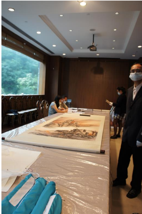
圖 3 借展文物點檢 三