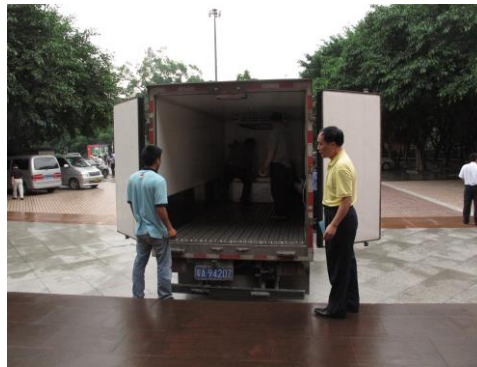
圖 10 運輸包裝公司人員協助放置文物運送箱