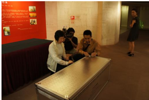
圖 9 貼封條