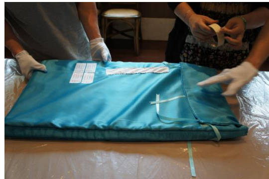
圖 4 借展文物點檢 四