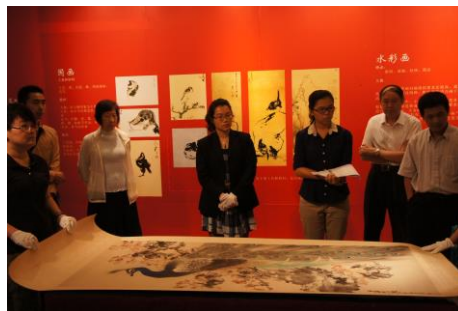
圖 6 借展文物抽點與裝箱一