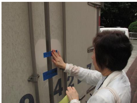
圖 11 運輸文物車輛貼上封條