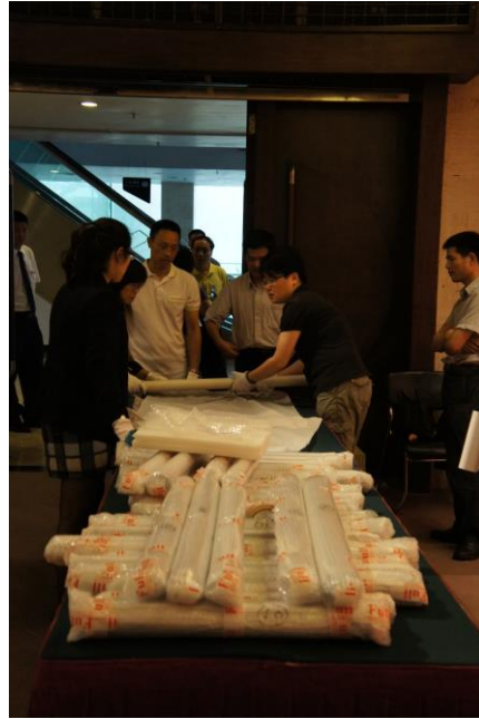
圖 8 進行裝箱作業