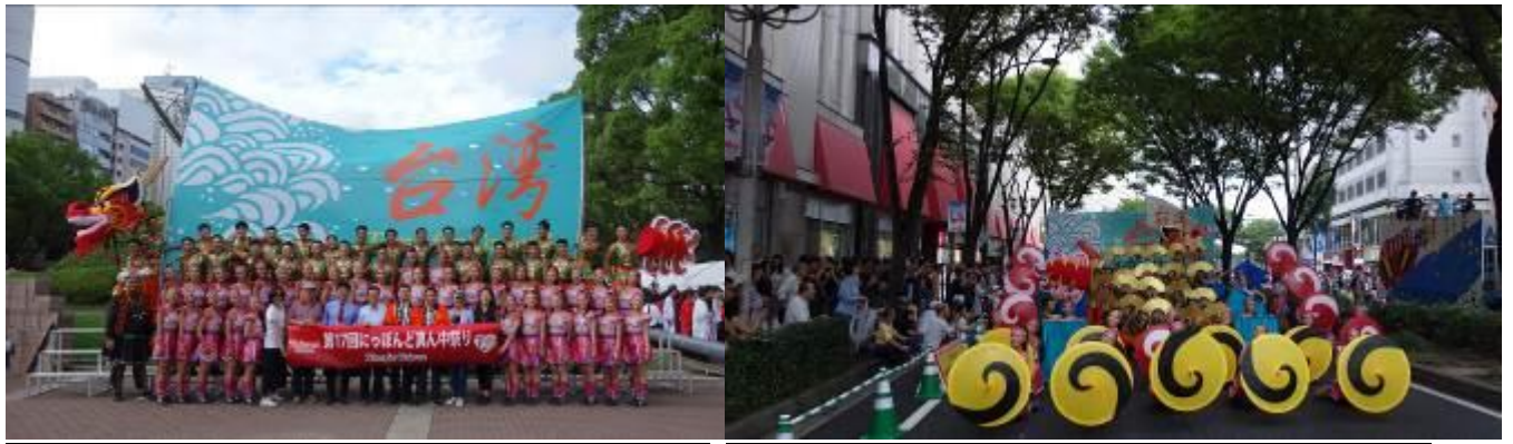
臺灣隊伍踩街表演及大合照