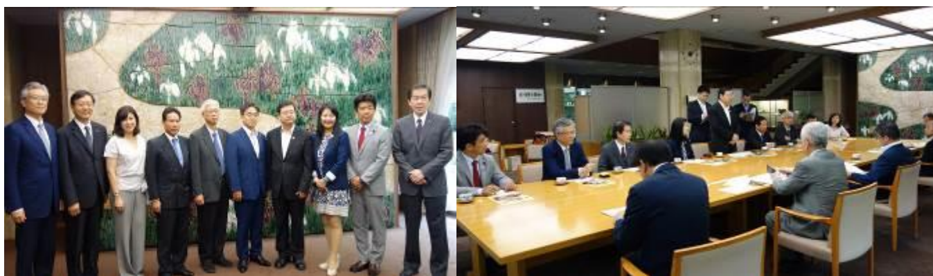
拜會愛知縣大村知事(右 5)、右 4 為本局張副局長