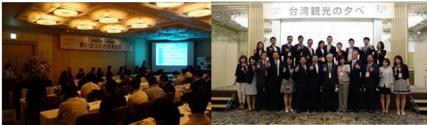
臺灣觀光說明會暨懇親會 in 名古屋推廣情形