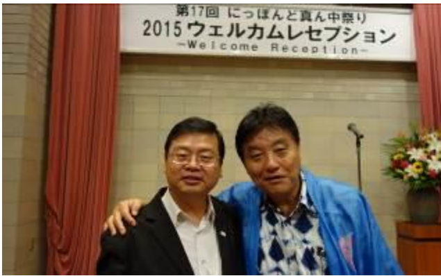
與名古屋市長(右 1)合影