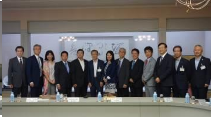
拜會名古屋市新開副市長(右 7)、左 5 為本局張副局長、右 3 為愛知縣寺西議員