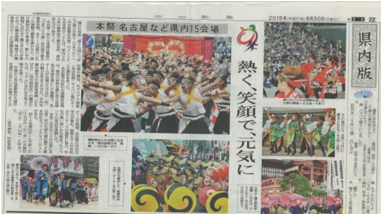
中圖下照片為樹德科技大學隊伍