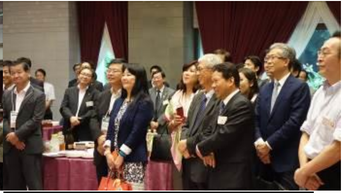
主辦單位為各參加隊伍舉辦的歡迎酒會