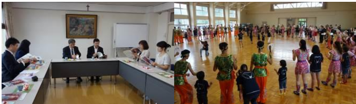
拜訪兒童家扶中心進行慈善義演，並與小朋友們同樂