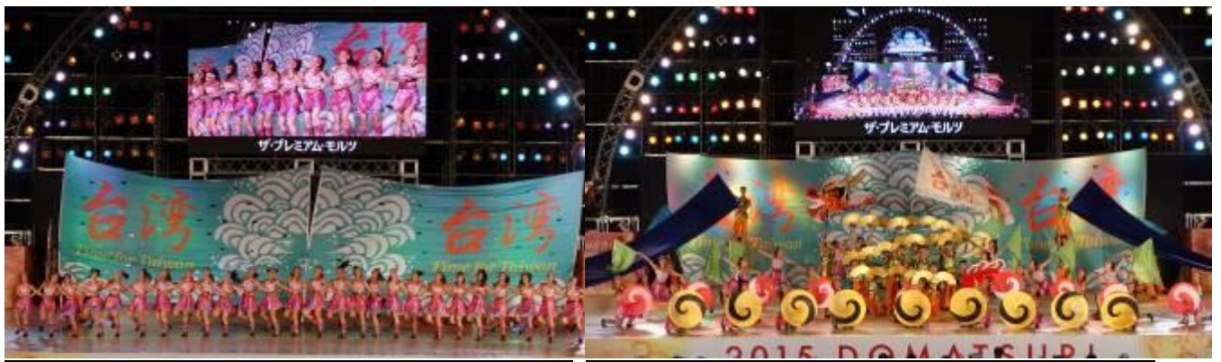
臺灣隊伍以客隊身分受邀登上最終決賽主舞台表演