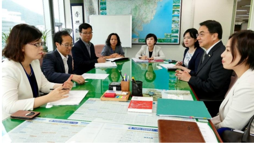
與釜山市政府文化觀光局共商合作開發臺韓兩地南部旅遊市場