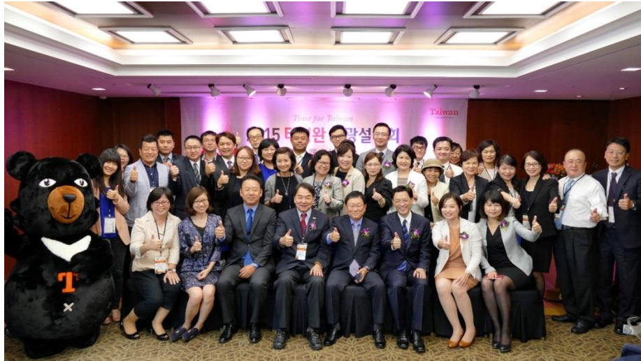
釜山場推廣會圓滿完成，臺灣觀光推廣團合影留念