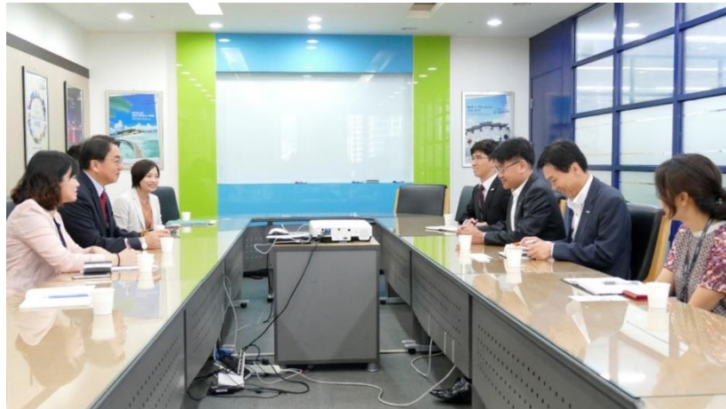
拜會釜山航空，共商提升高雄－釜山航線承載率及開闢臺東－釜山航線事宜