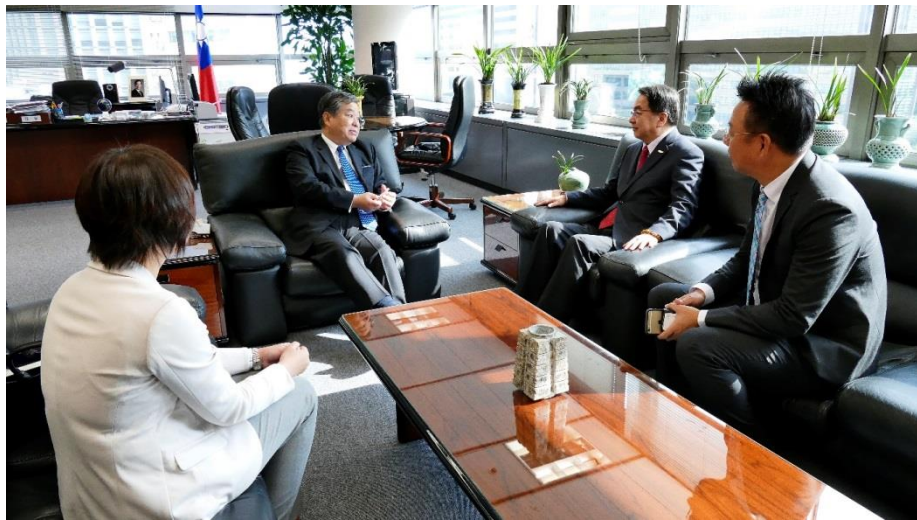
拜會駐韓國臺北代表部石定大使