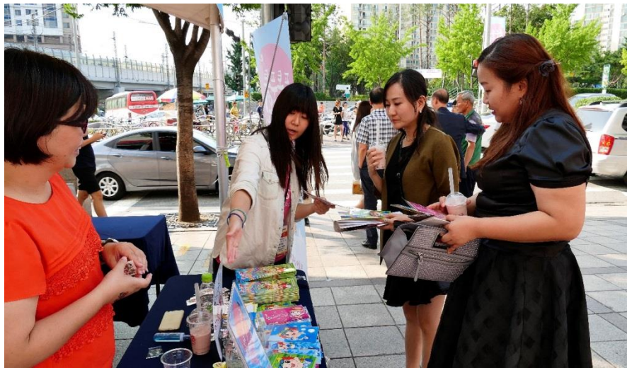
roadshow 現場各攤位提供詳盡之文宣與諮詢服務，並提供小紀念品供韓國民眾索取