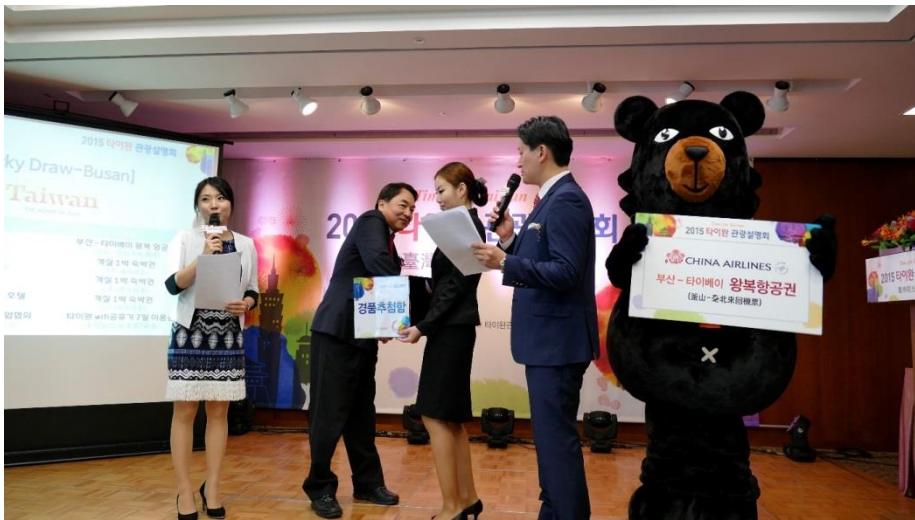
推廣會壓軸進行抽獎活動，將現場氣氛炒熱到最高點