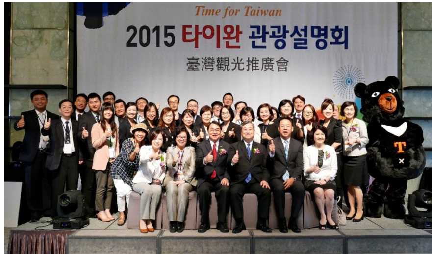
首爾場推廣會圓滿完成，臺灣觀光推廣團合影留念