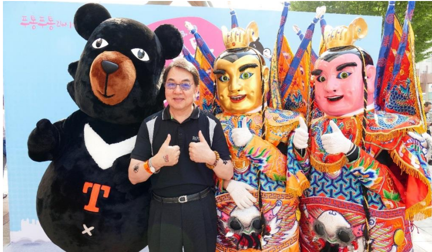
與喔熊組長及電音三太子共同宣傳推廣臺灣觀光