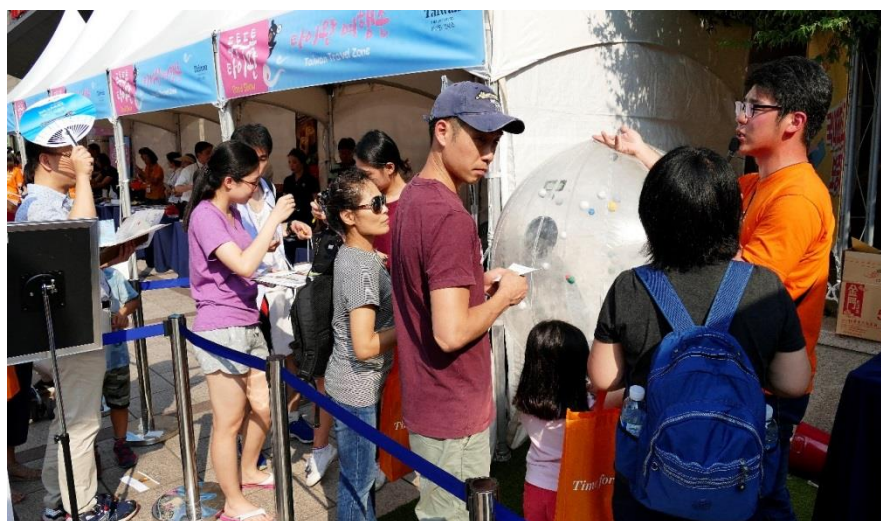
roadshow 攤位提供珍珠奶茶、小伴手禮，韓國民眾熱情參與遊戲體驗