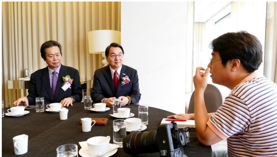
謝謂君局長接受韓國當地媒體採訪