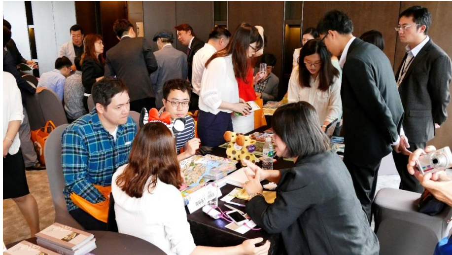
旅遊交易會現場臺韓兩地業者交流熱絡