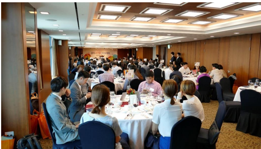
臺灣觀光推廣會第2階段餐敘交流現場，韓方業者出席情形踴躍