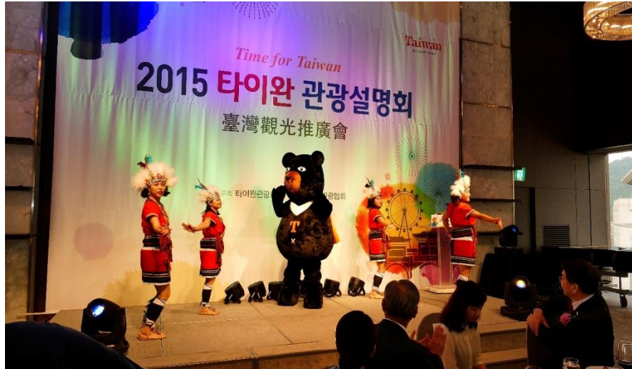
喔熊組長賣萌 show 臺灣原住民舞蹈