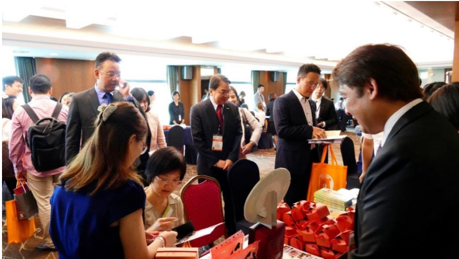
謝謂君局長親臨釜山場臺灣觀光推廣會-旅遊交易會現場瞭解業者交流情形