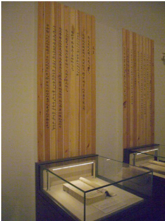
國博以竹簡形式展版介紹陳列的諸子典籍