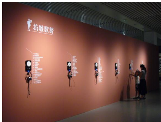
典籍館「不朽的長城」特展一隅：抗戰歌聲