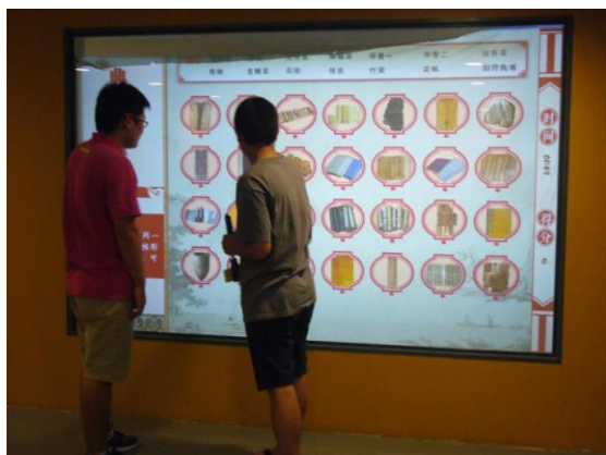
「中國古代典籍簡史」展互動遊戲