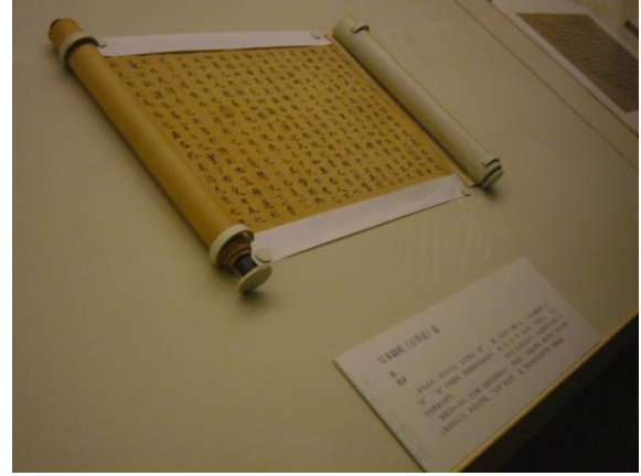
國博唐寫經展示：以特製圓弧型製品護撐卷軸