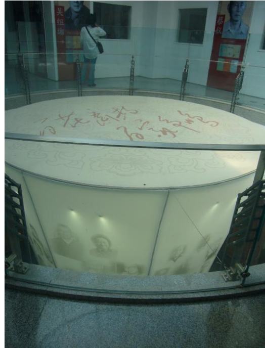
現文館內天燈裝置藝術：天燈上有作家群像