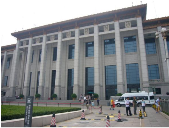
中國國家博物館外館