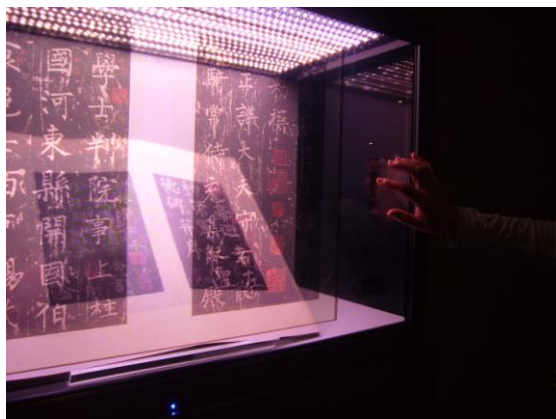
典籍館「金石拓片」展中多層次展櫃設計