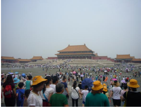
人山人海的故宮博物院