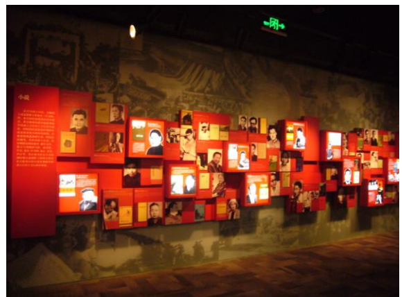
現文館「中國現當代文學展」一隅：作家群像