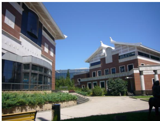
現文館館舍共 3 棟，棟棟不相連