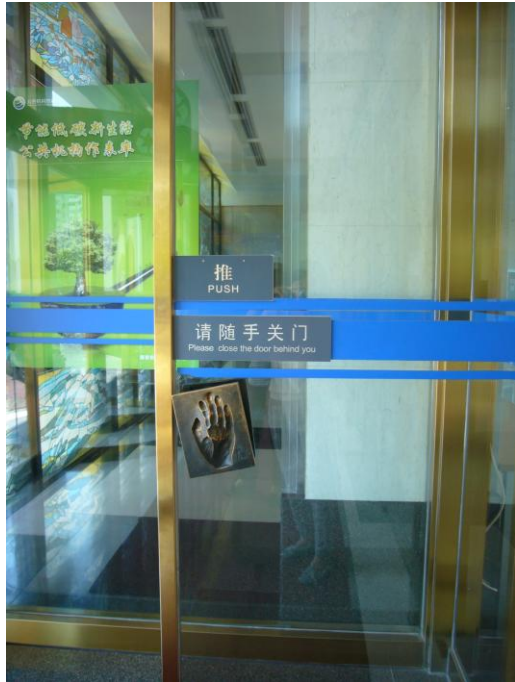
現文館館舍各大門出入口門把：巴金手模