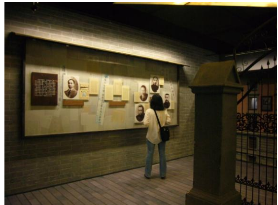
現文館「中國現當代文學展」一隅：五四運動起源地之北大大門