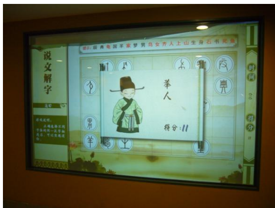
典籍館「中國古代典籍簡史」展互動遊戲