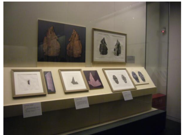
國圖甲骨拓片展示