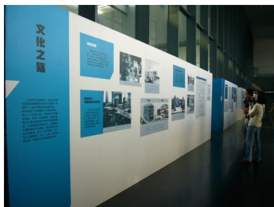
北京國圖館內特展「抗戰中的國圖」