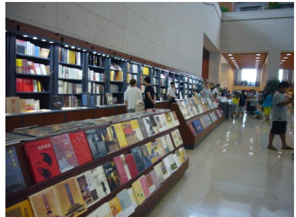
國博各大展廳外緣牆皆設為販賣部，販賣該館出版品為主，兼及相關文創商品