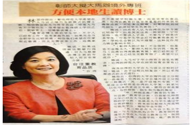
8/16 星洲日報刊登教育部林政務次長思伶提及未來本校擬在馬來西亞設立博士境外專班新聞。