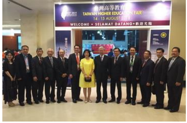
8/14 郭校長艷光（右四）與教育部林政務次長思伶（中）、僑務委員會陳委員長士魁（右六）、馬來西亞留臺校友會聯合總會李會長子松（左六）、我國駐馬來西亞臺北經濟文化辦事處程公使祥雲（左五）等與會貴賓於臺灣高等教育展【吉隆坡展場】入口處合影。