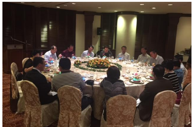
8/13 丹斯禮拿督斯里楊博士忠禮晚宴。