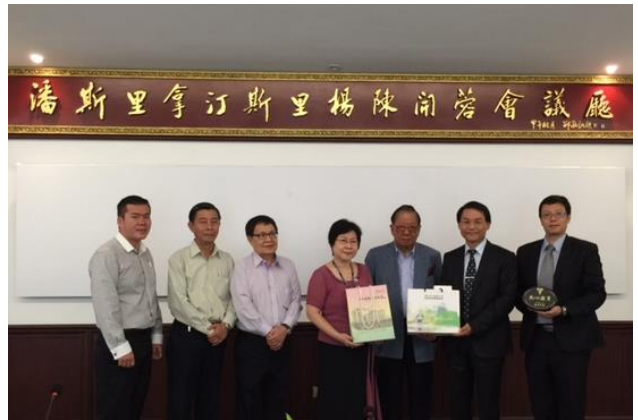
8/13 巴生興華中學參訪。