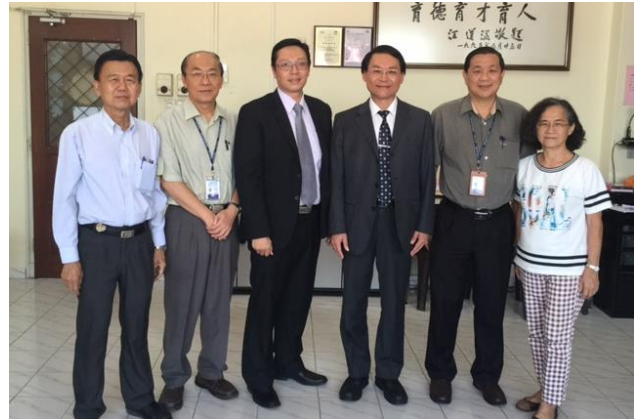
8/18 拜訪新山寬柔中學，與該師長合影。