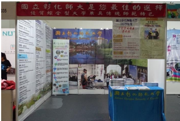
8/13【吉隆坡展場】布置完成。