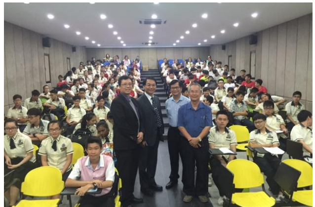
8/15 參訪波德申中學，郭校長與該校聽講的高二同學合影。