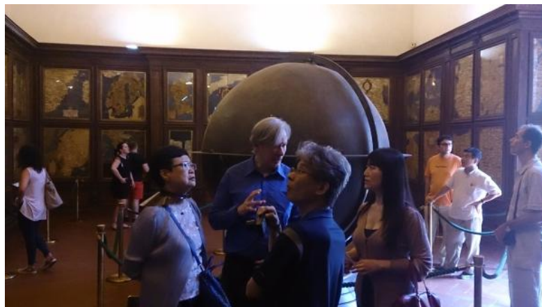
圖八：維奇歐宮博物館地圖展廳

更特別地，再往裏走，可以看到一間地圖室。本院南院以展覽亞洲藝術文物為重要目標，如此的定位，若能收藏一些亞洲地圖、對於了解亞洲各國(文化族群)間發展與交流頗有幫助，因此，本行在此廳觀察較久。本廳一進去，迎向面前的是位於全室中心直徑約 210 公分的巨型地球儀，四周有 53 個木製面板，繪製各地區地圖，例如：中國、日本、墨西哥、英國、義大利、希臘、蘇門答臘等。另外，本展間原始裝飾與現狀最大差別就在天花板已重新改裝，展間現狀外貌如圖八。原始天花板上裝飾著星象圖，想像中、當人們走入其間，應頗有宇宙主宰的感覺。從此世界地圖的收藏也可看出，佛羅倫斯在 17 世紀時已有處理世界資訊的卓越能力，甚至可譬喻成當今世界的大數據(Big data)中心。而在解說資料中，有兩件事特別值得一提：當時義大利人非常欣賞中國瓷器，公爵科西莫對製作潔白透亮的瓷器秘方也很有興趣，曾以蛋殼、貝殼及珍珠等材料，嘗試製作歐洲第一批自製瓷器。當然，在缺乏高嶺土類似材料情況下，實驗結果不是很成功；另件值得補充說明的事為大航海時代對世界地理知識之了解方式，繪製海洋範圍內的地圖知識大多由船隻航行過程中所得，繪製陸地範圍知識則須靠書籍等其他輔助資料來進行。其中，繪製中國地圖內地所需的地理資訊，即來自馬可波羅遊記的補充。