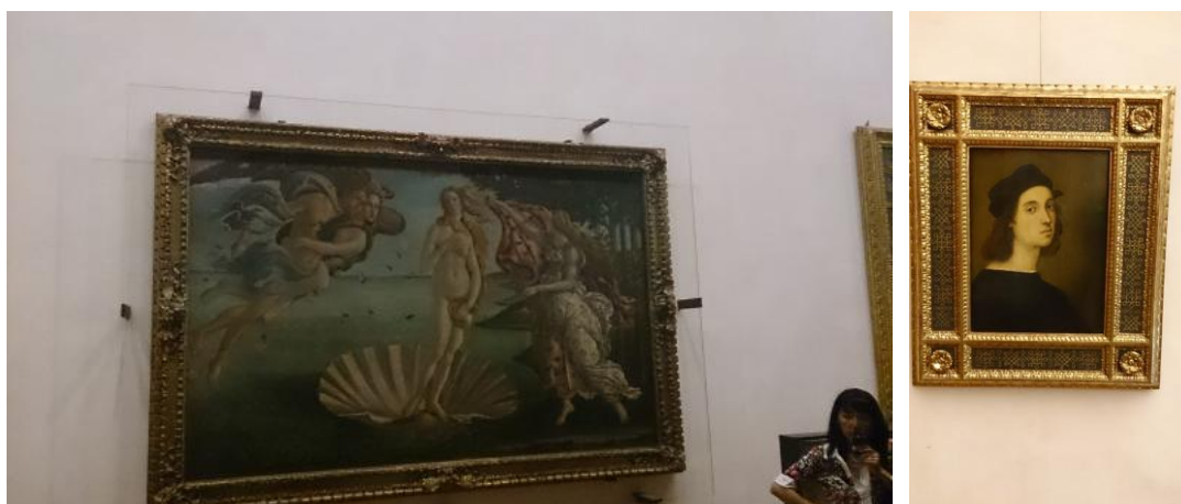
圖六：維納斯的誕生與拉菲爾的自畫像

烏菲茲美術館典藏了許多文藝復興時期重要藝術品，堪稱文藝復興之最。於西元 1560 年，由當時公爵科西莫(Cosimo)一世令建築師瓦薩里(Giorgio Vasari)建造辦公室，由於公爵科西莫的梅迪奇(Medici)家族長期贊助建築與藝術，公爵科西莫後來將收藏品安置於此館舍，於是館舍就轉變成了烏菲茲美術館。本館典藏許多文藝復興時期重要大師的作品，如米開朗基羅、達文西及拉菲爾等人的曠世巨作。其中大受觀眾歡迎的作品有維納斯的誕生(桑德羅·波提切利最著名的作品之一)、拉菲爾的自畫像等作品，見圖六。本行在當地友人導引下，我們延著 U 型動線，一步一步地了解探索文藝復興時期藝術的發展過程，並期待未來有深入合作機會。