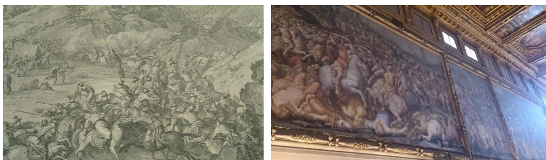
圖七：本院郎世寧得勝圖銅版畫與維奇歐宮博物館大型壁畫相似性比較

維奇歐宮位於領主廣場(Piazza della Signoria)旁，為約於 14 世紀由公爵科西莫(Cosimo)一世令建築師瓦薩里(Giorgio Vasari)所建造的市政廳。現在很大的面積當作博物館用途，門口外有大衛的雕像複製品，滿足觀眾拍照的慾望。建築內有非常大的會議廳，旁有巨大壁畫，與本院所典藏郎世寧得勝圖銅版畫，題材與形式的相關性頗高，見圖七。