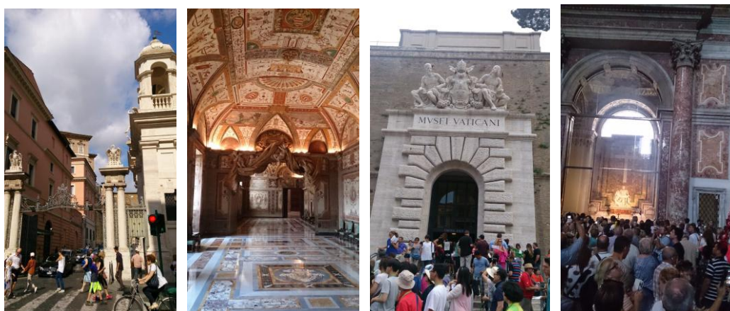
圖一：梵蒂岡博物館群與聖彼得大教堂

上半行程(6/23~6/25)以羅馬及梵蒂岡地區文化資產機構參訪為主。羅馬與梵蒂岡歷史依據史料彙整如下：羅馬城建立於西元前 753 年，起初是王國時代(西元前 573~510 年)；然後是共和時期(西元前 510~30 年)；再來是帝國時期(西元前 30~後 476 年)；中世紀時、天主教會建立教宗獨立國；自 1870 年義大利軍隊攻占羅馬，羅馬成為義大利首都。梵蒂岡面積僅 0.44 平方公里，由教宗擔任元首，於 1929 年起稱梵蒂岡城國。首先到訪的第一站是梵蒂岡博物館群(The Vatican Museums)，由通曉建築歷史及教廷收藏的神父們帶我們了解梵蒂岡的歷史與藝術面向，其中最令人印象深刻的是關於歷任教宗物品收藏，有權杖、衣飾、聖杯及各國信徒奉獻的珍貴禮物等等。過程大多不容許攝影，故僅於此分享少數公共未管制處影像如圖一。到了夜晚，羅馬城有了另外一番景色，其中運用了投影技術、讓觀眾實地原建築了解古蹟損壞前的風華，如圖二。