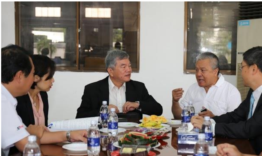
訪視百岳國際股份有限公司