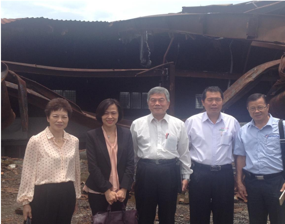
訪視鋒明（越南）國際有限公司