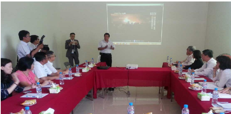
訪視鋒明（越南）國際有限公司—大登工業區新廠房簡報