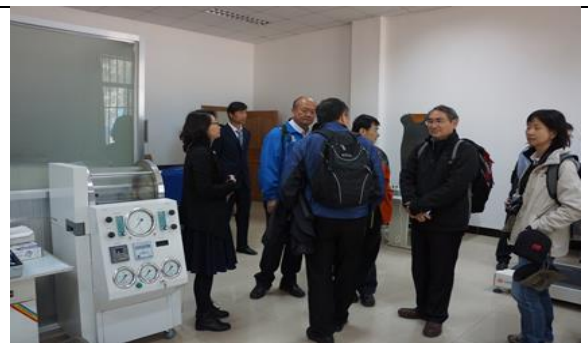
參訪青海省體育科學研究所