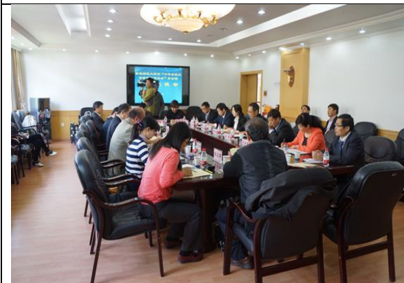
參訪青海師範大學及座談