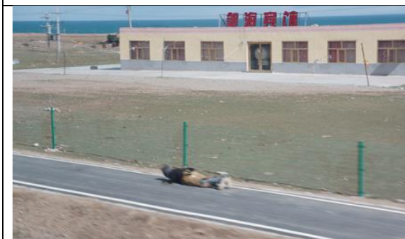
往青海湖路上見有信徒徒步膜拜，房屋後方即青海湖