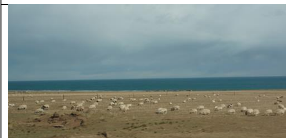
考察環青海湖自行車賽途中多見有放牧羊群