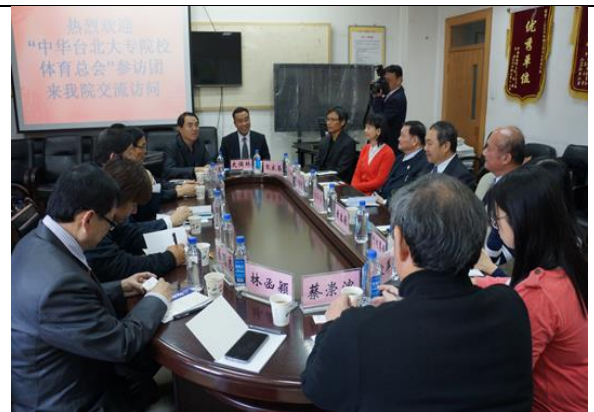
與青海師範大學體育學院座談