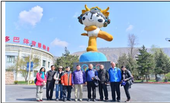
參訪青海多巴國家高原體育訓練基地