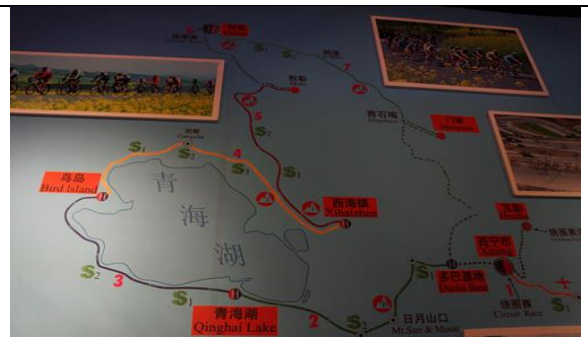
環青海湖公路自行車賽路線