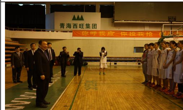
參觀青海師範大學女籃隊練習與分組比賽