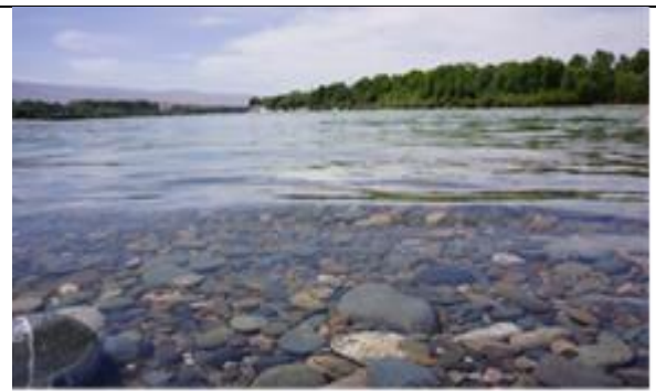
貴德縣境內的黃河水質清澈