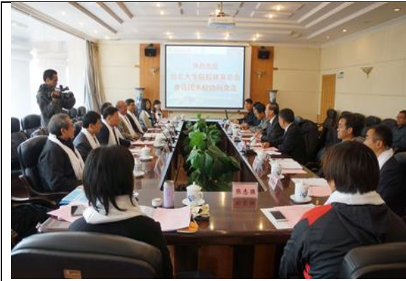
與青海民族大學座談