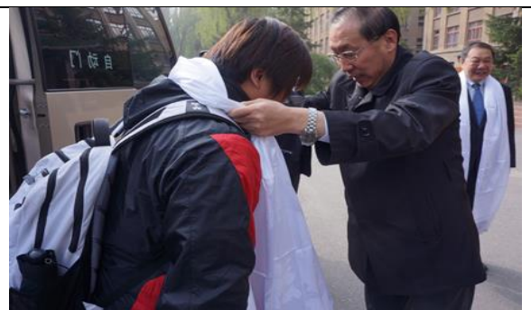
參訪青海民族大學，谷副校長為團員獻哈達