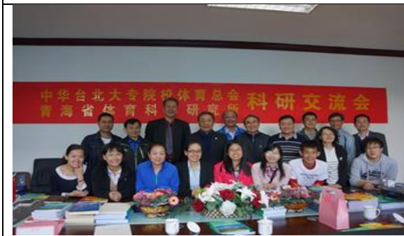
與青海省體科所人員座談後合影