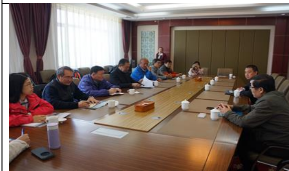
與多巴基地人員座談