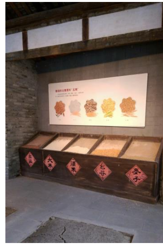
圖三十三 內部展示廳的展示手法