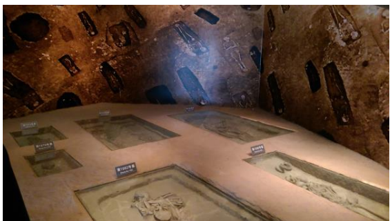
圖四十八 內部展示廳的展示手法