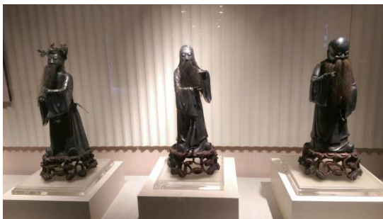
圖三十四 內部展示廳的展示手法