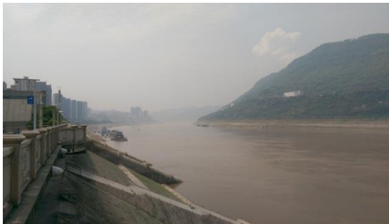
圖一 位於長江畔的博物館

涪陵所在地為長江沿岸，白鶴梁自古以來有許多文人墨士在江邊留下題字，在江中石頭刻下字跡，在水流減少時便會浮出水面，成為當地的勝景。在長江大壩興建時，引起許多重視，如何保留這些珍貴的文化資產，當時其中有一提議是籌建一座水下考古博物館，讓後代子孫可以見證千年來的文字痕跡。因此，在水利工程、土木工程與文化資產三個專業的協力下，促成了這座白鶴梁水下考古博物館的完工。