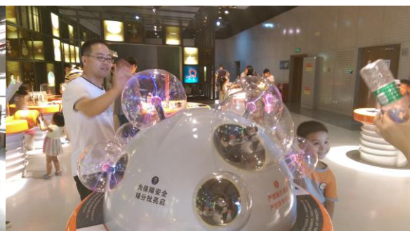
圖十五 互動多媒體的展示手法