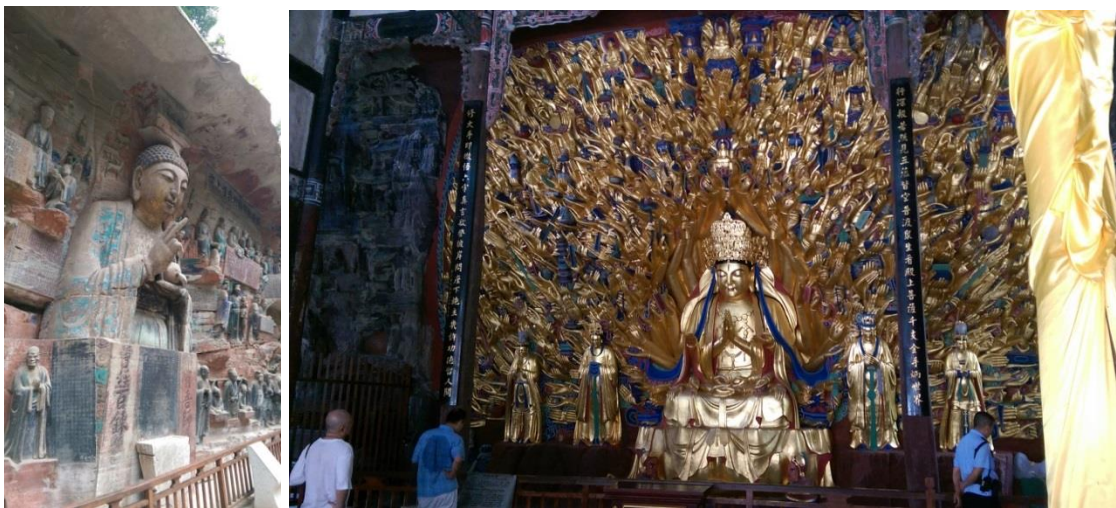
圖五、六 在山洞中雕刻的佛像，保存完整；千手觀音可以看出修復的新跡。