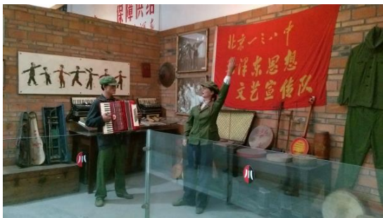
圖四十 紅色年代生活用品陳列館展廳