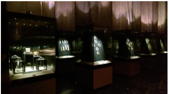
圖四十九 內部展示廳的展示手法