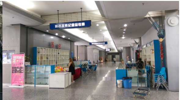
圖二十三 紀念品專售區