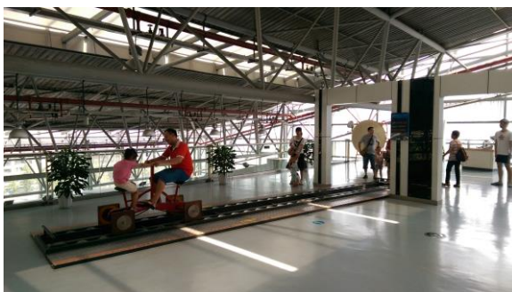
圖十四 科技館內部的展示廳