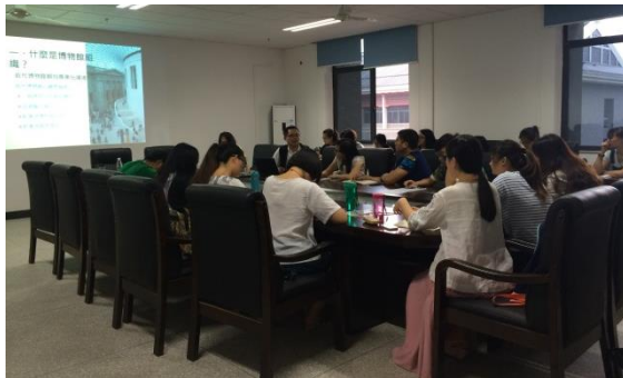
圖五十六 四川大學交流（江安校區）