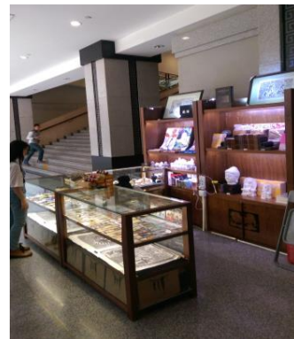
圖二十九 博物館的賣店