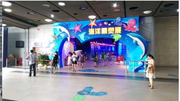
圖十三 海洋精靈展