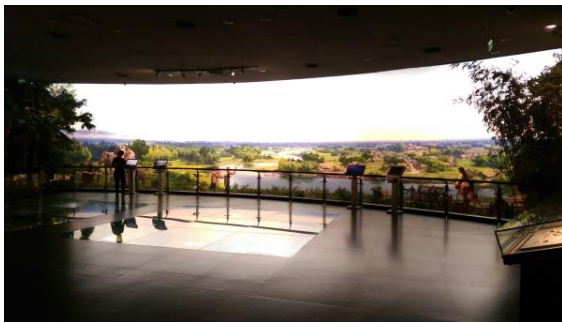
圖四十六 博物館內部的展示廳