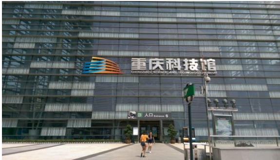
圖十二 重慶科技館的外觀

重慶科技館呼應了大陸重要城市在最近二十年來，推動科技教育的雄心，館舍龐大，師法國外博物館，採用互動與多媒體進行科技展示，讓觀眾從做中學。另外，在一樓的特展廳進行海洋精靈展，卻令筆者感到憂心，因為該展涉及到展示倫理議題，是博物館人需再三思量。該展示的目的是希望透過展示海洋生物標本教育社會大眾，但是重慶科技館的主要觀眾是親子與家庭觀眾，許多父母親帶著年幼兒童前往參觀，展出的確不只是海洋生物標本，不少展示將這些生物的內臟、組織與器官展出，部分一半是標本外殼、一半是內部組織，甚至也有將動物切片後展出，在視覺上或許達到震撼感，但是卻也可能帶給觀眾不舒適的感受。