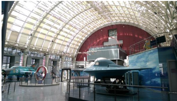
圖二十二 科技館內部的展示廳