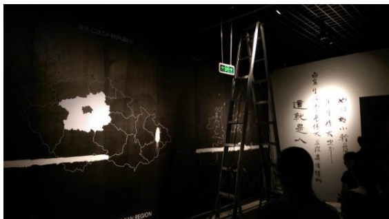
圖二十六 內部展示廳的展示手法

「四川博物院」在成都市浣花溪公園旁，占地廣闊，蒐藏豐富，是大陸西南地區最重要的博物館建設之一。藏品分為「陶瓷類」、「磚石類」、「金屬類」、「錢幣類」、「書畫類」、「民族民俗類」、「碑帖類」、「近現代史類」等八大類展品，其中館藏國家一級文物有 1399 件。由於四川又稱為天府之國，自古即為巴蜀古國所在地，擁有豐富的歷史文化底蘊，四川博物院歷年來透過考古發掘、徵集與捐贈等方式，收藏了十多萬件珍貴文物，其中以張大千畫作、漢代墓像磚、古書畫等較為著名，展場中也多以這些主題作為展示內涵。同時，四川博物院在較推廣方面，近年來著重在服務不同對象，加上四川省幅員廣闊，因此也以「流動博物館（或稱為行動博物館）」形式，將博物館的文物與資訊集中在一台移動式的卡車上，送到偏鄉地區，服務偏遠地區的民眾，成效卓越。在管理與行銷層面，四川博物院大多數大陸的博物館一樣，仍在初期開發狀態，雖然有數量與品質皆多的文物，但是在博物館文創商品的開發上，仍有很大的發展空間。但是在展覽的安排上，每年仍會定期地安排重要展品前來展出，本次參訪期間，館內特展有「微笑彩俑-漢景帝的地下王國」展出，另外剛結束的是與卡地亞珠寶合作的「藝境天工-中西方珍寶藝術」展。本次透過事先聯繫葦荃副院長，洽談雙方合作與簽訂合作協議書的可能性外，也討論未來在館員與教師、學生實習等交流的實際提議，並希望有機會可以合作辦理活動。預計在 2016 年的研討會中，邀請來自四川博物院的專家來台分享研究成果。