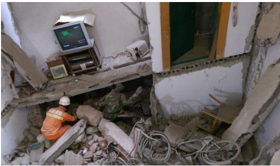
圖三十八 汶川大地震博物館展示廳