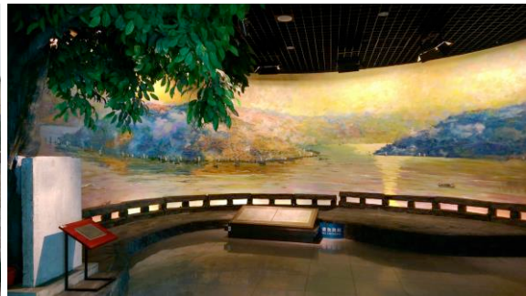
圖八 「重慶：城市之路」常設展