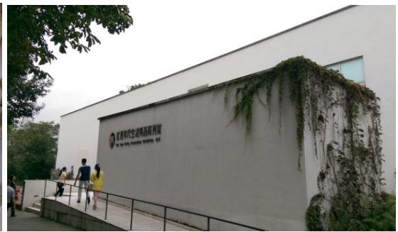
圖三十九 國民黨抗日軍隊館