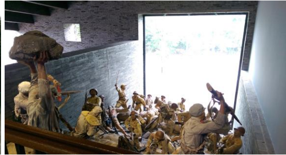
圖三十七 日軍侵華罪行館展示廳