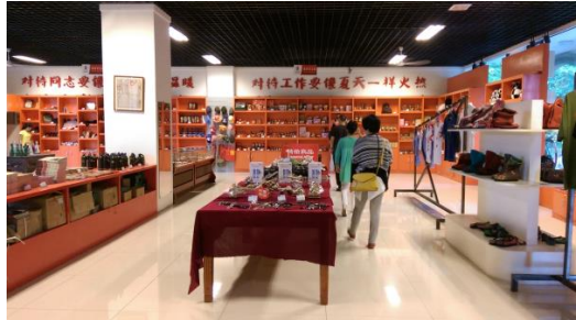
圖四十三 建川旅遊商品供銷社