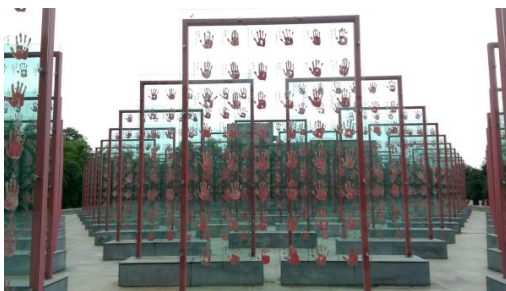
圖四十二 中國老兵 手印碑林