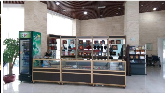
圖四十七 博物館的賣店