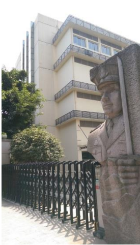
圖十六 警察博物館整修中

當日前往重慶警察博物館，但是抵達博物館門口時，被告知該館設仍在整修當中，未對外開放，因此我們決定改為前往參訪瓷器口古鎮。