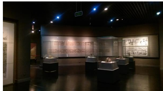
圖二十七 四川博物院內部的展示廳