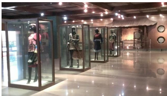
圖五十二 四川大學博物館展示廳