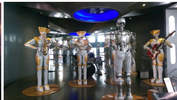
圖二十五 內部展示廳的展示手法