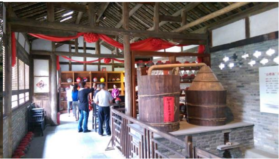
圖三十一 內部展示廳的展示手法