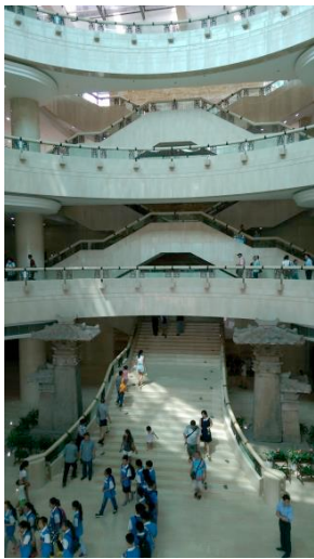
圖九 中國三峽博物館的大廳動線