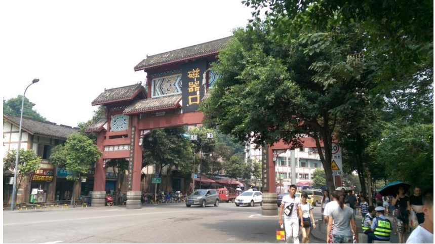
圖十七 瓷器口古鎮的入口牌坊

瓷器口古鎮，是重慶市的古鎮中唯一坐落於主要市區的一處，交通便捷，可以搭乘捷運到鄰近的一站後再步行約七分鐘即可到達。古鎮名稱瓷器口主要是因為在二十世紀初期，該地區開始大量製作瓷器，因而取代舊名龍隱鎮。進入到古鎮，發現整個區域都修復成清末民初的樣貌，已經分布出來那些是古建築，那些是新稱建的仿古建筑。在八月底的時間，應該也是暑假的末期，因此可以看到滿滿都是參觀的民眾，幾乎可以說是人潮洶湧，而兩旁所有建築物功能確是令人大之一驚，因為幾乎沒有保留任何原始功能或脈絡，而是全盤商業化。也就是瓷器口古鎮僅僅有古代建築的外觀與味道，但是實際上卻是當代觀光景點或甚至像是士林夜市的感覺。一天的參訪後，帶著惆悵的心情離開，因為好像在古代場景中失去了甚麼，有著深深的失落感，這或許是許多擁有豐富文化資產區域都會面臨的宿命：資本化、經濟化、觀光化。值得文化人省思。