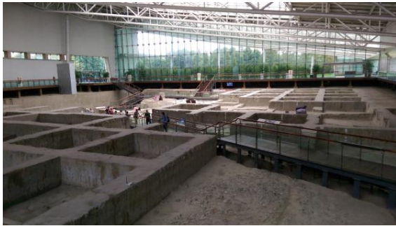
圖四十四 金沙遺址現址保存

2001年2月於成都發現金沙遺址，分佈範圍約5平方公里，距今約3200年-2900年（商代晚期-西周時期）。館藏約10000多件，種類有金屬、銅器、玉器、石器、漆木器、象牙、陶瓷等，其中「遺跡館」內的無立柱大空間設計，展現遺址的完整性，而建築主要為鋼結構的形式，為考古現場和文物創造良好的環境條件，也讓參訪觀眾可以想像考古發掘的現場樣貌。另外一座建築「陳列館」中，則以展出文物為主，將古蜀文明的金器、青銅器、玉器、漆木器等地下考古發掘物件，展示出數千年前的歷史文明，也證明與延續了三星堆文明的成果，與中原文化有相當大的差異。常設展「走進金沙」共有五個主題，分別是遠古家園、王都剪影、天地不絕、千載遺珍與解讀金沙，讓觀眾有機會認識當時人們的居住環境與生活文化。其中太陽神鳥金器最具代表性，象徵了當時的工藝之美，也成為金沙遺址博物館的館徽。陳列館中也有特展廳，定時輪替不同主題的特展，參觀當時的特展為「霸：迷失的古國」，展出來自山西博物院與山西考古研究所的珍藏文物。