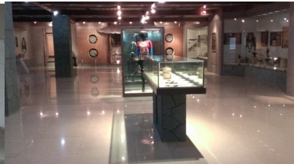
圖五十一 四川大學博物館展示廳