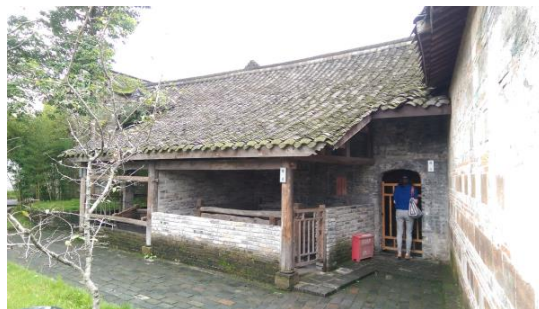
圖三十五 戶外展示區