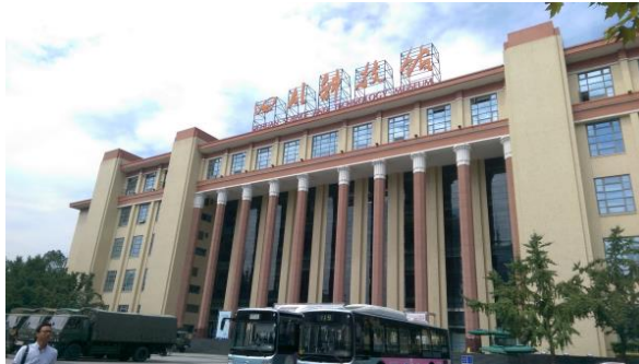
圖二十 四川科技館的外觀

四川科技館於 2006 年 11 月 2 日開館，由四川省展覽館的主體建築改建而成，位於成都市中心天府廣場的北邊。館內設有虛擬世界、數學、青少年科技園、機器人工作室等 20 個展區，館藏約 600 多件，展品藉由光、電等展示手法，輔以互動與虛擬方式，將科學與知識以有趣的方式展出。