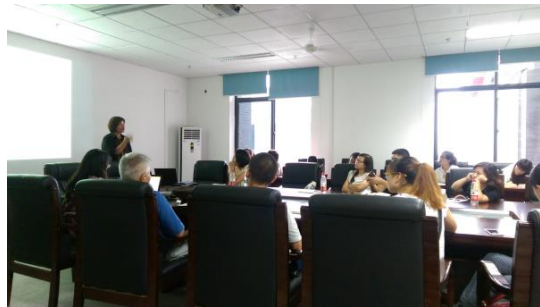
圖五十五 四川大學交流（江安校區）