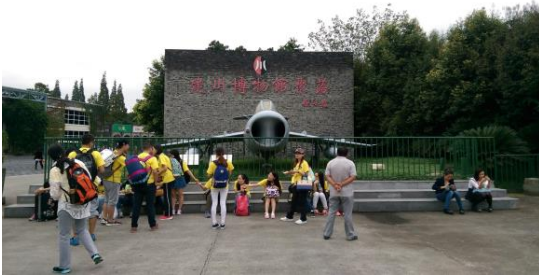
圖三十六 建川博物館聚落 入口處

全名為建川博物館聚落，由企業家樊建川所創建，館藏約 800 萬多件，其中國家一級文物有 329 件。聚落中現有 25 個博物館和 2 個主題廣場，分別由磯崎新、切斯特·懷東、邢同和、張永和、彭一剛、馬國馨等國際知名建築家、雕塑家擔任設計規劃。此館打破傳統博物館的概念，將 20 幾個博物館群聚集成而成，具備歐美戶外博物館。並設有其他商業設施，如客棧、酒店、商店等，以及結合周圍古街環境，形成具展示教育、休閒觀光的新型態博物館。