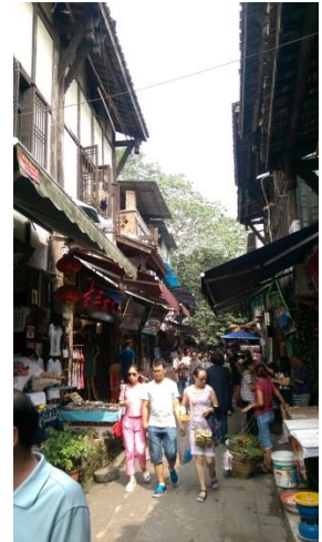
圖十八、十九 瓷器口古鎮的假日人潮相當多，商業氣息濃厚。