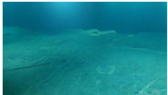
圖二 博物館中可以看到水中保存的石刻

觀眾到達博物館，只覺得是一座沿著江邊興建的建築物，進入到博物館中，一樓與二樓主要是展示廳，展出白鶴梁的歷史與不同時期的名人在白鶴梁留下的字跡墨刻，當觀眾人數到達一定數量（或定時），館方便安排一位導覽人員，引領觀眾搭乘深達數十公尺的電扶梯，逐漸往水下移動，一直到江底，看到如同水族館或是潛水艇般的觀景窗，從觀景窗可以看到水下原始的面貌，一處處重要的石刻盡現眼底，導覽人員一邊介紹不同時刻的重要性，一方面也讓觀眾可以親眼目睹被埋在江水下的石刻。這座博物館最具挑戰之處，是如何讓觀眾清楚看到混濁江水下的文化資產，需要不斷地經由過濾器過濾水中雜質，達到一定的能見度，也是整座博物館價值所在。