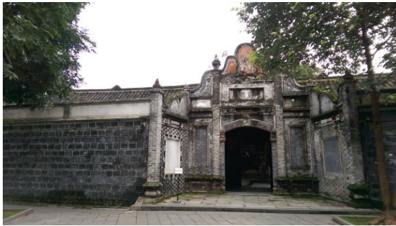
圖三十 劉氏莊園博物館 門蘭藹瑞

大邑劉氏莊園建於清末，是四川士紳劉文彩與其兄弟陸續修建而成，是中國保存較完整、規模較大的私人莊園之一。2009年5月，被公布為國家三級博物館。房屋有350多間，館藏2萬多件，為研究中國封建時期農村建築物的重點項目。