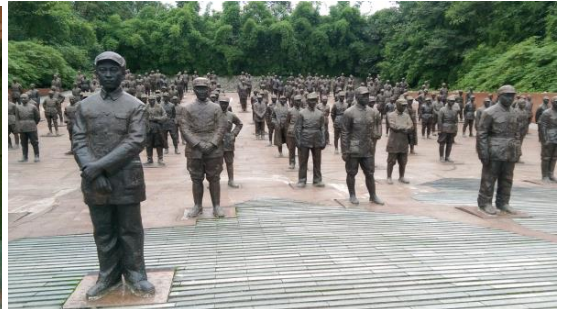
圖四十一 中國抗日壯士 戶外展示