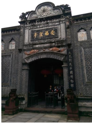
圖三十二 劉氏莊園博物館 入口