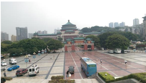
圖十一 重慶市人民大禮堂