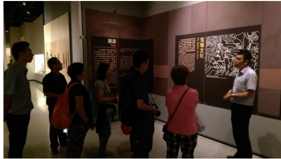
圖四十五 金沙博物館參觀、導覽