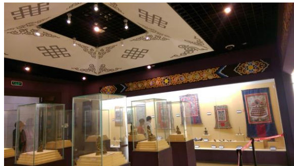
圖十二 博物館內部的展示廳