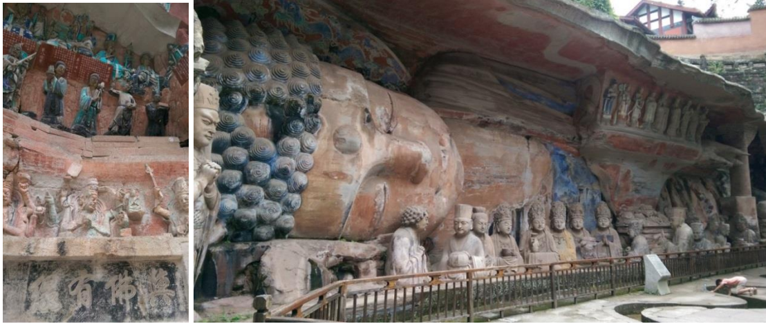
圖三、四 佛像石刻，典雅秀麗。

大足石刻是目前重慶市直轄市區域中唯一名列聯合國教科文組織的世界文化遺產指定點，位於重慶市郊的大足縣，使該區域摩崖造像的石窟藝術的總稱。整區主要以佛教石刻為主，從唐末（西元 650 年）、歷經晚唐、五代、盛於兩宋，綿延到晚清時期，山壁上的雕刻十分精細，往往是運用一組一組地掉向來表現不同的佛經故事，經年吸引來自不同國家的遊客前往造訪。其中以寶頂山石刻最具代表性，因此從重慶市搭車前往。其中最吸引人之處是石刻仍然維持當時的樣貌，以臥佛、千手觀音為箇中亮點，每每令觀眾駐足停留，細細觀賞，石刻雕像多達四千多座、造像龕窟兩百多處，俯拾皆有獨到之處，驚嘆大陸在文化資產保存上所的心力。