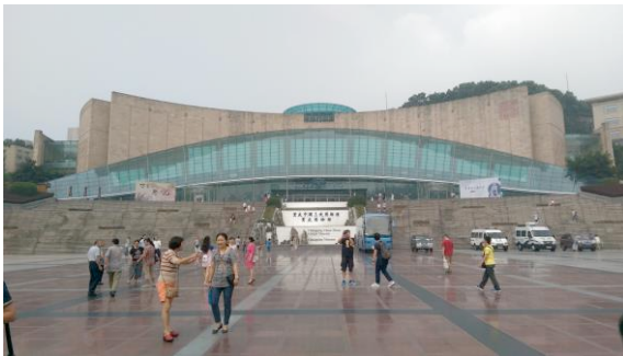
圖七 中國三峽博物館的外觀

重慶三峽博物館又名重慶博物館，與重慶市人民大禮堂相對，前身為 1951 年 3 月成立的西南博物院，新館於 2005 年 6 月 18 日正式開放，現為國家一級博物館。展廳面積為 23, 225 平方公尺，主要分四個展區：「壯麗三峽」、「遠古巴渝」、「重慶：城市之路」、「漢代雕塑藝術」、「歷代錢幣」、「歷代書畫」、「荷蘭高羅佩家族捐贈高羅佩私人收藏文物展」，另有特展區數個。展出重慶地區重要文物、也已造景方式讓觀眾了解到重慶市豐富的自然與人文資源。