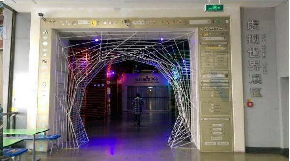
圖二十一 虛擬世界展區