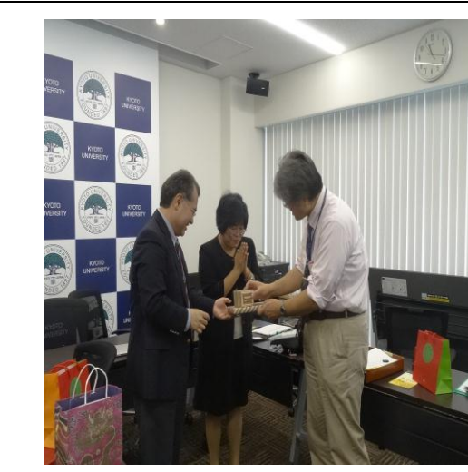
京都大學致贈本校紀念品