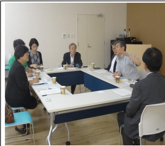
大阪府立大學座談會 1