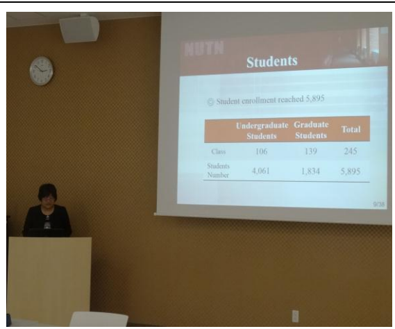
大阪府立大學座談會 2