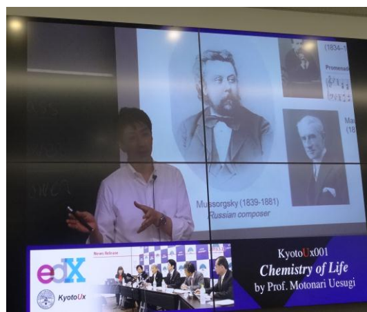
京都大學遠距教學方式