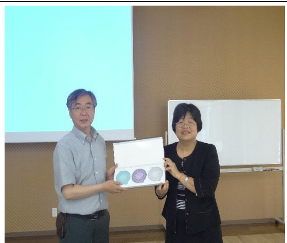
本校致贈大阪府立大學紀念品