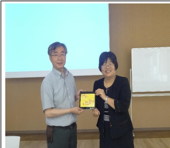
大阪府立大學致贈本校紀念品