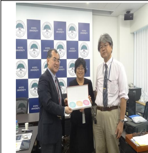
本校致贈京都大學紀念品