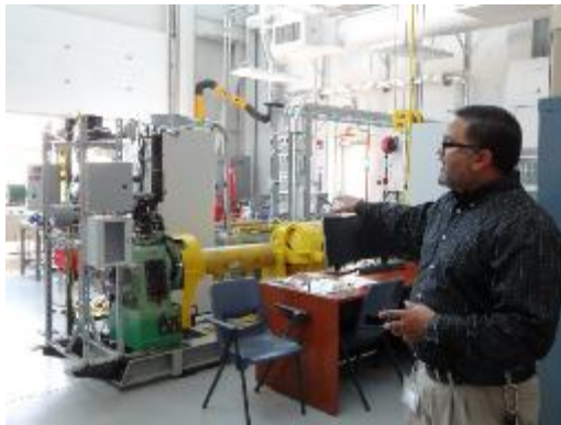
參訪 SBU CEWIC 實驗室

此行適逢 SBU 畢業典禮，本校獲邀一併參加，與學生家長一同感受畢業感動的一刻。下午即刻啟程參訪該校著名的實驗室 Center of Excellence Wireless and Information Technology(簡稱 CEWIC)，此實驗室位於該校的 Research and Development Park，自 2003 年啟用以來，一直以打造一流的無線通訊、資訊、科技自許，提升產業發展，期望能有效減少高科技產業的人力耗損，提生機器設備的高效能。與該校近似，本校與新竹科學園區僅一牆之隔，與世界科技大廠合作密切，科技於全球享富盛名，除孕育出許多頂尖的科技人才外，許多知名大廠之 CEO 亦為本校之傑出校友，若兩校於相關領域合作，勢必能激起更多學術研究的火花。結束於 SBU 之參訪行程後，即前往波士頓。