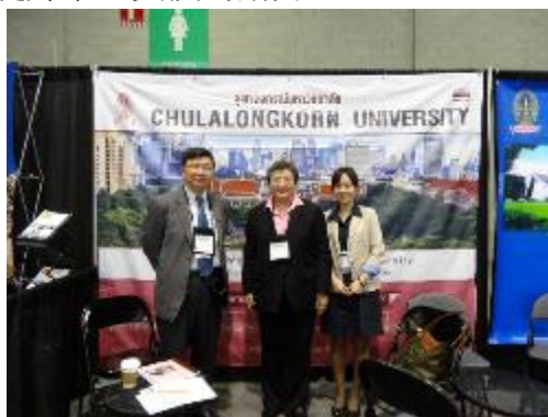
與 Chulalongkorn Uni.國際長合影