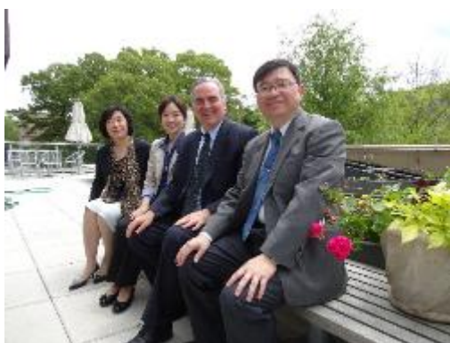
本校代表與 SBU 副校長、副國際長合影