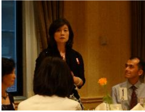
教育部林政次受邀於餐會致詞

本校在會前已與此次參與 NASFA 之多所姐妹校代表們接洽，也收到許多來自非姐妹校之來信，希望能會面共同討論未來雙方合作事宜，此次年會進展順利且創造許多與姐妹校/非姐妹校學術交流機會。此次拜會逾 25 所學校代表，茲將重要會晤驢列如下：