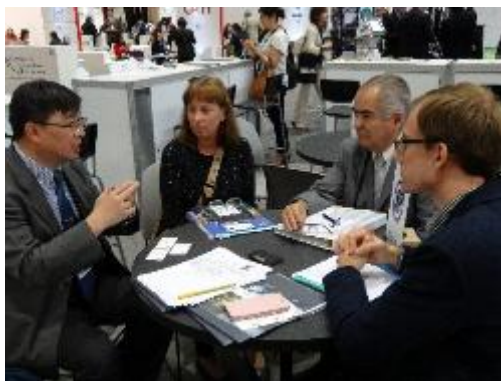
與姊妹校 Chalmers Uni. of Technology 代表討論雙方合約事宜