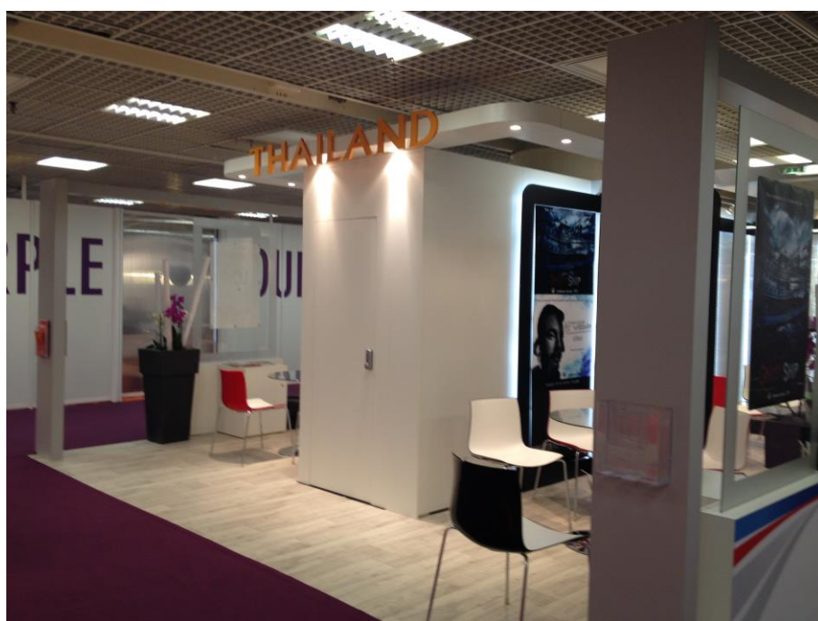
■ 泰國館簡潔明亮，且運用透明玻璃裝潢營造大空間的視覺假象。