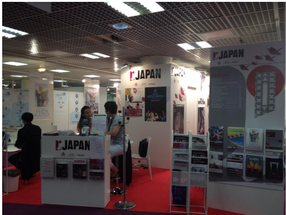
■ 日本館占地廣大，佈置搶眼，裝潢具巧思。