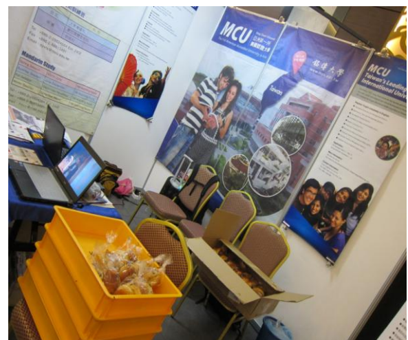
海青班學員創業成最佳活廣告(銘傳)