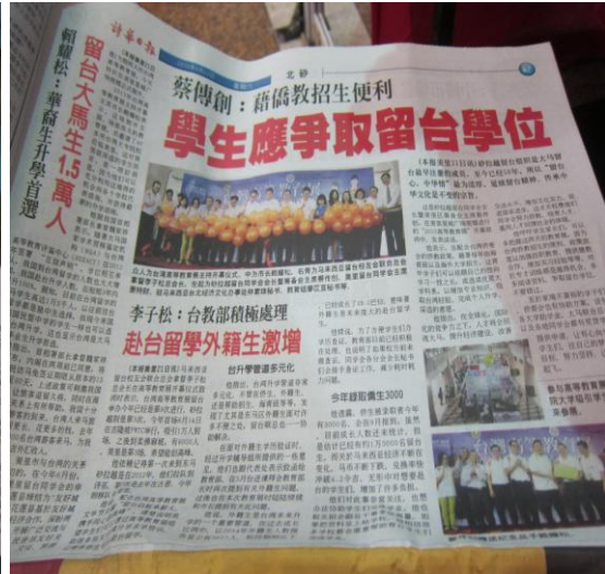
詩華日報對美里教育展報導