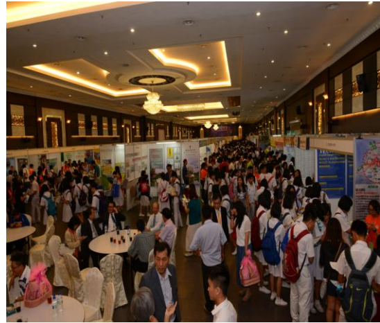
參觀學生絡繹不絕（麻坡）