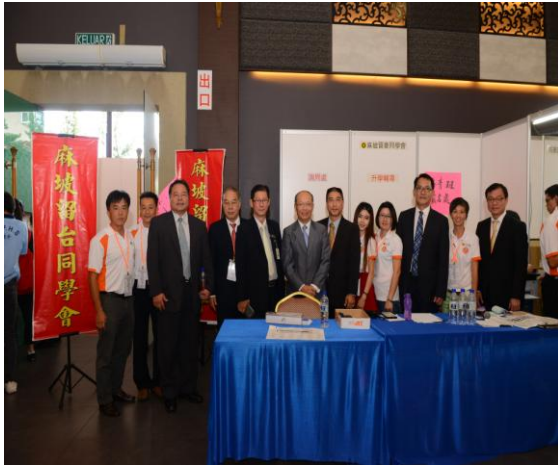
麻坡同學會現場亦受理海青班報名