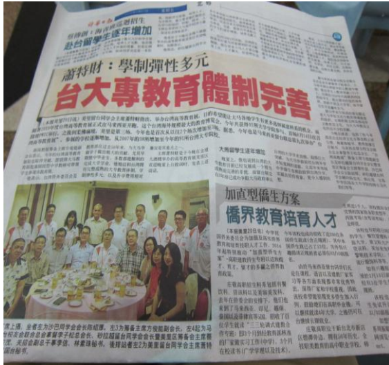
詩華日報對美里歡迎宴報導