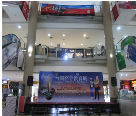
美里場高教展場地