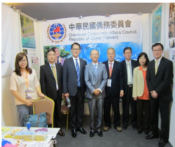
程公使及留臺聯總幹部參觀本會攤位