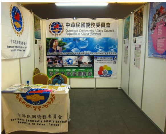
麻坡場本會攤位佈置情形