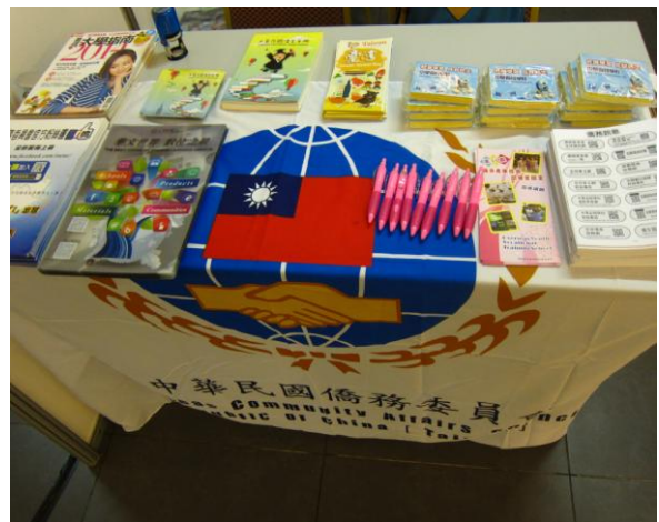
麻坡場本會發放文宣