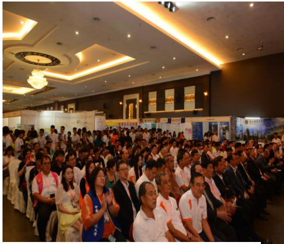
出席貴賓冠蓋雲集（麻坡）