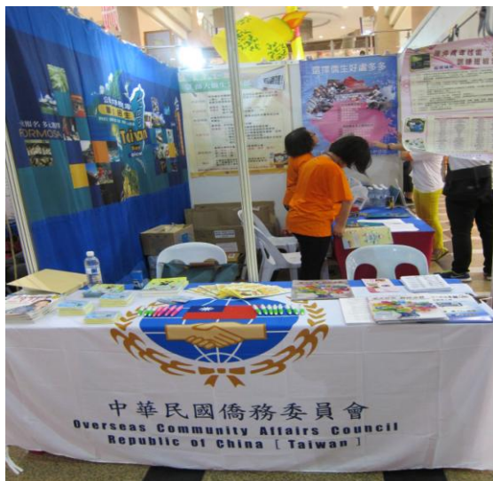
美里場本會攤位佈置