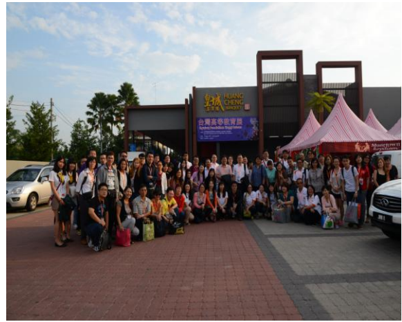
麻坡場參展人員合影