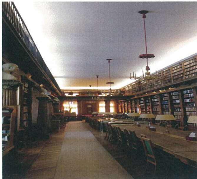
圖 18：法蘭西學院圖書館(平日不對外開放，僅供院士使用)

現行臺法文化獎，每年由評選會遴選出「法國獎」及「歐洲獎」兩獎項得獎者，近年常有對象不易尋找之困擾，恐影響獎項口碑及品質，此次趁頒獎時機，臺法雙方取得協議定於本年 12 月中旬以前續簽署延續 5 年的協議書。未來將在此基礎上繼續合作，以推動更深層的文化交流。