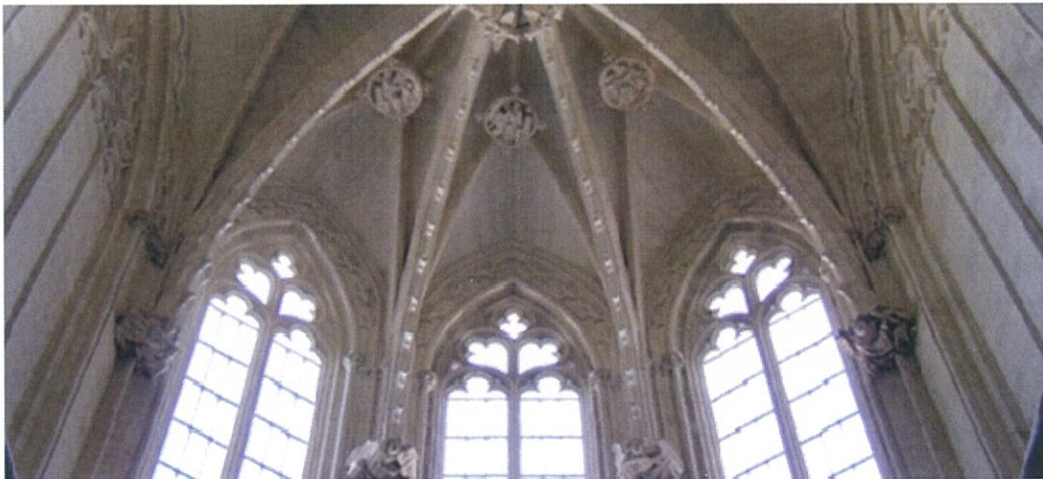
圖 22：亞維農市塞勒斯汀教堂中殿（Eglise des célestins）。