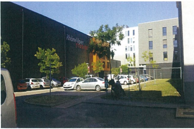
圖 15：波匹賽 (Pole Pixel) 園區內 Factory 國際電影學院一隅