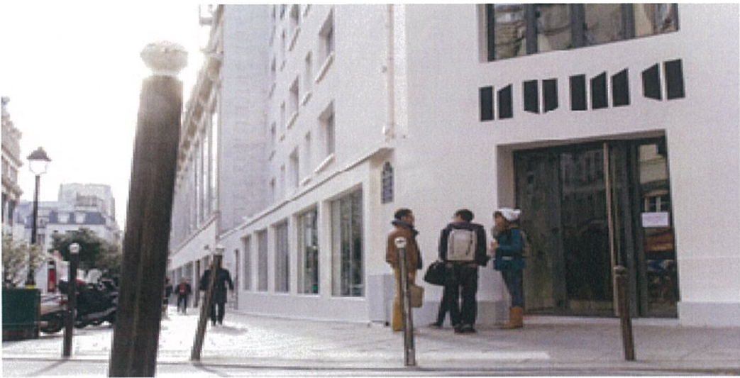
圖 21：位於巴黎第二區的 NUMA 數位創意平臺。

而巴黎 NUMA 數位平台也是將巴黎第二區的舊有建築轉化成協助新創企業家和公司的工作空間。NUMA 的空間共有七樓，每一層皆供一目的使用：連結、合作、實驗、加速扶植、交流。法國人善用既有空間，將之活化創造嶄新價值，以及政府不吝尋找場地建立數位基地，利用閒置舊址作為活動、工作坊、研討會場地，俾連結相關產業、加速扶植創新企業、創造企業與初始計劃媒合的經驗，都足以提供臺灣參考學習。