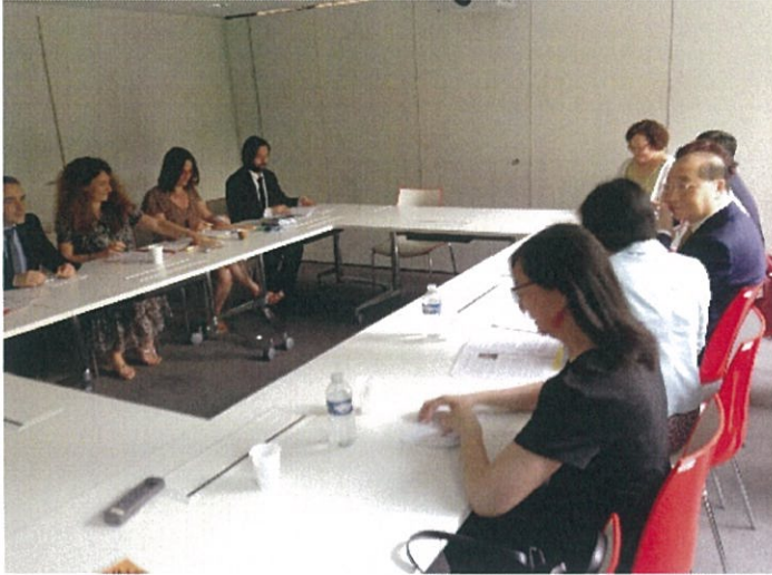
圖 5：臺法雙方逐項檢視目前合作交流狀況。

此次會談主題廣泛而聚焦，幾乎提及所有臺法交流有涉獵的領域，如電影創投、流行音樂合作、出版及互譯計畫、藝術合製共創、文創產業交流等。我方提出在電影人才培育、推動臺灣