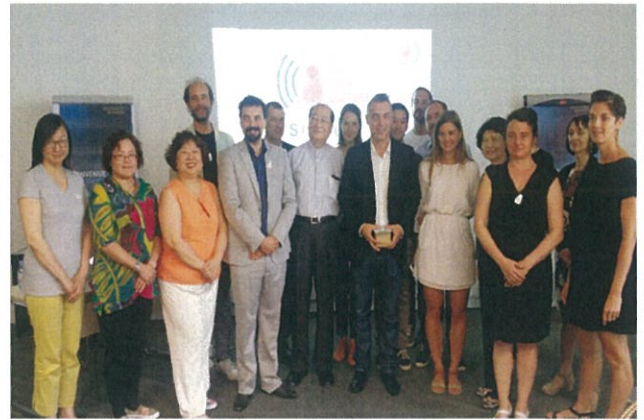
圖 14：French Tech Culture Avignon 研發團隊與本部訪團合影