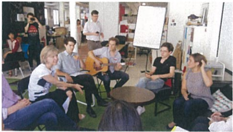
圖 19、20：孕育新創公司的溫床：Pole Pixel 影音數位創意園區（上圖）和 NUMA 數位創意平臺（下圖）。

法國文化行政機制依政府行政層級分為中央政府及地方政府：中央政府以文化暨傳播部為主；地方政府則以（省）區政府（Région）之文化部門設立機構為要，其次，地方政府各級單位亦有相對之文化預算與機構設立。