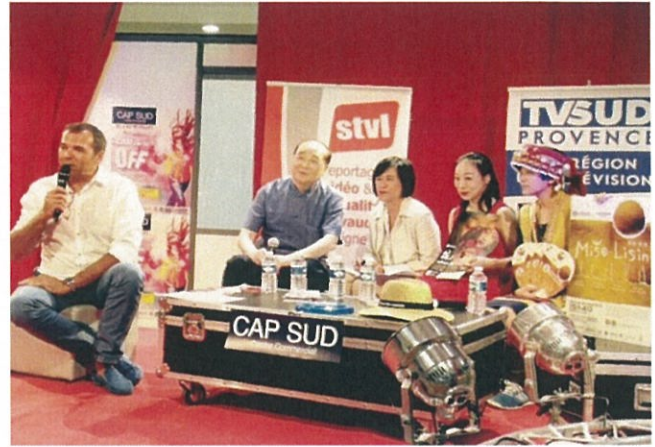
圖 11：台灣團隊參加外亞維農藝術節遊街活動 圖 12：洪部長與河床劇團接受法國媒體專訪