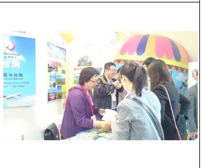
展攤上向上海民眾推介農場