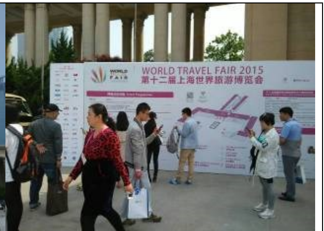
上海展覽中心展攤指引地圖