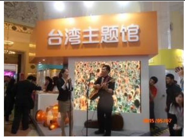
臺灣主題館小舞台表演活動