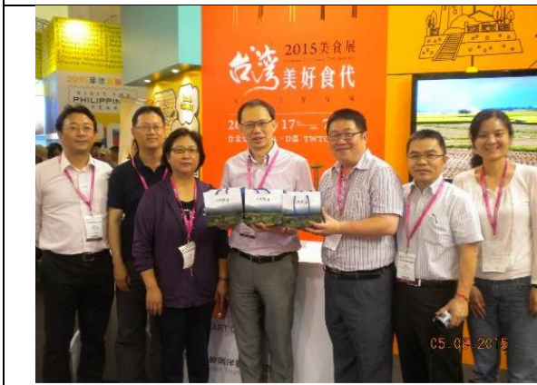
致贈農場茶葉予上海辦事分處