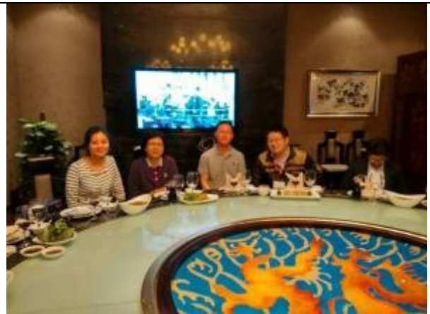
上海辦事分處交流餐會現場