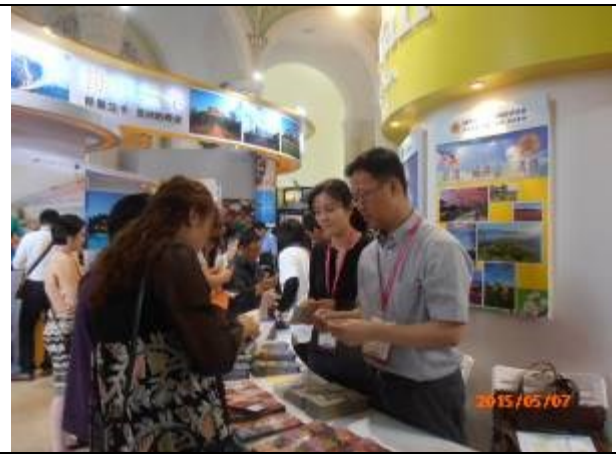
本會工作人員向當地民眾說明農場旅遊資訊