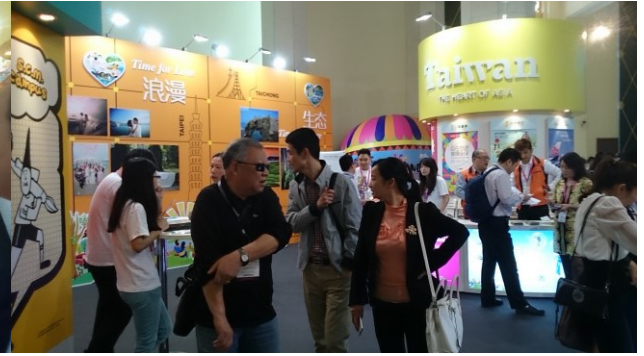
臺灣主題館參觀人潮