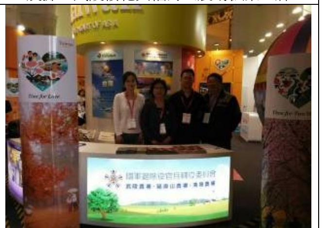
本會與農場工作人員合影