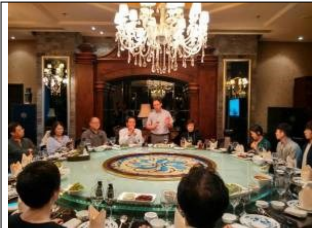
上海辦事分處李主任嘉斌致詞歡迎

交流餐會於5月9日18時假順興川菜舉行，本次參加臺灣主題館之相關單位，除了少數未參加外，幾乎都出席了餐會。上海辦事處李嘉斌主任致詞歡迎與感謝各單位的熱心參展，共同推廣臺灣優質旅遊。另外也表示過去陸客來臺以團進團出的巴士環島旅行為主，但許多人都有還想再去一次臺灣的心情與意願，尤其加上上海年輕旅遊客群的加入，預計今年自由行陸客將會追上團客數量，尤其是上海與華東地區的年輕族群更將會是這波自由行旅客的大宗，希望臺灣旅遊業者共同努力，以創造更好的觀光業績。