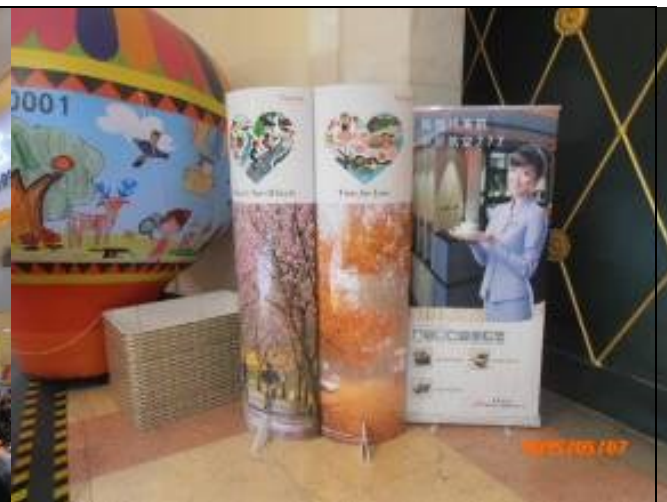
展攤上武陵櫻花與福壽山農場楓葉立牌