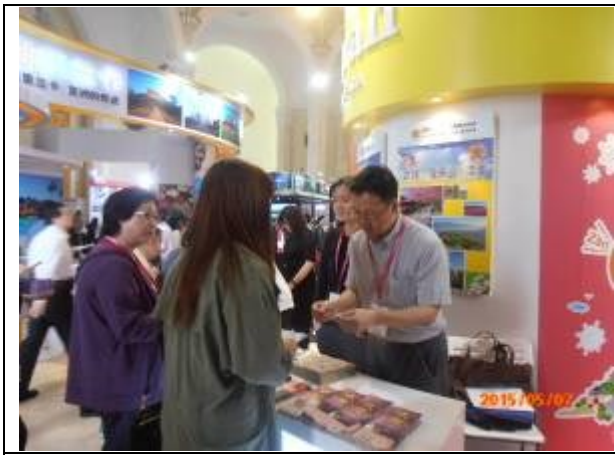
本會工作人員與當地業者交換名片