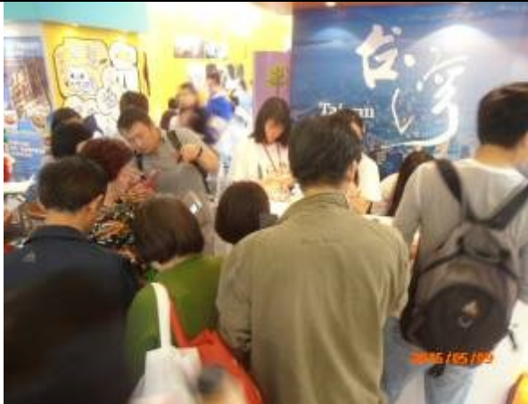
臺灣主題館贈送宣傳品情形