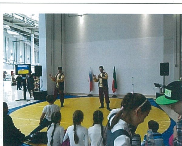
運動示範區結合傳統民俗舞蹈歌舞表演