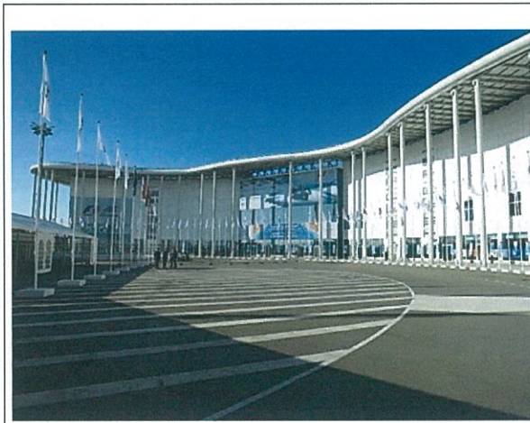
會展地點 Lenexpo Exhibition Centre