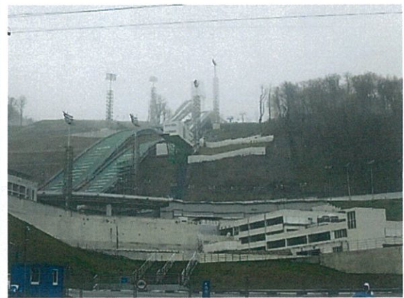
Russki Gorki 跳躍滑雪中心