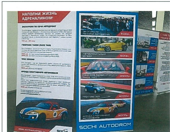
索契奧林匹克運動場經營駕駛賽車體驗

接著驅車前往距離 45 公里外的山區場館，原本的山路為雙向單線通行，且順著山勢蜿蜒崎嶇，也在取得冬季奧運主辦權後，沿著山谷河流興建鐵路和公路(雙向雙線)各一，因此讓索契辦理冬季奧運經費暴漲至 550 億美元。上山先來到至海拔 1000 公尺的 RusskiGorki 跳躍滑雪中心，再來到海拔 1500 公尺的 Ross Khutor 山區選手村，賽後已轉型為滑雪度假旅館，窗台上仍懸掛著各國參賽旗幟座做為旅館特色。到達山頂海拔 2100 公尺，此時氣溫已下降到攝氏零下 11 度，搭配強風能見度只有 10 公尺左右。因此無法看到完整的滑雪場。