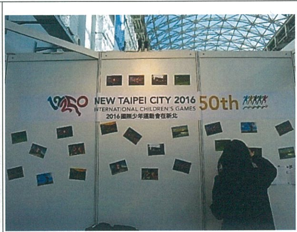
團員佈置新北市攤位情形

展覽活動時間為每日上午的 9 時至 18 時 30 分。20 日上午本團成員出發前往會場佈置，今年背板海報輸出廠商製作自黏式海報，撕下即可貼於展場看板，新北市本次係以舉辦「2016 年國際少年運動會」為主軸，在背板設計上以我青年選手為圖樣，象徵青春活力，並以黏貼方式固定於展場看板上，除缺點為使用一次後棄置外，佈置方式尚稱有效率，同時節省下龐大的空運費用，也較委託大會代為佈置更為經濟。除了以新北市特色之沙灘、天燈及野柳風景等作為佈置背景，也放置筆電播放宣傳影片，宣傳品部分的贈品有顏色鮮艷小手環、創意設的小別針及精美明信片等，比較可惜的是，宣傳人員這次沒有像往年穿著我國傳統之原住民服裝，雖然非常認真解說介紹新北市及國際少年運動會，但單調的發送宣傳印刷品確實會降低了人潮的注意力。新北市另外花錢刊登 SportAccord 年會刊物 “The Daily” 每日刊登半版廣告，共有 5 大篇幅，以增進其宣傳效果。