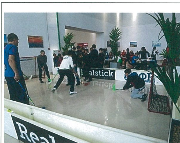
運動示範區在學童的參與下活力十足

SportAccord 年會自 2012 年起於展場中設立「運動示範區 (Sports Demo Zone)」，提供所屬會員組織展示所轄運動，以廣為宣傳。本屆年會示範運動設在會展內區隔成區，仍須刷卡進入，包含足球、現代五項、角力、滾球、柔道、空手道、合氣道等，並結合傳統民俗文化及飲食在現場設攤及表演，這次大會邀請許多學校學生前往體驗，會展後兩天人潮大量減少之際，此體驗區仍然熱鬧非凡。