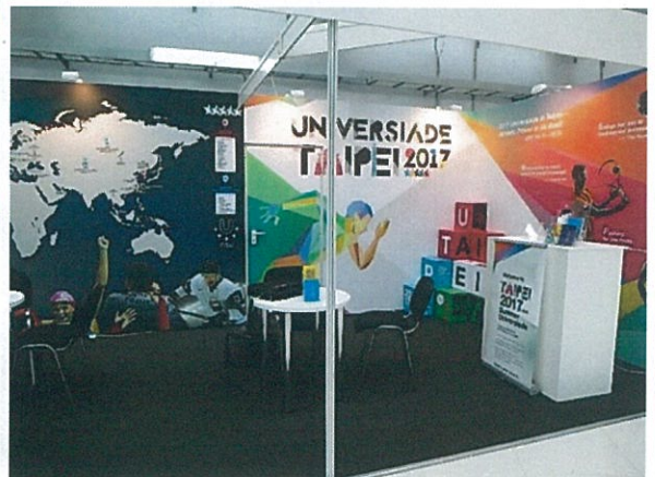
2017 臺北世界大學運動會攤位