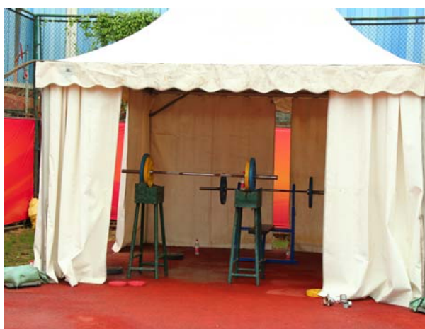
(圖 14：簡易重量訓練室)