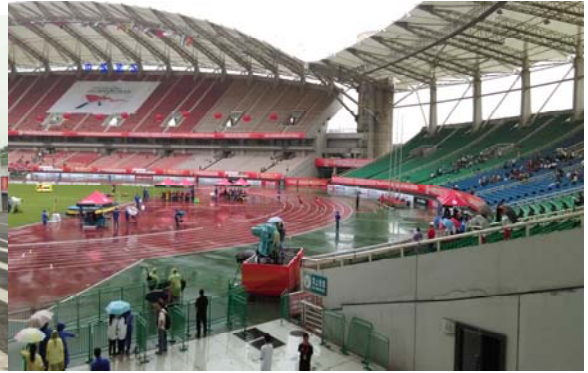
(圖 34：賽場公共轉播區域)

最後有關經費和市場開發問題向付副主任請教。付副主任表示，本次賽事直接投注的經費不到人民幣 600 萬元(折合約新臺幣 3,000 萬元)，依循以往中國辦理賽會的模式，中央的國家體育總局僅提供行政協助和少部分經費，主要均由武漢市政府、湖北省體育局和中國田徑協會共同出資辦理。而武漢之所以積極申辦亞錦賽，係為了提升武漢體育中心的使用率，打響其知名度，吸引更多外商投資武漢體育中心所在地的武漢經濟技術開發區(武漢地鐵四號線延伸至武漢體育中心的工程刻正進行中)，並主打「武漢，每天不一樣(Wuhan, Different Every Day)」(這也是武漢街道隨處可見的口號標語)，宣傳武漢市。主要贊助商為 Adidas、農夫山泉礦泉水、金陵體育公司、中國體育彩票、東風本田汽車公司、武漢農村商業銀行等企業贊助如服裝、飲用水、賽會設施等，然而市場開發非本次賽會重點，賽場周邊並無看到大型廣告看板和賽會周邊商品販售，僅有一個販賣飲料零食的小攤位。