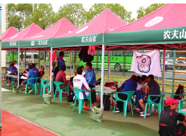
(圖 15：各隊簡易休息區)