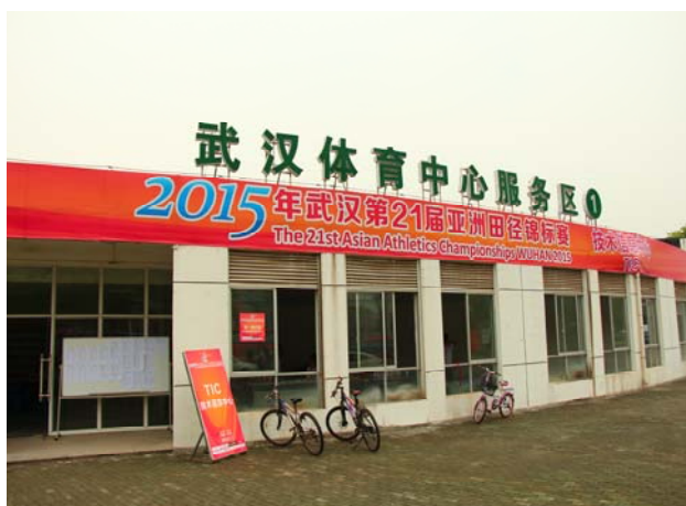
(圖 12：TIC 即時訊息中心)

檢錄室前往主場館，可讓選手檢錄順利不被干預；而我國的台北田徑場並無此設計，檢錄區至場館中間需另以設置柵欄規劃通道，唯一優點是可以選擇通道距離的長短，無須走很長的一段路即可進入比賽場地。而本次賽會組委會為了克服這一點，特別提早選手檢錄時間，讓各參賽選手可及早進入會場。