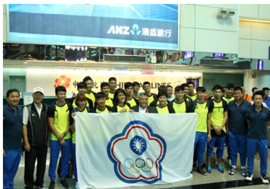
(圖 1：中華代表隊出發前合影)

考察團一行人於晚間十點抵達武漢天河機場。該機場雖為國際機場，惟規模與載量僅具地方機場特色，對於參賽代表團並無設置特殊通道加快出關速度。出關之後在賽事組委會人員及志工的引導下，一行人搭上組委會安排的接駁車輛離開機場，駛往距天河機場一小時車程的賽會指定飯店之一湖北中核國際酒店，抵達時已是晚間 11 時 30 分。飯店大廳設有接待櫃檯，由大會志工輪班接待來自亞洲各國的代表團人員，並以布告欄和白板每日更新有關賽會的重要訊息。代表團一行人在領隊田協副理事長翟學電代表領取我國各參賽選手及代表團人員證件後，隨即辦理住宿 check-in 入房休息。