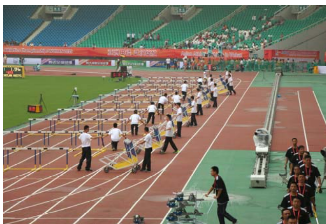
(圖 22：賽會志工協助收整跨欄)

北當地志工招募組織報名，而本次大會提供服裝、餐飲。各個地點不同的志工均以不同顏色的衣服區別，飯店駐點的志工身著黃色衣服，工作內容為協助各國代表隊報到，更新賽會訊息，提供外語翻譯協助等服務；而賽場志工身著白色衣服，工作為引導選手入場，提供抵達賽場的外國隊伍翻譯協助，協助裁判執行賽務工作如引導選手就定位、協助當地技術裁判(NTO)或國際技術裁判(ITO)、快速撤收場地簡易設施如起跑器、起跑標示等，有趣的是賽會並未安排隨隊志工，和外籍隊伍作一整天貼身接觸，僅安排駐點志工，因組委會認為賽會各重要地點均已進駐志工，不須為各隊設置隨隊志工，這和我國舉辦運動賽事的作法不同。