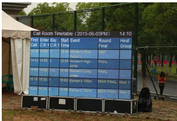
(圖 16：在熱身場旁設置的即時檢錄公告看板)