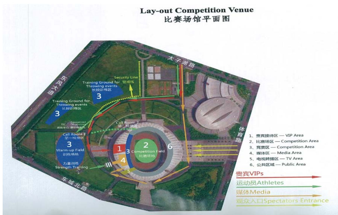
(圖 11：本屆賽會場館平面圖)

本日下午搭乘大會安排之接駁車，出發至武漢體育中心參加2015年亞洲田徑錦標賽之開幕典禮。武漢體育中心位於武漢市西南的「武漢經濟技術開發區」，具有一場(容納60,000人的體育場)兩館(容納3,500人的游泳館和13,000人的體育館)，總佔地1,580畝，興建成本總計12億6,000萬元人民幣 1 ，目前由武漢體育中心發展有限公司負責營運。武漢體育中心除包括主體育場及游泳館和體育館外，還有兩片標準訓練場，以及東、西、南三個廣場，並有休閒廣場、商務區、全民健身等配套設施 2 。本次亞錦賽使用落成於2002年9月的主體育場(賽事主要場地)、體育訓練場(熱身及檢錄場地)及兩面臨時搭建的投擲訓練場(鉛球、標槍、鐵餅、鍊球等)。