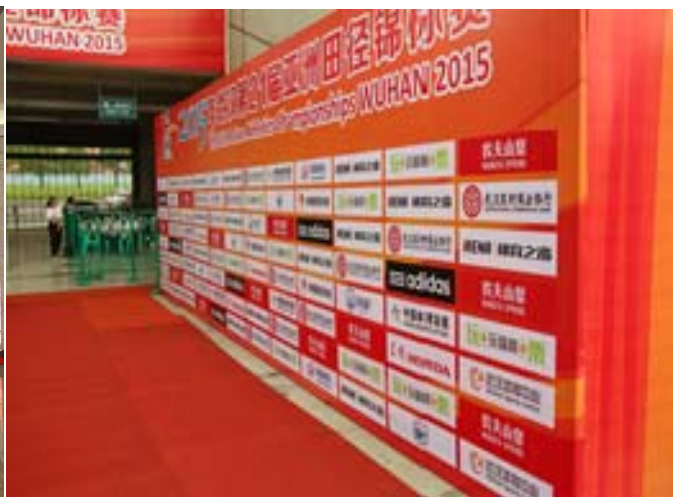
(圖 34：賽場記者訪問區的展示背版，上面有各家贊助商的 logo)