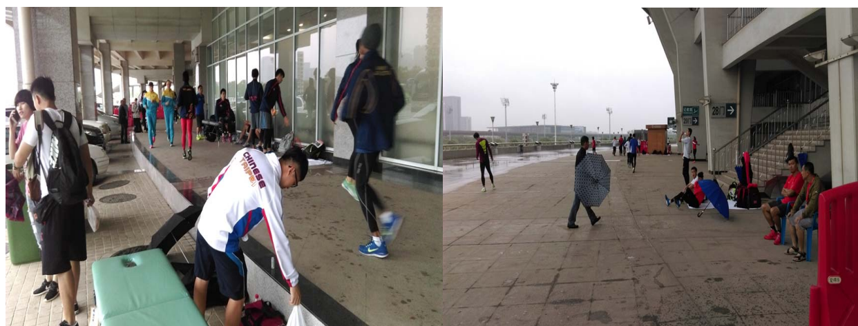
(圖 42、圖 43: 各隊休息區臨時移至田徑場屋簷下，選手盡量在不被雨淋的地方熱身)

本日觀賽重點為男子跳高項目。然而今日武漢地區卻降下大雨，溫度比昨日下降許多，許多選手都是冒雨熱身，各隊休息區也從主熱身場的帳棚被移到田徑場周邊屋簷下。