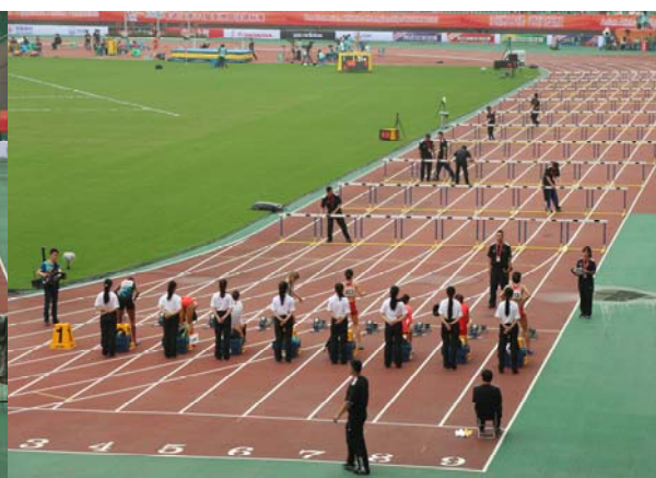
(圖 23：賽會志工協助選手收整衣物)