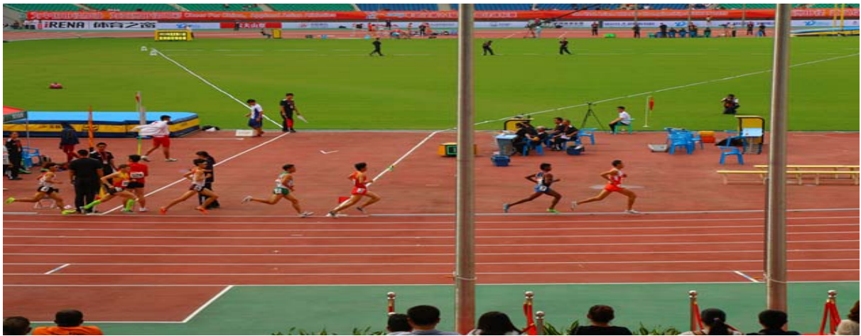
(圖 39：跑道上正進行男子一萬公尺決賽，左下角為即將進行的男子標槍決賽助跑點，可見若兩項賽事同時舉行，標槍選手助跑必須注意一萬公尺的跑者)

大學運動會我國田徑代表隊，可以期待兩位選手在世大運的表現；另外美中不足的是，今日開始的標槍項目，參賽選手助跑線與參加徑賽(一萬公尺、五千公尺)等選手重疊，如不注意容易發生撞傷的危險，故大會安排助理裁判在旁提醒標槍選手，但也造成選手助跑節奏調整不易，加上場地因下午開始的小陣雨較濕滑，使參賽選手普遍未發揮最佳實力，這一點在隔日的跳高決賽也發生類似問題，實為爾後安排有關賽事時要注意之處。主場地雖然最多可進行六至七項田徑賽事(撐竿跳、徑賽、鐵餅、鉛球、鍊球、跳遠、標槍)，但賽事安排的先後順序上除要注意安全性外，也要注意賽事進行的流暢度，避免因為時間壓縮而造成同一面場地賽事有執行不順的狀況。盡量減低對選手的影響。