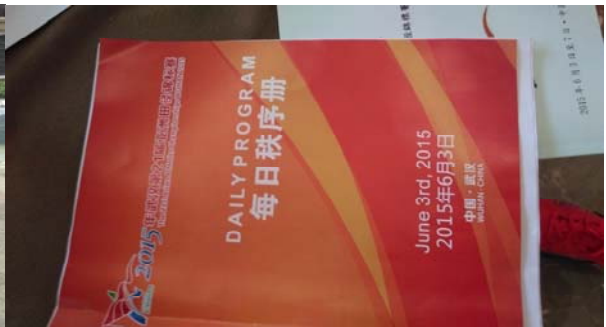
(圖 7：本次賽會贊助廠商東風本田贊助車輛) (圖 8：每日秩序冊)

另外本日也參觀了飯店的午、晚餐供應情形。組委會指定酒店中核國際飯店提供住宿代表早、中、晚三餐，以房卡、餐券方式進入餐廳使用，以自助餐形式供應，並未特別為各國選手準備特別餐點。