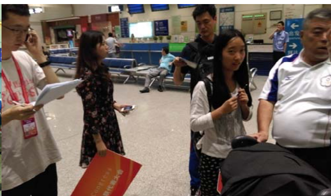
(圖 2：組委會人員及志工於天河機場引導代表團)