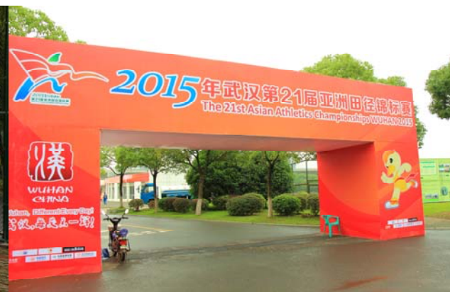
(圖 17：大會接駁車下車處的門檻)