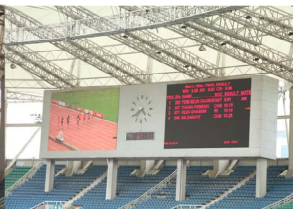
(圖 31、圖 32：賽場大螢幕畫面，以及賽會即時畫面重播)