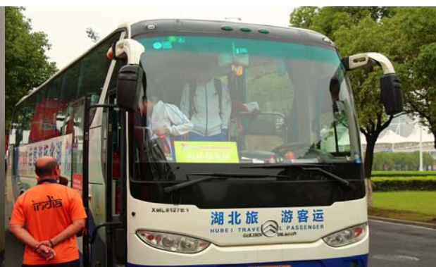
(圖 44: 本日接駁時間及各隊離開時間)