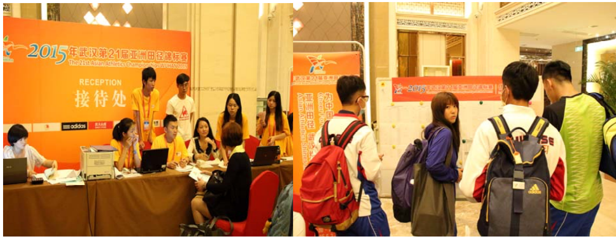
(圖 3：設於中核飯店大廳的接待櫃臺) (圖 4：代表團先到接待處右側的布告欄更新訊息)