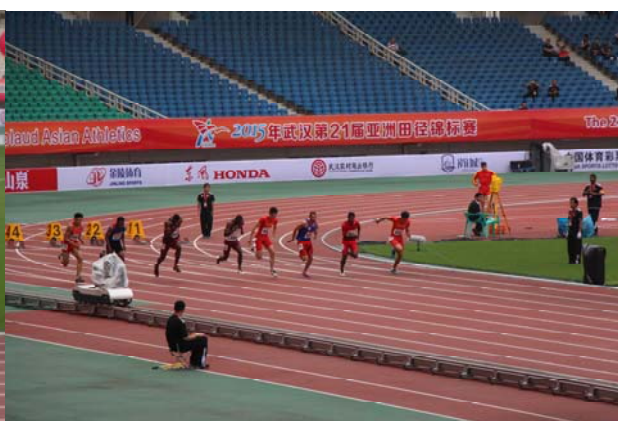
(圖 27：載運鍊球的小車) (圖 28：男子 100 公尺使用的追蹤攝影機)