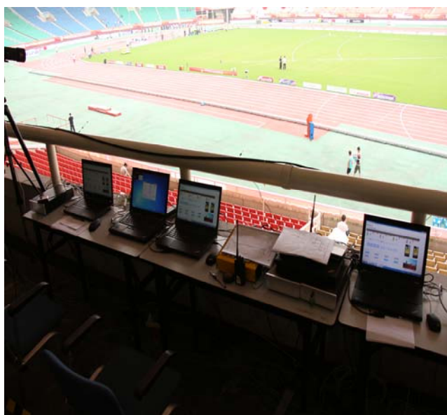
(圖 29：賽會展演室使用機器)

隨後付副主任帶領考察團參觀賽場各重要空間，如賽前、賽後控制中心，醫療室，賽會展演指揮室，裁判休息室等處。其中參訪團最感興趣的是體育展示指揮室如何執行賽會指揮，以及如何與轉播單位結合。展演指揮室表示，轉播單位中國中央電視台為了八月在北京舉行的世界田徑錦標賽熱身，本次賽事免費轉播，配合展演指揮室撰擬每日腳本，將賽會畫面於轉播時段對全中國放送(平均一日轉播時間為兩小時)，並分送賽場螢幕。