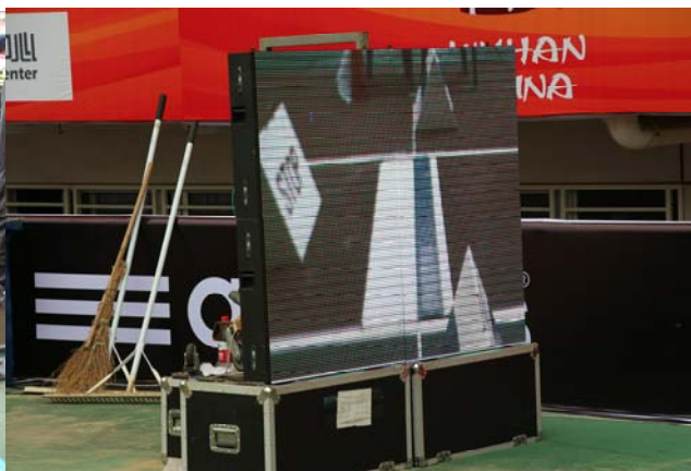
(圖 25：跳遠賽事使用的影像測距系統) (圖 26：跳遠賽事使用的影像測距系統即時畫面)