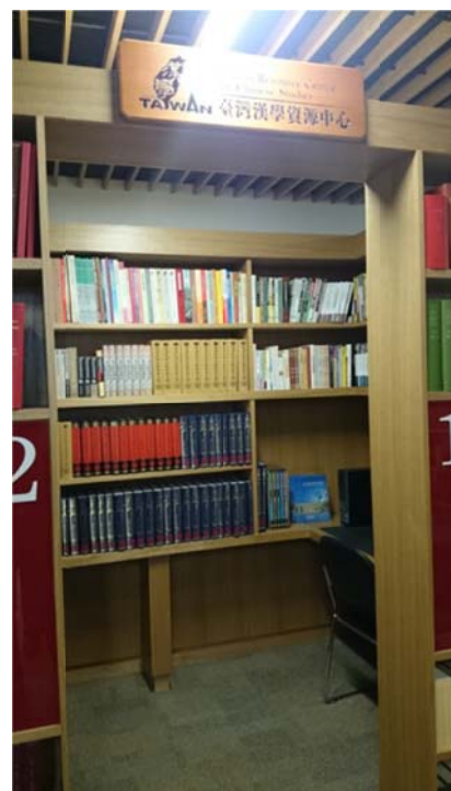
牛津大學臺灣資源中心