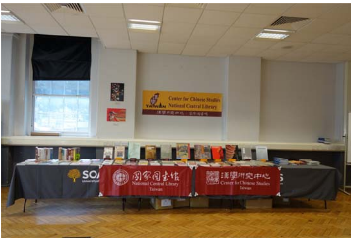
精選近三年臺灣出版臺灣研究相關之圖書及 DVD 約 70 餘種展出