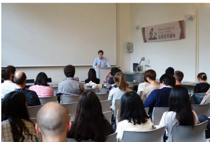
現場聽眾出席踴躍