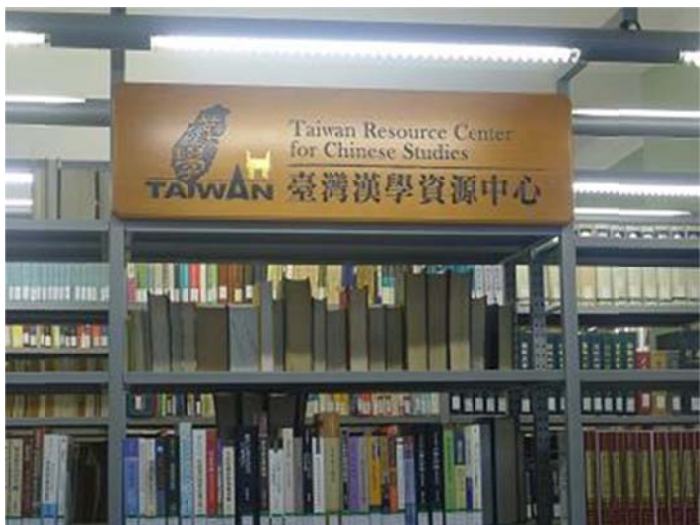
德國萊比錫大學臺灣資源中心