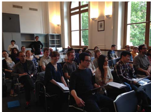
現場聽眾出席踴躍