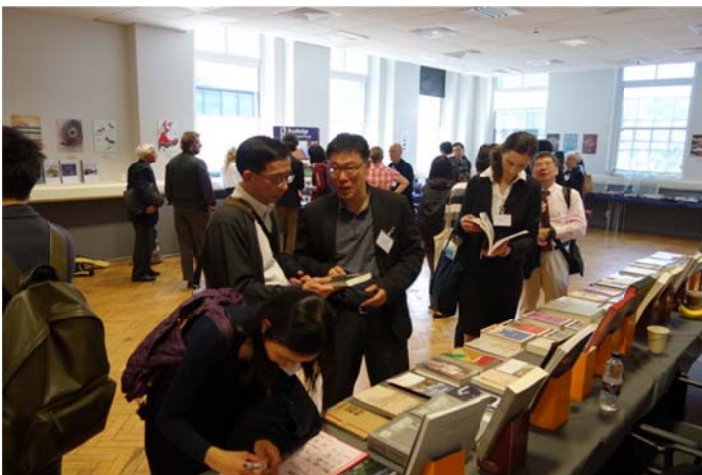
書展參觀學者踴躍