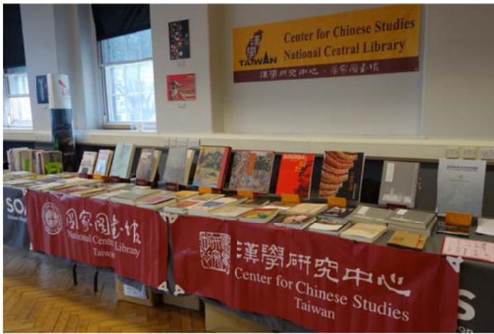
展出臺灣研究書籍