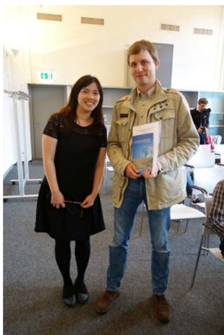
筆者與中心學人博安德於萊比錫大學合影