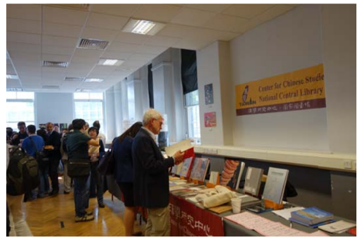
書展參觀學者踴躍