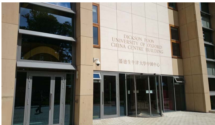
牛津大學中國研究中心