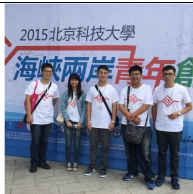
參加海峽兩岸青年創業論壇