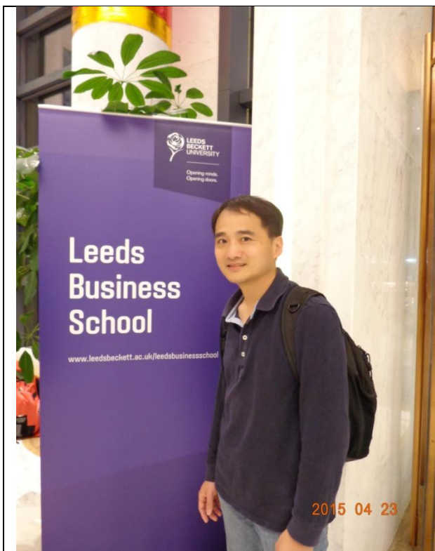
註冊地點：望湖賓館