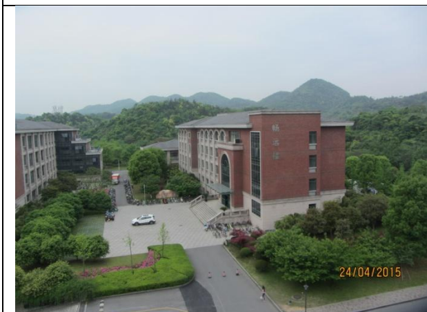
參觀浙江工業大學2