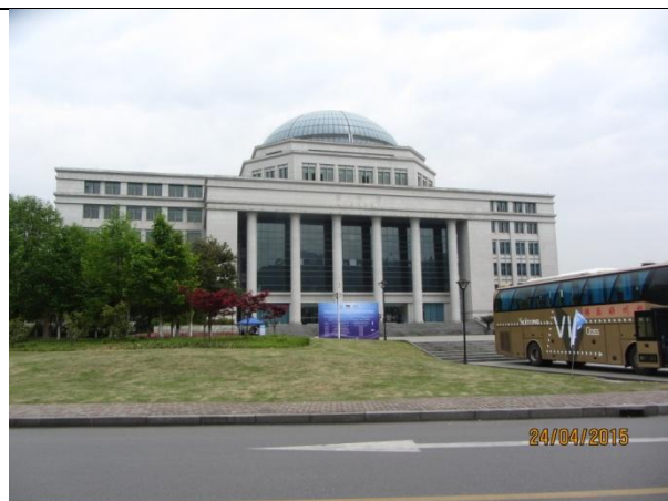
參觀浙江工業大學1