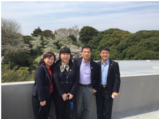
日立工廠參訪隨行教師合影