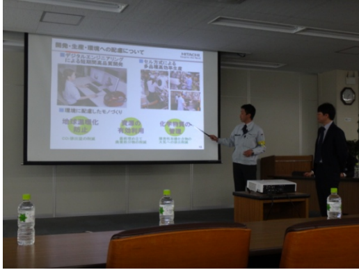
日立工廠參訪部門簡報