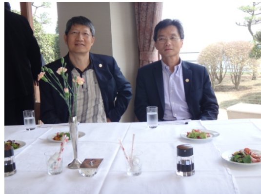
日立工廠參訪隨行教師合影

在日本文化與社會體驗方面，我們一出關行李就已經在等我們了，充分展現日本人的高效率。而日本國民的守法與自律也可以從市容的整潔、看不到頂樓加蓋與違章，尤其廁所的乾淨程度在台灣只有高鐵站可以比擬，奇怪的是居然很少看到清潔人員，難道連外來客也受到感染而守規矩起來了？想到日本廠商到台灣看工廠必先看廁所與 5S 自有其道理。安倍政府這兩年實施寬鬆的經濟政策，觀光客也連帶受惠，連一般消費品超過五千日圓也可以退稅，只見藥妝店都擠滿了台灣客與陸客，有人一晚就血拚超過十萬円，但通常可以退稅的店訂價也較高，有點口惠而實不至。日本公共債務對 GDP 比率雖然超過 200%，但大多由其國民持有卻沒有舉債上限，這是其實施貨幣寬鬆的條件。去年雖然帶來一些成效，但隨後的提高營業稅的政策卻遭到阻礙而延後實施，這也造成政府的預算不足與債務不斷累積的惡性循環，另一方面想用日圓貶值來刺激出口的效果也不如預期。