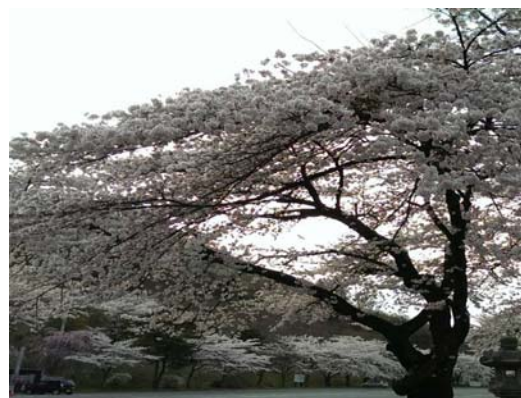
看到殘雪與櫻花是意外的收穫