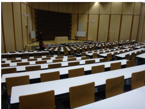
參觀拓殖大學系所設備