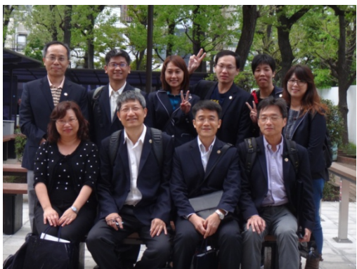
本系學生校園合影留念