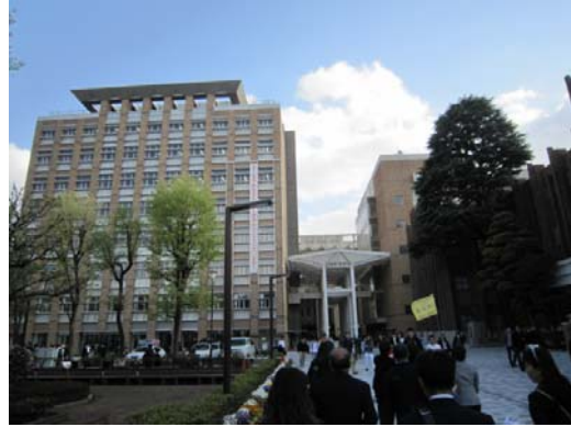
參觀拓殖大學校園