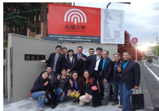
本系學生門口合影留念