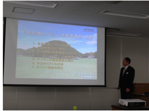
日立工廠參訪部門簡報