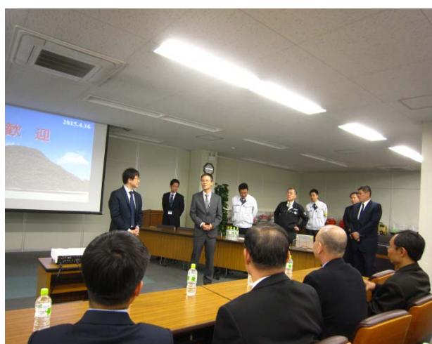
日立工廠介紹與討論