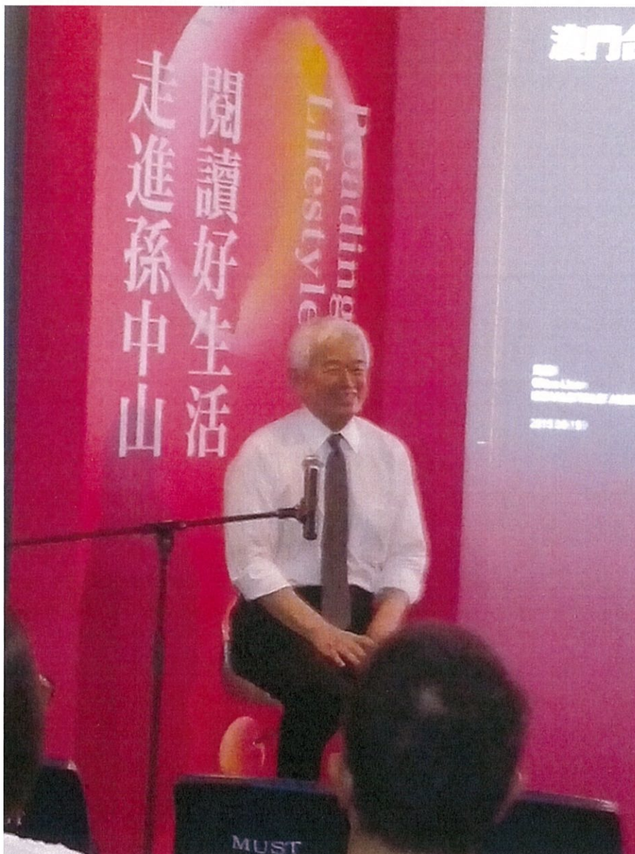
國際照明大師周鍊先生演講

「臺灣週」系列活動甚為精采，有國際照明設計師周鍊先生主講《我們要月亮 更要月光》，以月光引路，帶我們找回人與月光之間的情感，重新把城市跟自然的關係建立起來，周鍊曾是美國最大建築照明設計公司 BPI (Brandston Partnership Inc.) 總裁，包括紐約自由女神像、吉隆坡雙子星大廈、北京頤和園等無數馳名國際的照明皆出自他手。