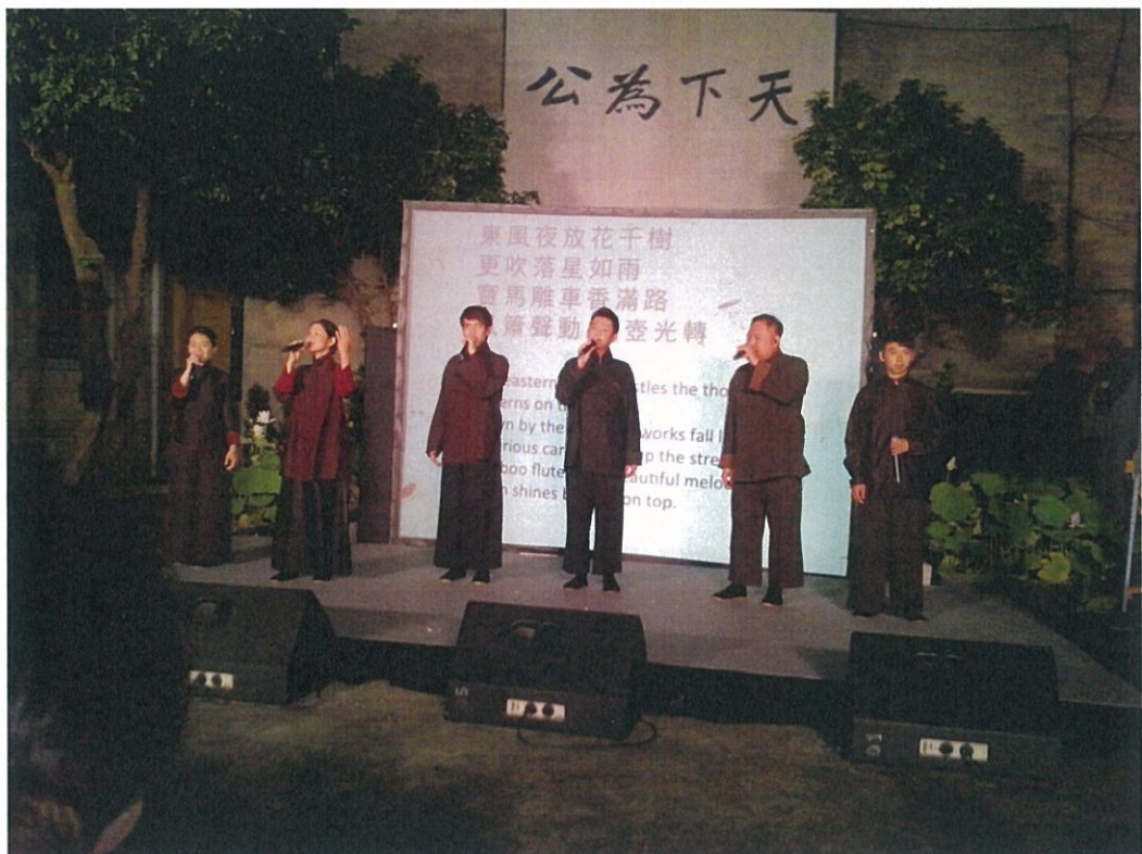
Voco Novo 爵諾人聲樂團演出

「新詩舊詞時空穿越音樂會」為心心南管樂坊與 Voco Novo 爵諾人聲樂團 (Voco Novo A Cappella Group) 首度跨界合作，跨越時間的河流，共同詮釋現代詩人余光中的《鄉愁》，以音樂穿越文學時空，一場既傳統又時尚的文學音樂會，Voco Novo 爵諾人聲樂團成立於 2009 年，純熟的 A Cappella 演唱技巧，不用任何樂器，只用人聲與麥克風，詮釋著流行、爵士、世界音樂、自創曲等多樣曲風，該團隊在國際比賽屢獲殊榮，更於 2015 年 6 月初在芬蘭 TMF 阿卡貝拉合唱大賽勇奪亞軍，與南管藝術家王心心老以南管與無伴奏合唱共同展現古詩、新詩之美。