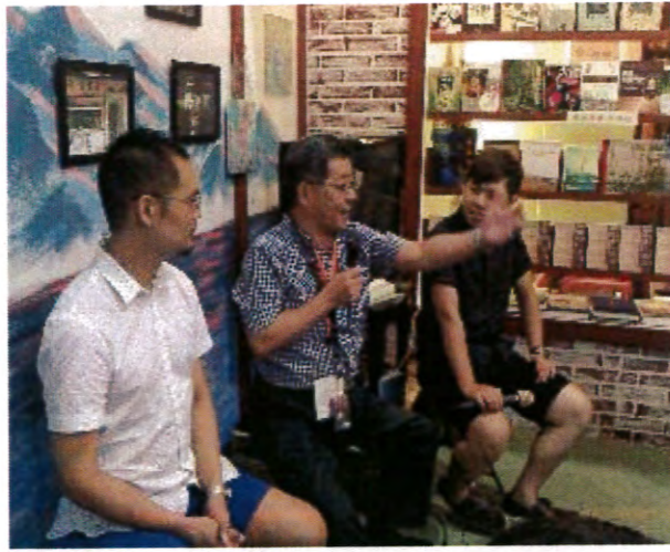
獨立書店展區講座