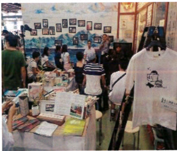
獨立書店展區講座