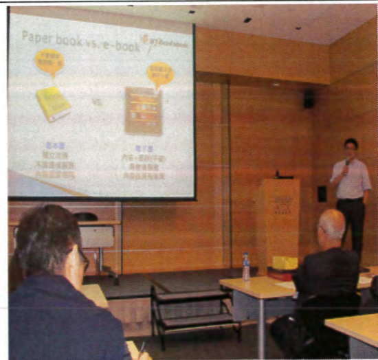
兩岸四地華文出版年會論壇現場