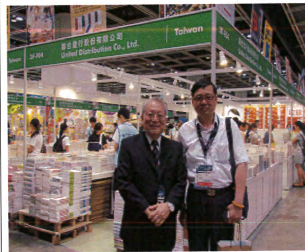
「寶島書香饗香江」-臺灣出版人聯合展區