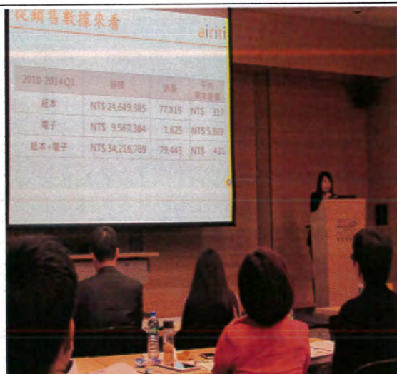
兩岸四地華文出版年會論壇現場