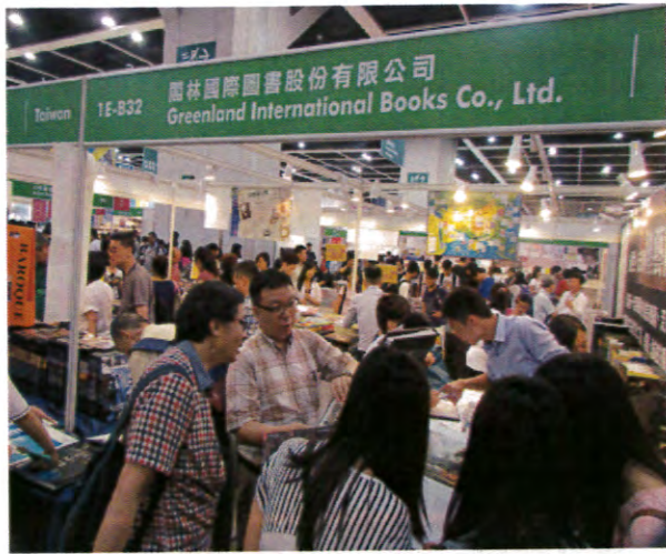
「寶島書香饗香江」-臺灣出版人聯合展區