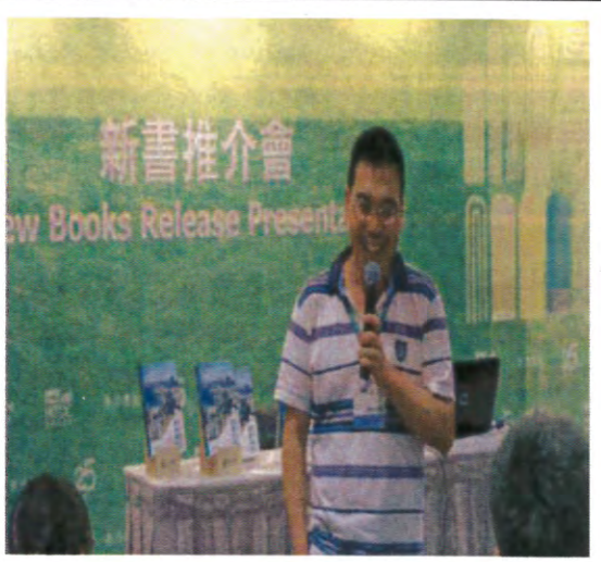
大學出版社聯展區新書推介會