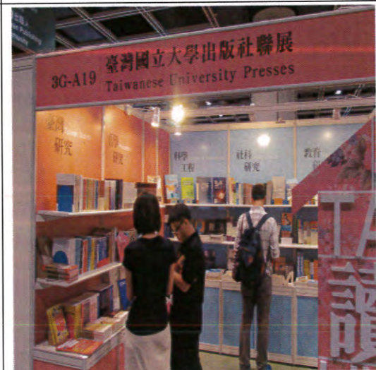
大學出版社聯展區