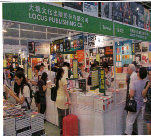
「寶島書香饗香江」-臺灣出版人聯合展區