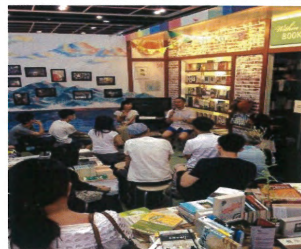
獨立書店展區講座