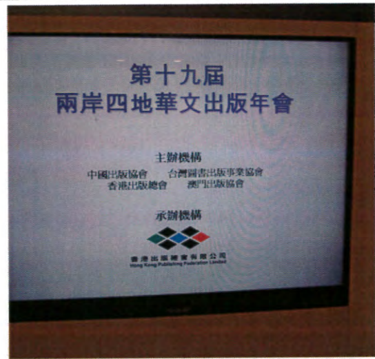
兩岸四地華文出版年會論壇現場