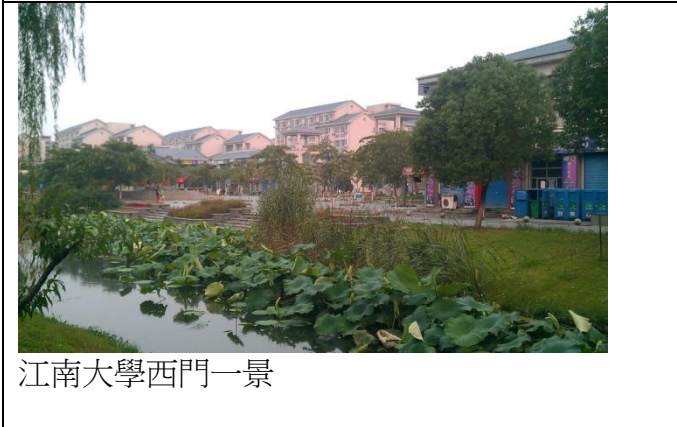
江南大學西門一景