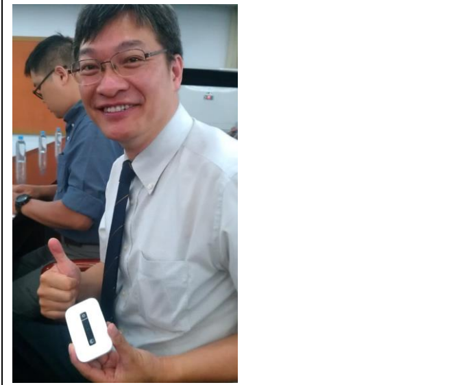
Walking Wifi/行動 wifi