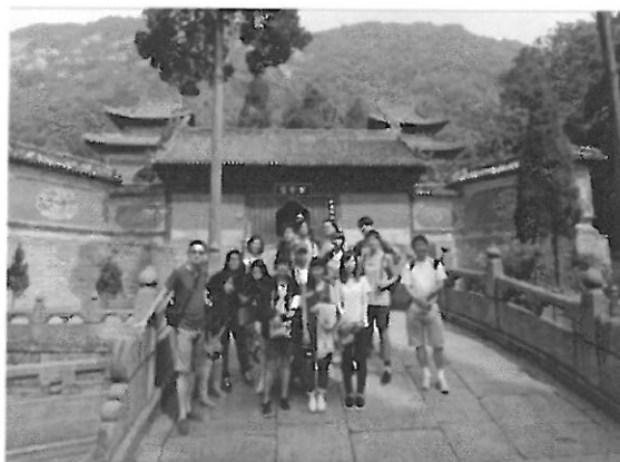
兩岸師生武當山文化參訪合影