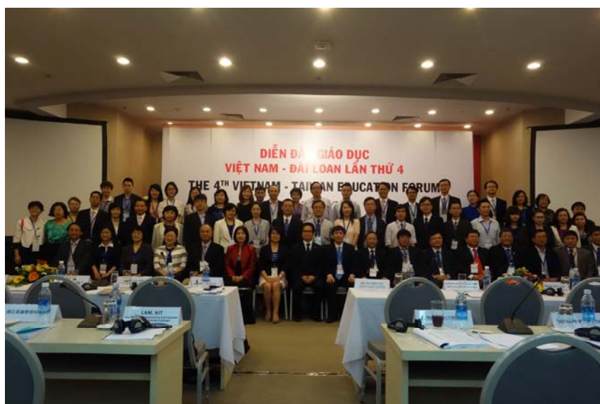
本次「臺越教育論壇」雙方與會者會場合影