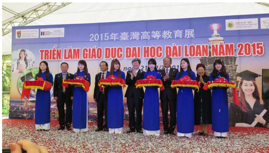
教育部吳思華部長（照片中央鼓掌者）主持「2015年臺灣高等教育展」開展儀式