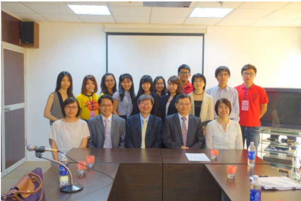
教育部吳思華部長與越南南部我華語教師及實習生座談