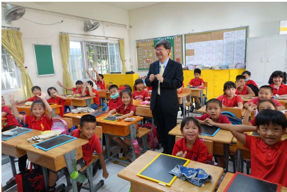
教育部吳思華部長視察胡志明市臺灣學校，關心海外學校教學環境