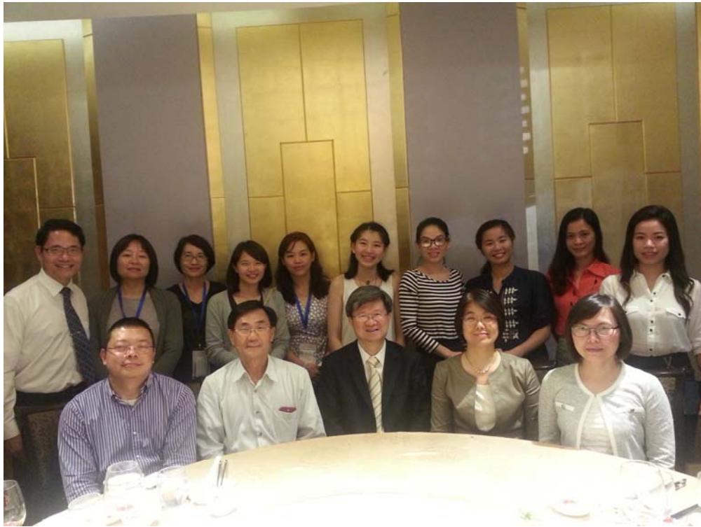
教育部吳思華部長（前排中）與越南北部我國華語文教師餐會座談