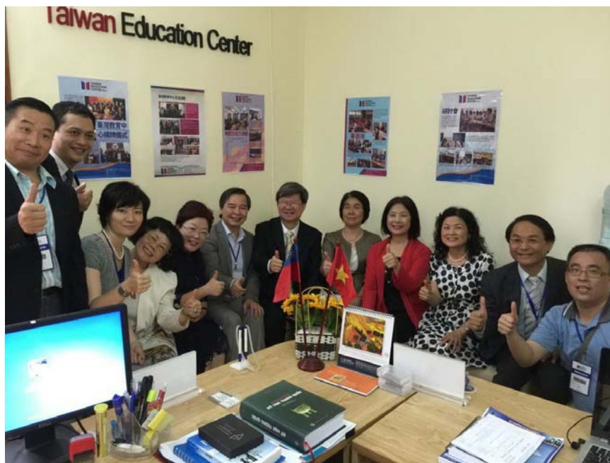
教育部吳思華部長（中）視察河內臺灣教育中心辦公室