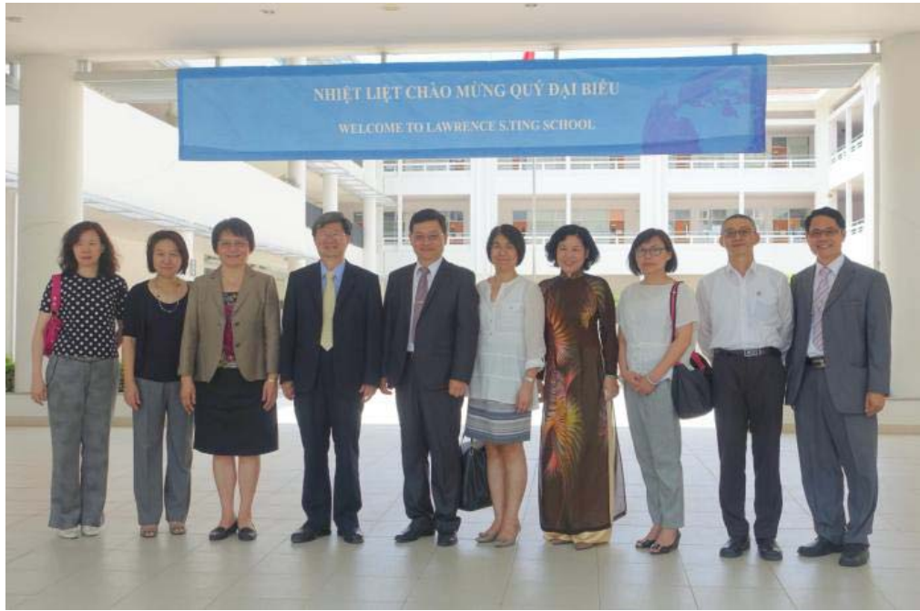
教育部吳思華部長（左四）參觀訪問胡志明市「丁善理紀念中學」