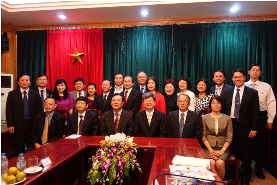
教育部吳思華部長（前排右三）與越南教育培訓部范武論部長（前排左三）在臺越教育合作官方會談後合影