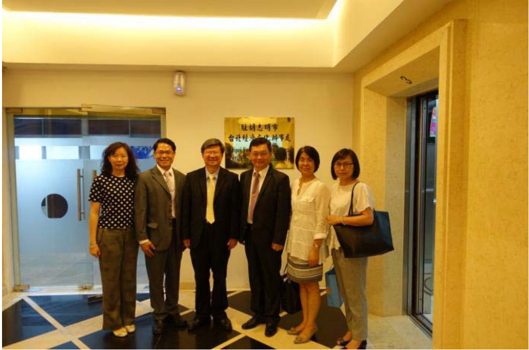
教育部吳思華部長（左三）視察駐胡志明市臺北經濟文化辦事處