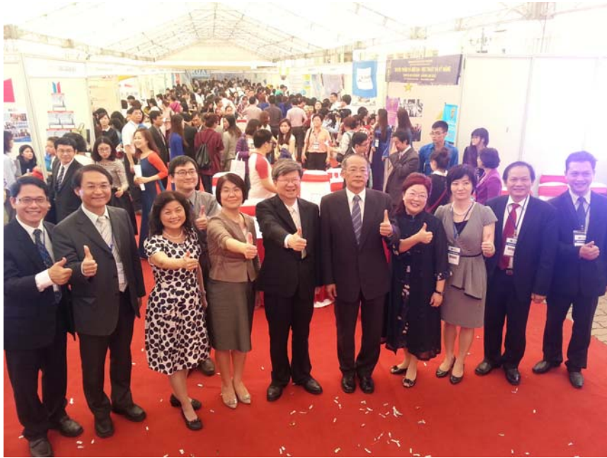
2015 年臺灣高等教育展盛況空前