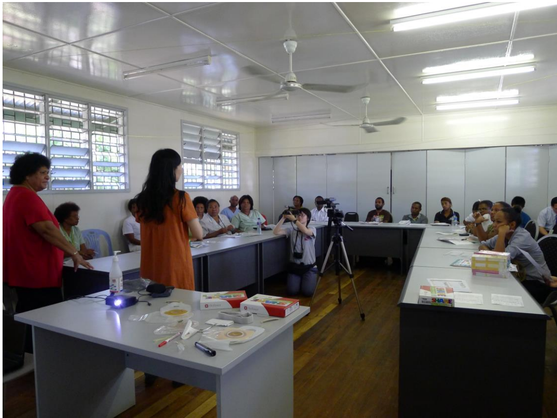
彰基於首都莫士比港綜合醫院進行造口衛教