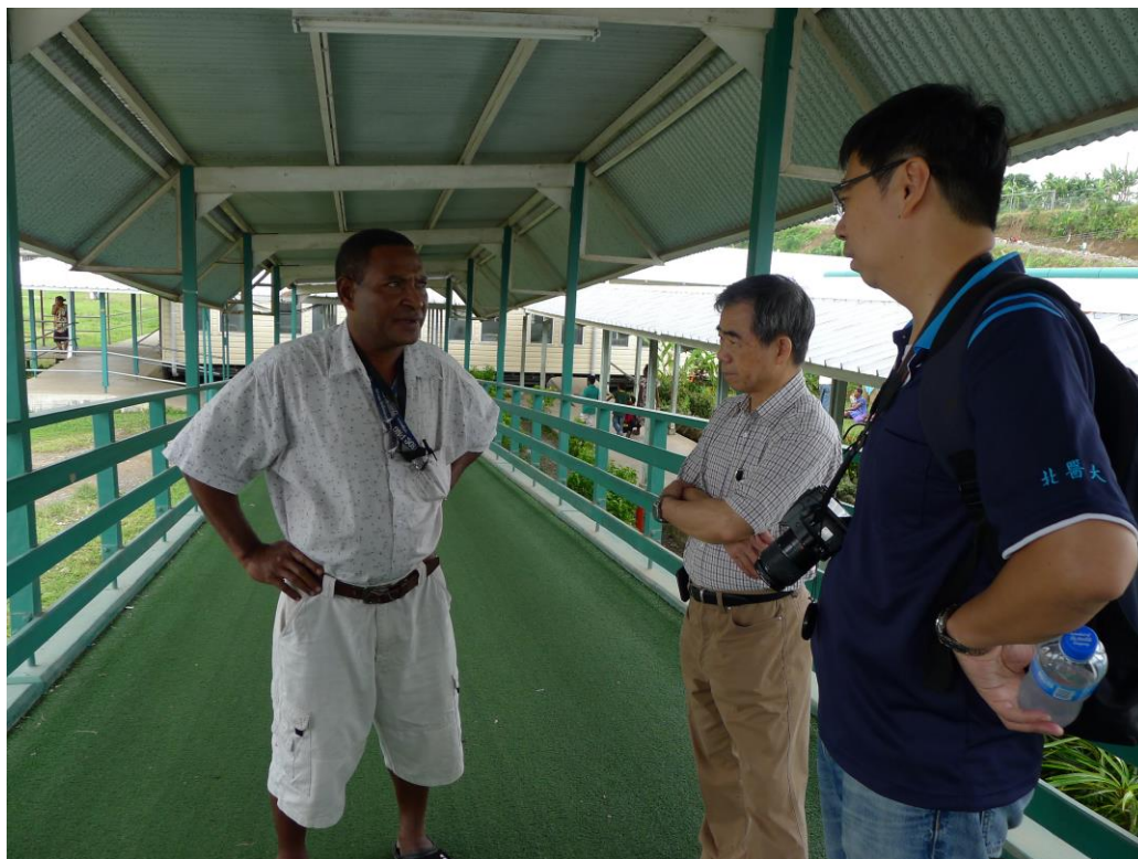
與曾來台受訓之安高醫院人員進行訪談