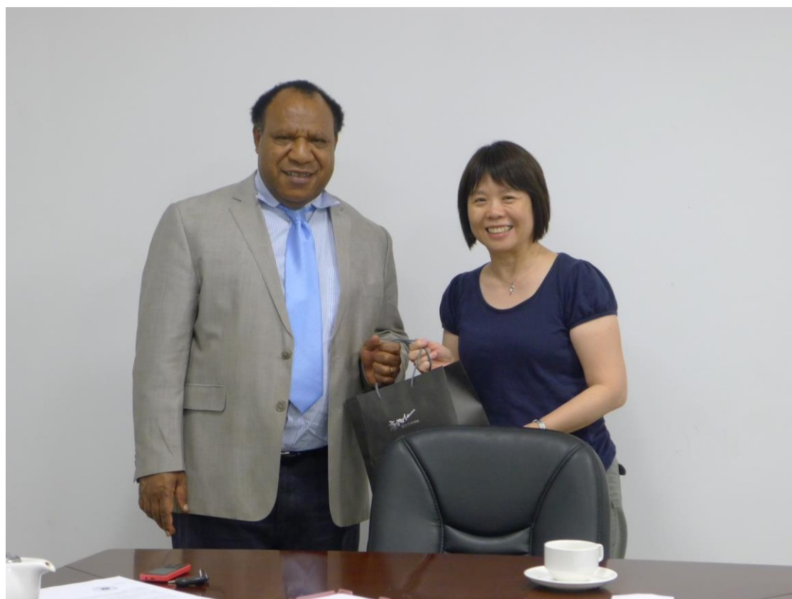
拜會巴紐外交與移民部長 Hon. Rimbink Pato