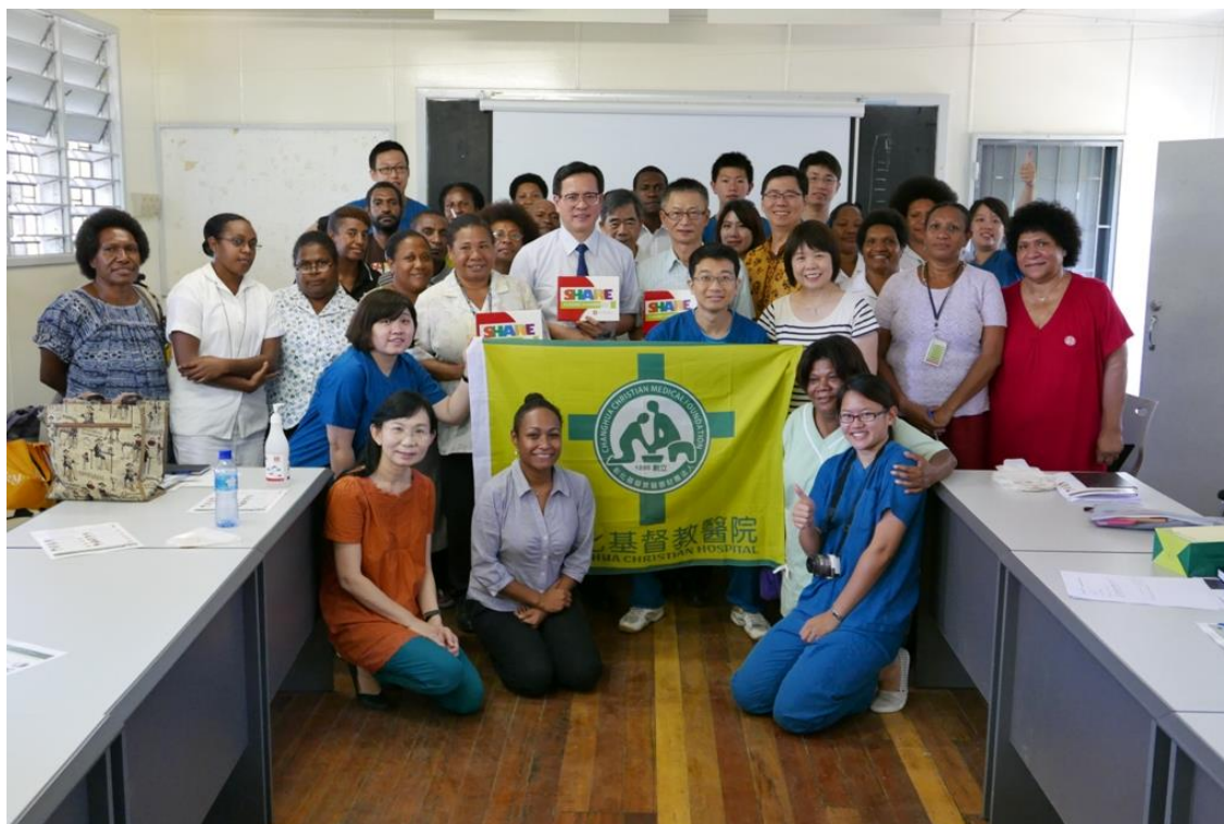
與彰基行動醫療團員、莫士比港綜合醫院護理人員於衛教結束後合影