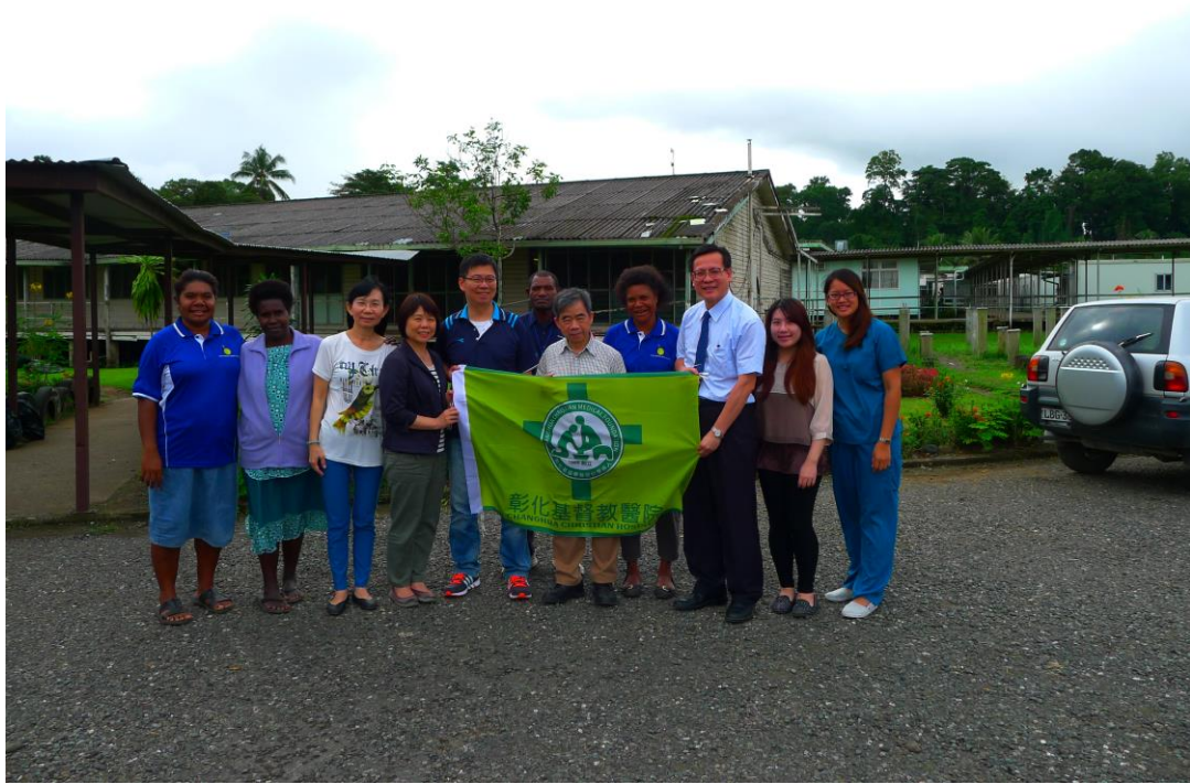
與彰基行動醫療團員、安高醫院醫事人員合影