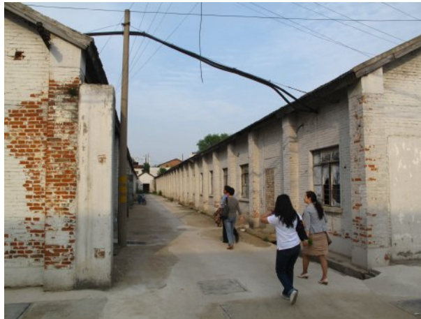
圖 7 文創空間參觀