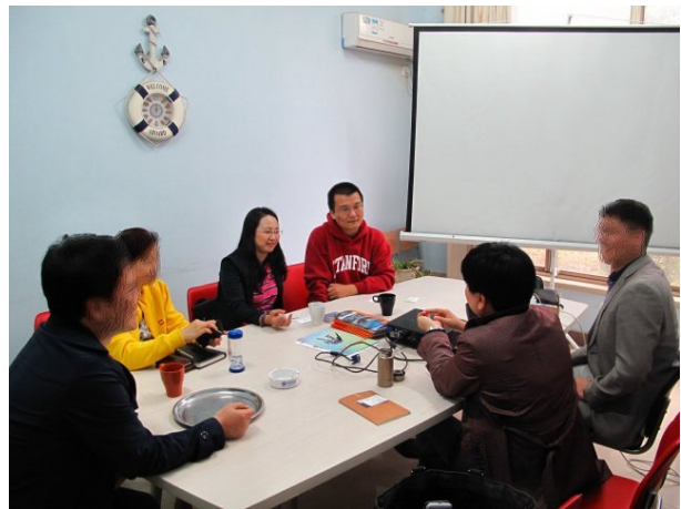
圖 1 05 月 04 日(一) 雲林啟程→松山機場→抵達合肥市;與當地創投公司-艾福創投董事長見面，並至所創立公司企業參觀，進行安徽當地創業圈現況座談