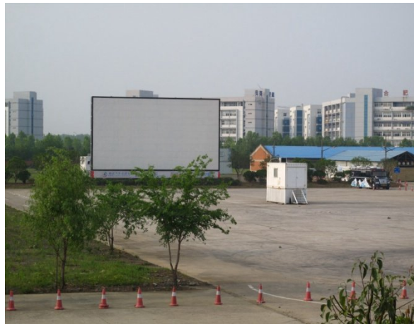
圖 6 露天影院(參照美國公路電影)