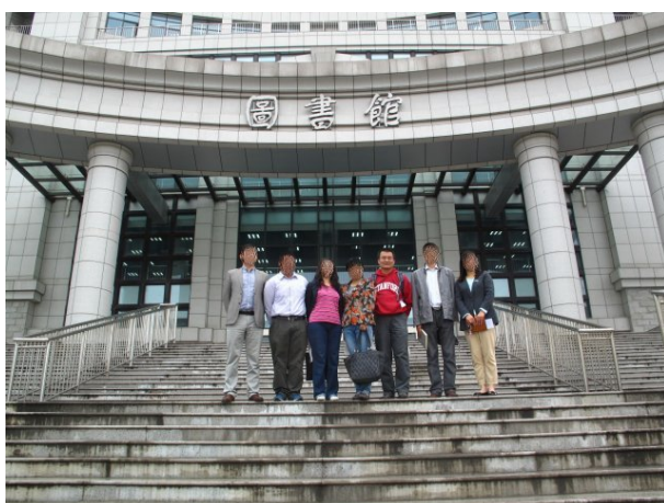
圖 11 安徽農業大學圖書館前合影