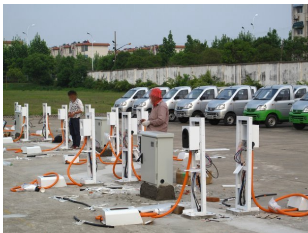
圖 9 電動充電車座