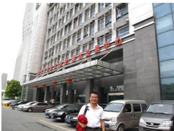
圖 10 合肥國家專利技術展示中心