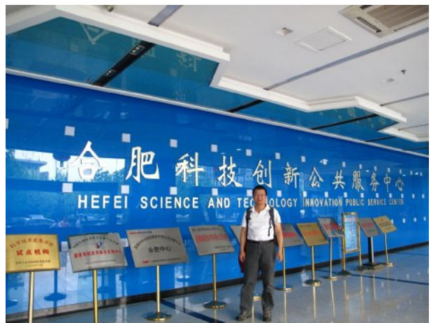
圖 2 05 月 05 日(二) 參觀安徽中航文創園→參觀合肥國家專利技術展示；交易中心→參觀合肥科技創新公共服務中心→與艾福創投共同合夥人總經理交流