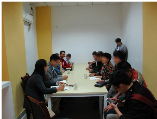
圖 4 安徽農業學校創業團隊創業項目聽取