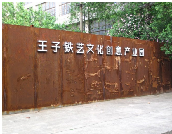
圖 8 文化創意產業園一景