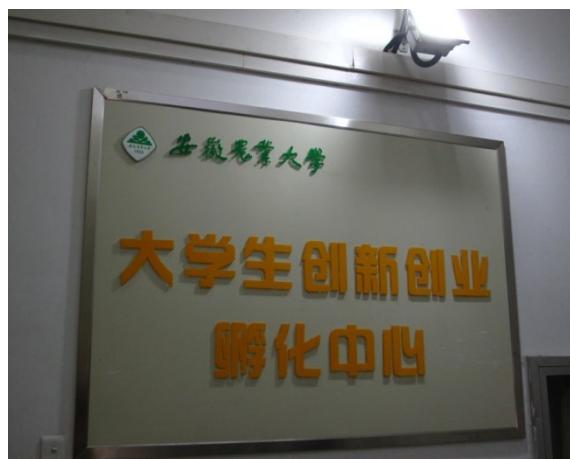
圖 5 安徽農業大學孵化中心