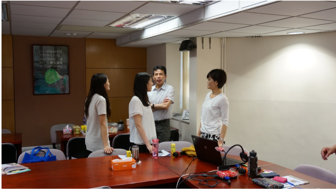
圖 9 參訪研究員與兩位現場教師分享教學經驗(香海正覺蓮社佛教正覺中學)

最後，為提供學生多元學習經驗與升學考量，正覺中學的其他學習經歷 (Other Learning Experience, OLE) 也有豐富的課程，以落實「全方位學習」的理念，因此積極推動跨科專題學習，讓學生不只在課室學習，更能擴展視野。相關的活動包括 21 世紀東亞青少年大交流計畫，參訪日本東京；山東的通識文化考察；台北的環保及生態考察；廣東的文化考察團等等。隨著香港新工中學制的推行，學生的多元化學習經歷也更加重要。