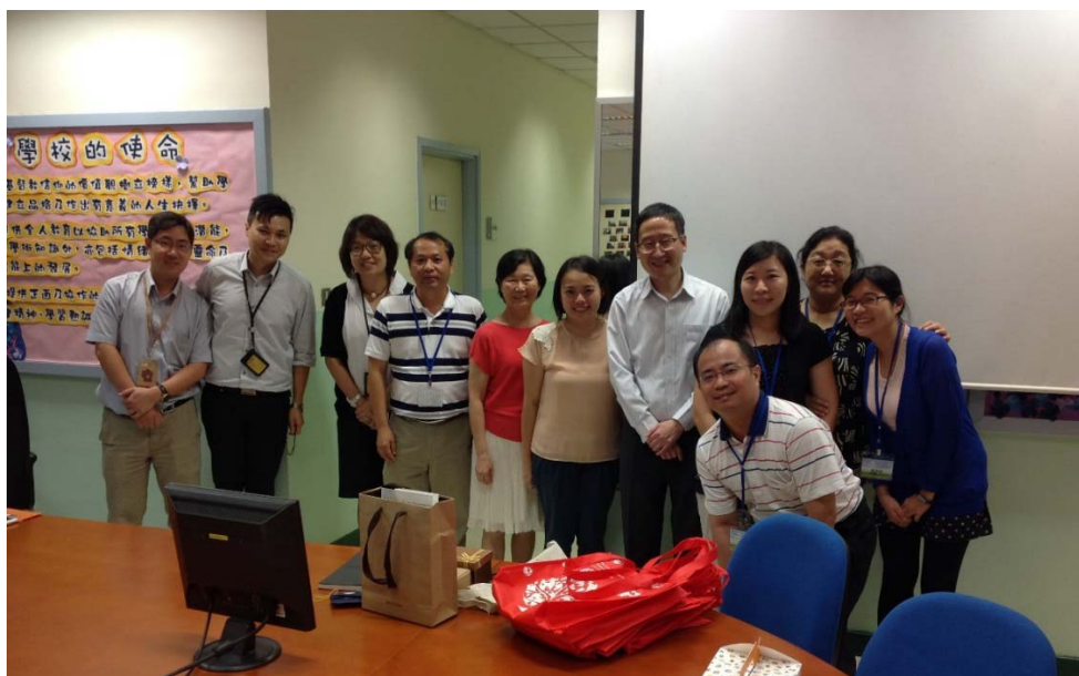
圖 4 與會人員合影(救世軍林拔中紀念學校)

這次參訪，可了解到該校學生家庭社經背景較弱，但因學校資源豐富，使學生各方面的學習不虞匱乏。參訪時印象較為深刻者如下：