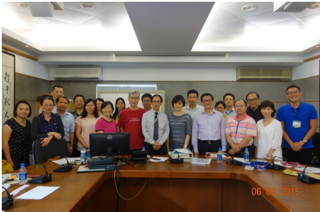
圖 2 與會人員交流討論並合影留念(香港中文大學)