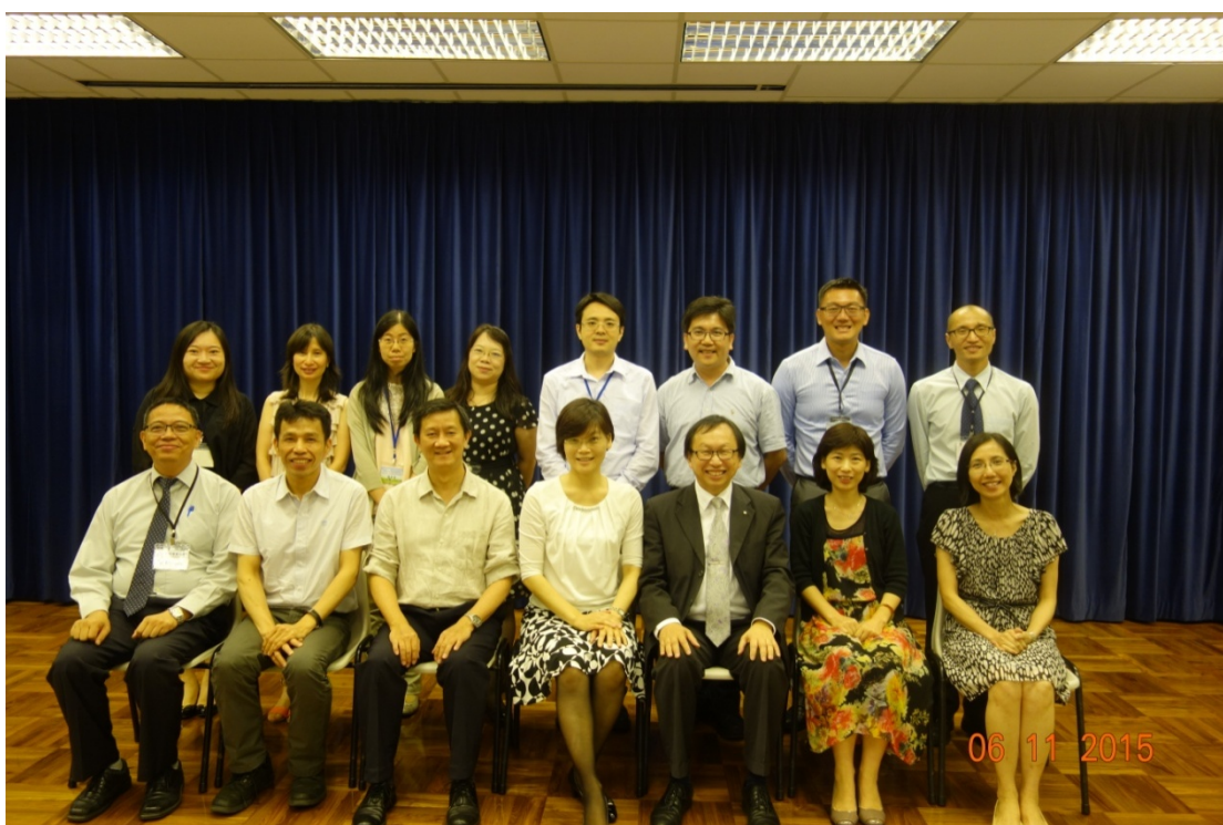
圖 11 與會人員合影(潮州會館中學)