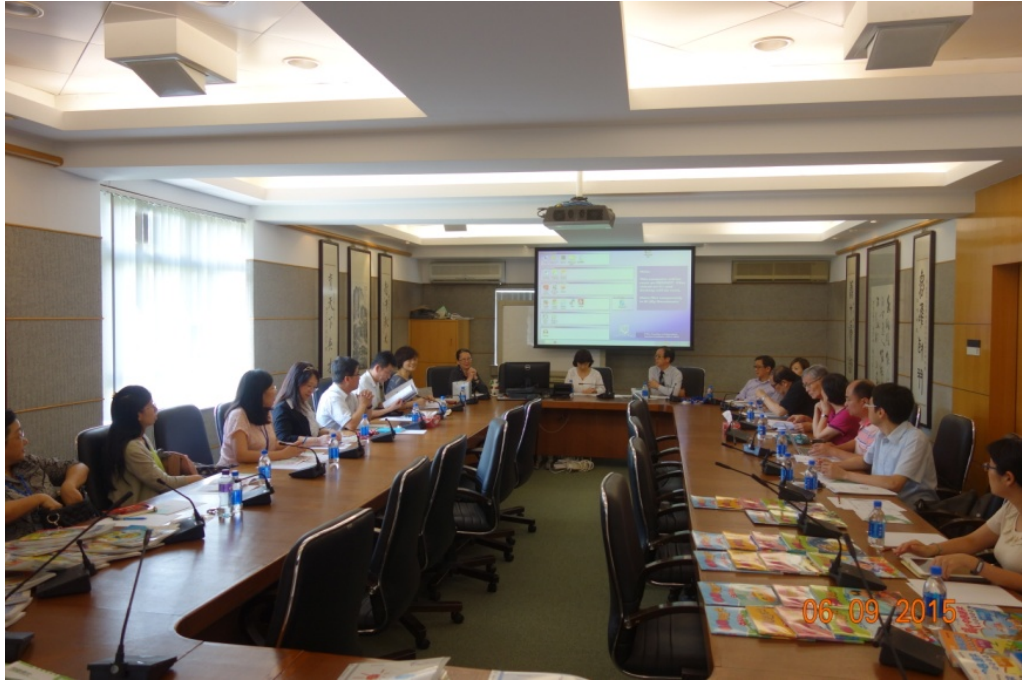
圖 1 呂斌博士簡報優質學校改進計劃(QSIP)的經驗與模式(香港中文大學)