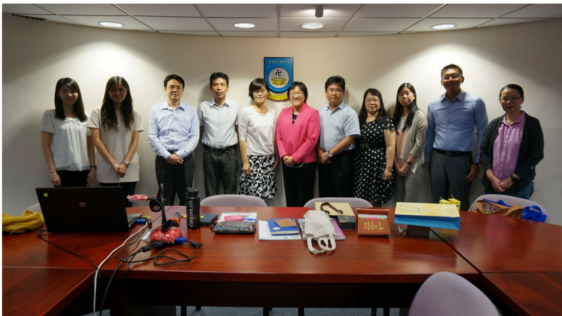
圖 10 與會人員合影(香海正覺蓮社佛教正覺中學)

最後，為提供學生多元學習經驗與升學考量，正覺中學的其他學習經歷 (Other Learning Experience, OLE) 也有豐富的課程，以落實「全方位學習」的理念，因此積極推動跨科專題學習，讓學生不只在課室學習，更能擴展視野。相關的活動包括 21 世紀東亞青少年大交流計畫，參訪日本東京；山東的通識文化考察；台北的環保及生態考察；廣東的文化考察團等等。隨著香港新工中學制的推行，學生的多元化學習經歷也更加重要。