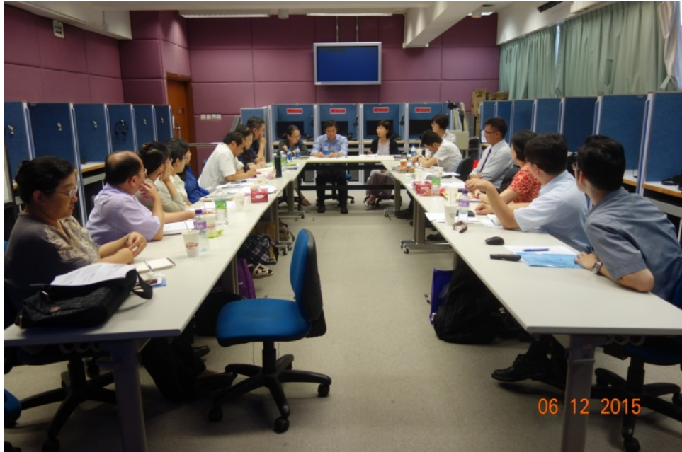
圖 12 與香港中文大學優質學校改進計畫團隊座談