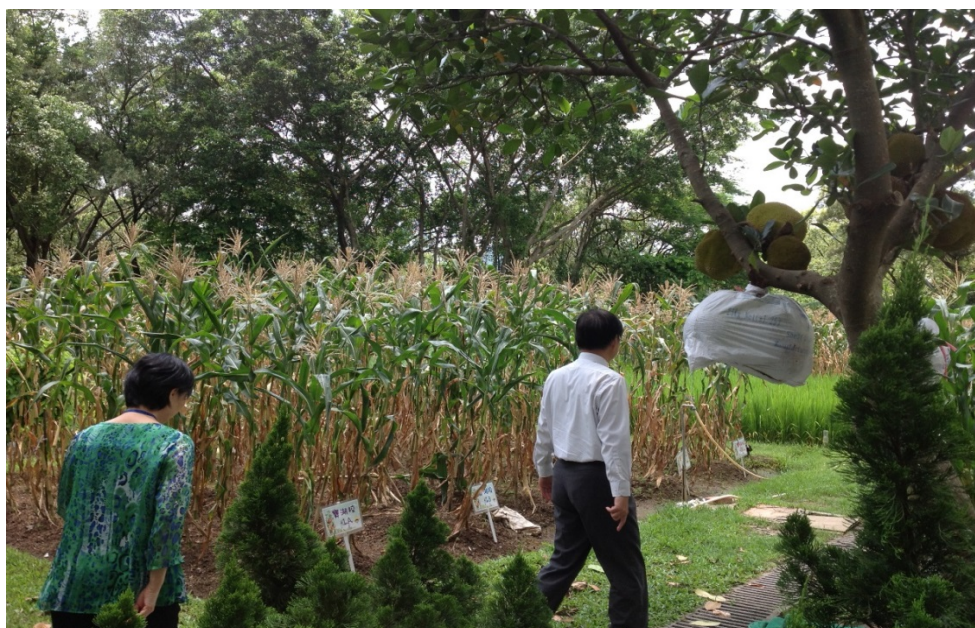
圖 5 新校舍一隅：學生體驗農耕區(大埔舊墟公立學校)

本次參訪由徐俊祥校長接待並進行學校簡介，說明該校的發展重點有五，包括(1)推行電子學習計畫，發展電子教材、學材，配合創新的教學模式，培養學生自主學習。(2)在中、英、數三科推行香港中文大學優質教育基金撥款的「自主學習計畫」，提升學生主動學習的精神和能力。(3)實施「多元價值教育文化藝術特色課程」，以提升學生的人文關懷及藝術情操。(4)重視品德教育與公民教育的意識、道德觀與價值觀。(5)有系統地發展「專題研習」及「課程統整週」，教導學生運用思維策略，學習整理及分析資料，並讓學生進行自評及他評，提升自省能力及批判性思維。此外，學校安排有「圖書館之夜」的活動，每位五年級學生藉由留宿圖書館，寫下並發表一個跟圖書館有關的故事，老師也會進行作品評選，期能藉此活動提供跨領域統整的閱讀與寫作能力之課程。