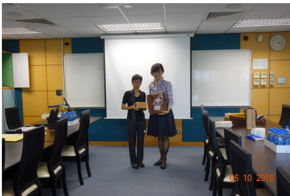
圖 8 與會成員聆聽簡報、討論與合影(仁愛堂田家炳中學)