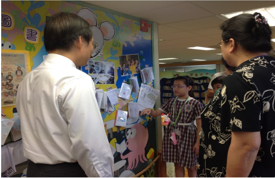
圖 6 學生分享夜宿圖書館的創作(大埔舊墟公立學校)