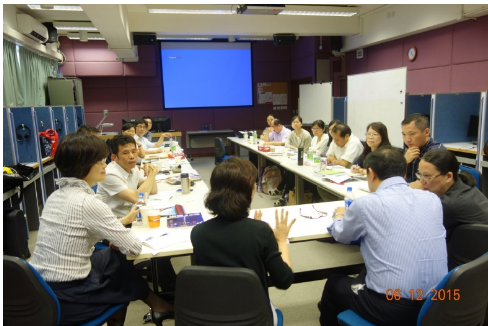
圖 13 與會人員進行討論與互動(香港中文大學)