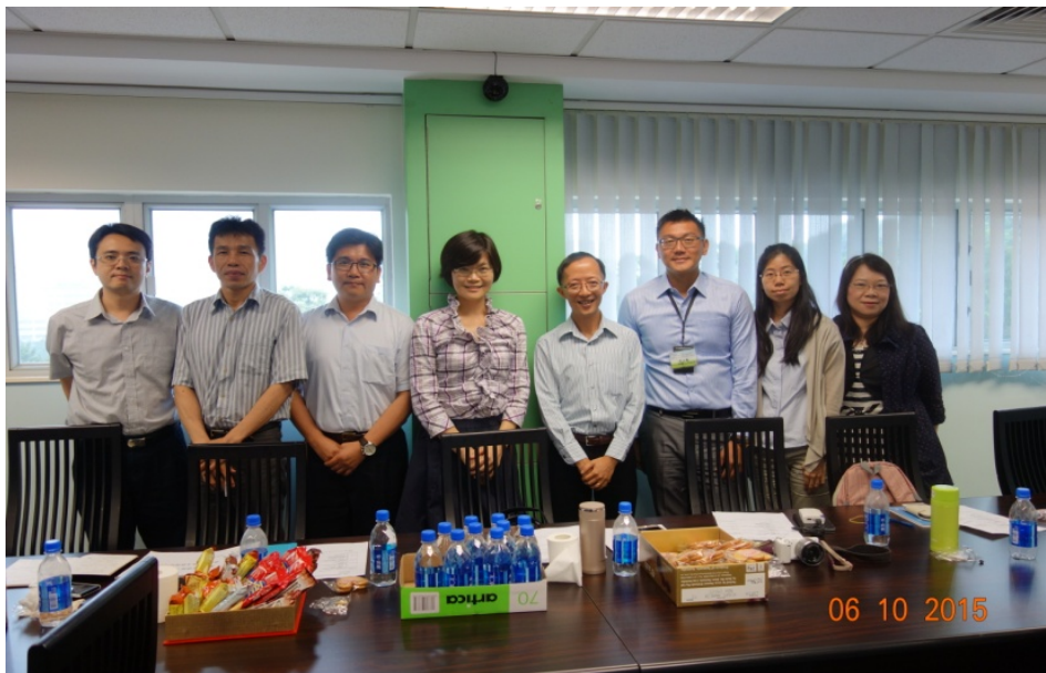
圖 7 與會成員合影(仁愛堂田家炳中學)