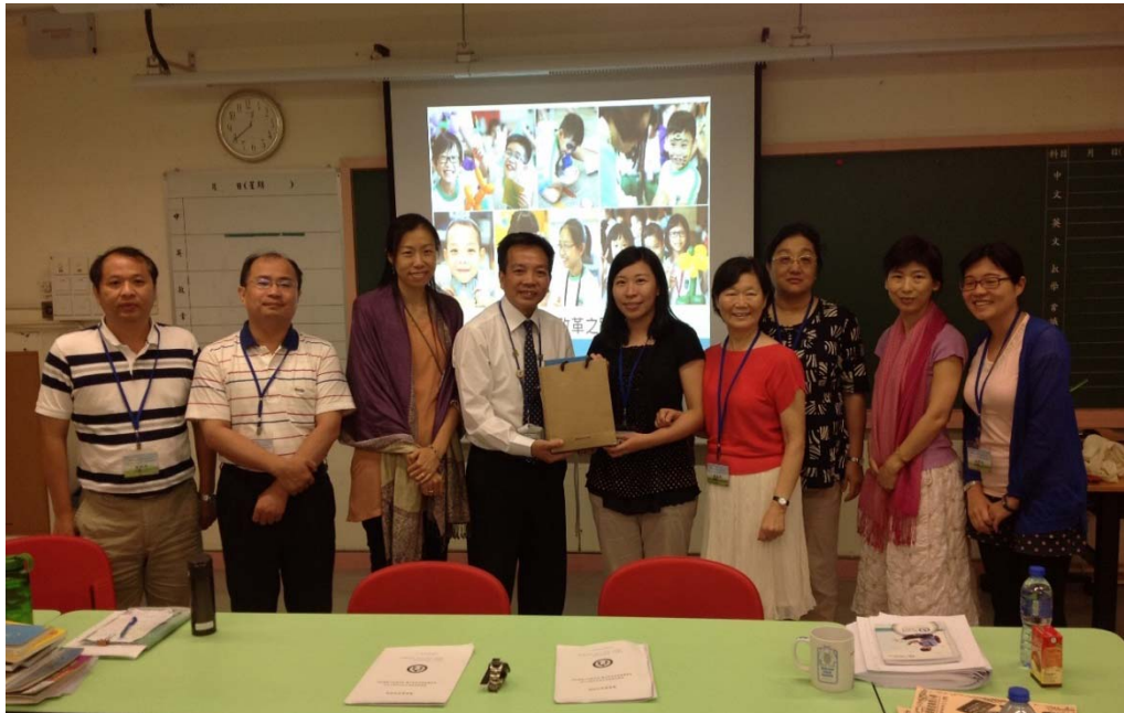
圖 3 與會人員合影(天水圍循道衛理小學)