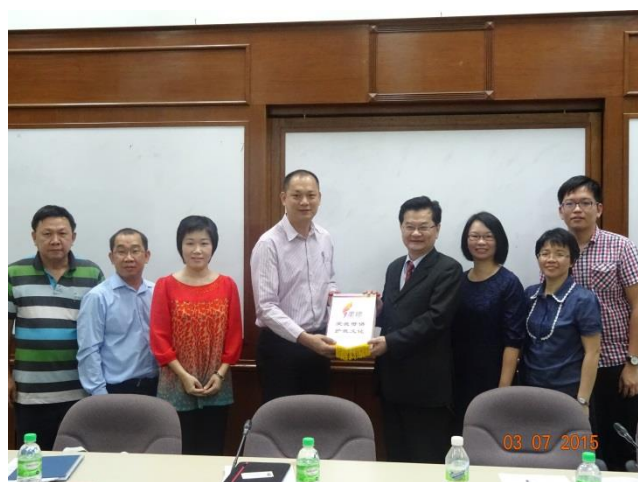
馬來西亞升學輔導暨報名實務工作坊開幕合影