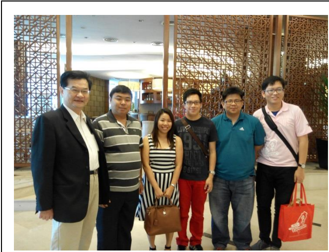
蘇主任委員與留臺校友合影