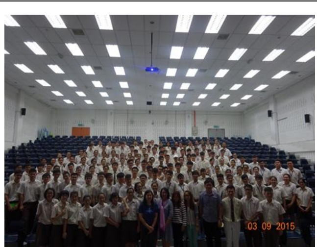
巴生光華獨中升學輔導說明會大合照