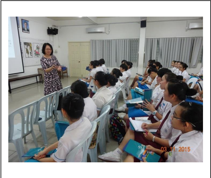
檳城檳華女子中學升學輔導說明會照片