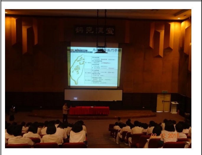
寬柔古來分校升學輔導說明會照片