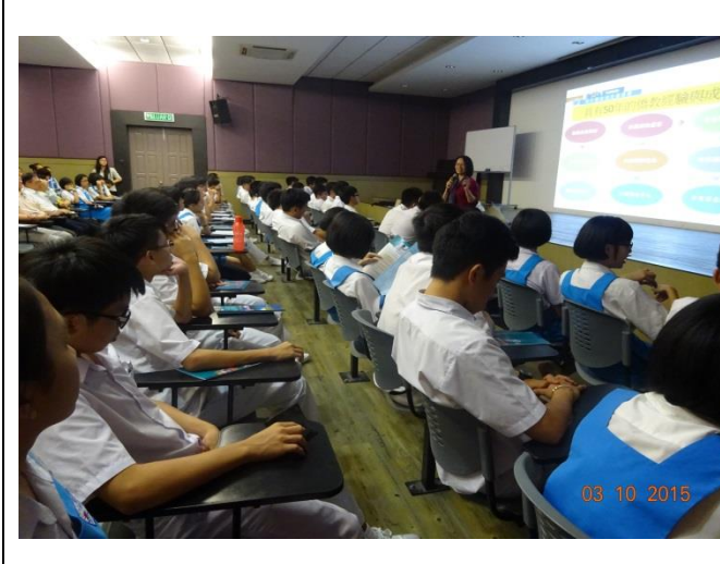
大山腳日新獨中升學輔導說明會照片