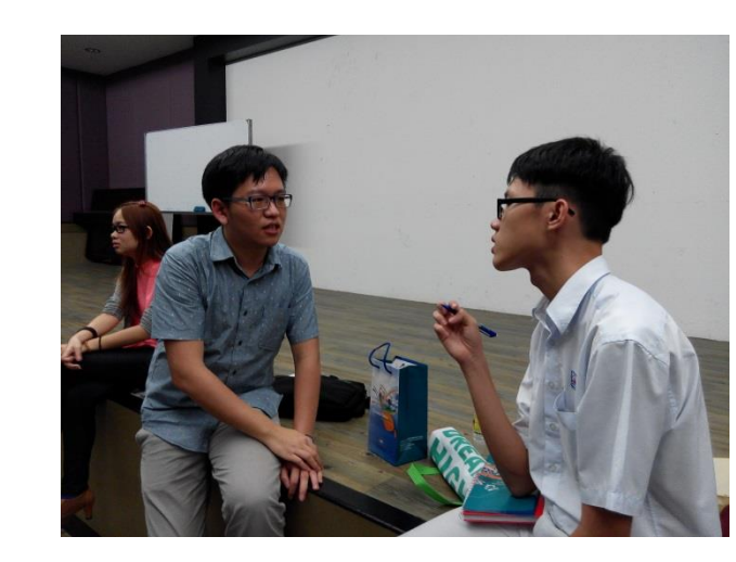
大山腳日新獨中升學輔導說明會學生提問