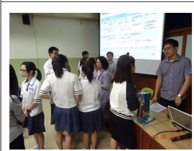
吉隆坡尊孔獨中升學輔導說明會學生提問