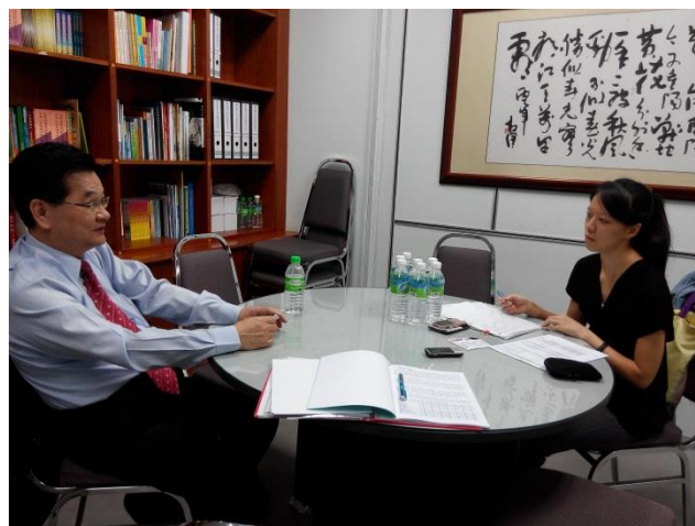
蘇主任委員接受馬來西亞「中國報」專訪