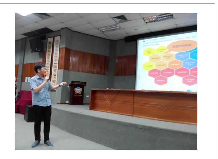
居鑾中華中學升學輔導說明會照片