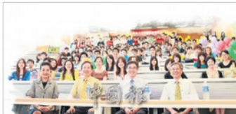
台大為僑生舉辦「新僑生入學輔導講習會」。