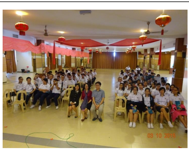
阿羅士打新民獨中升學輔導說明會大合照