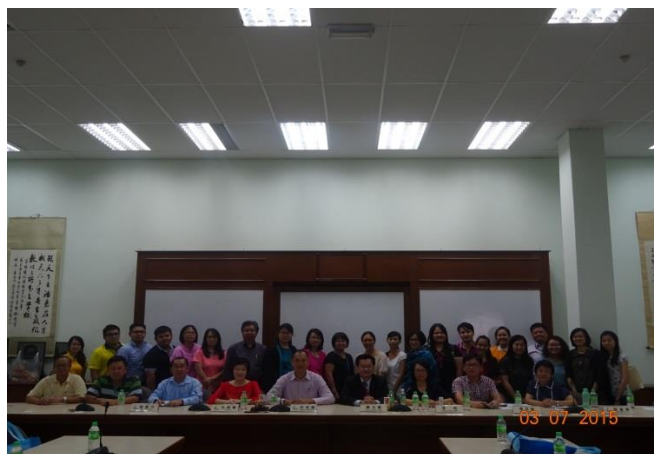
馬來西亞升學輔導暨報名實務工作坊大合照