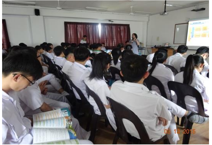
笨珍培群獨中升學輔導說明會照片