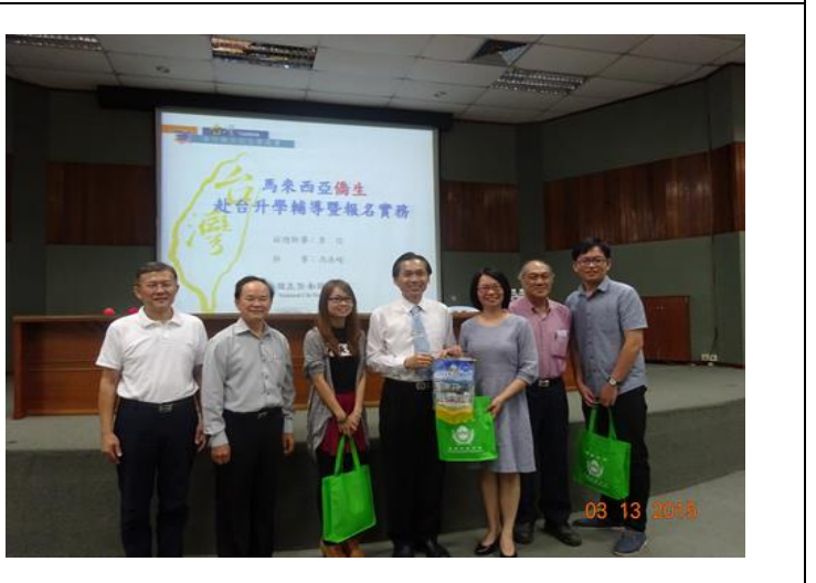
居鑾中華中學升學輔導說明會照片