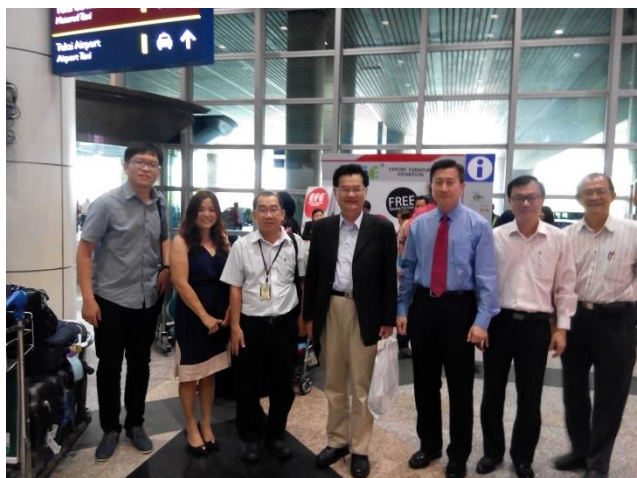
董總及留臺聯總代表機場接機合影