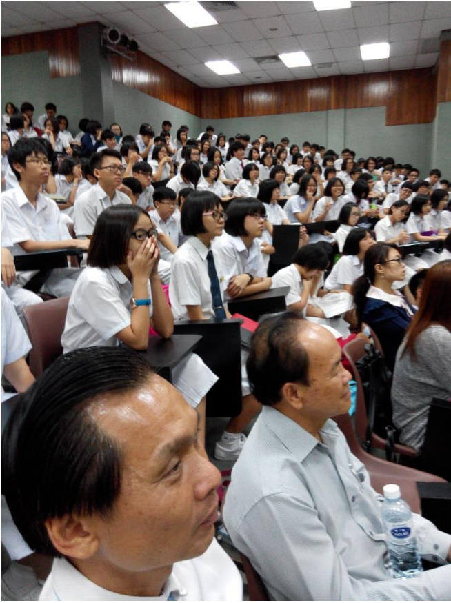
居鑾中華中學董事長、校長及師生認真聆聽