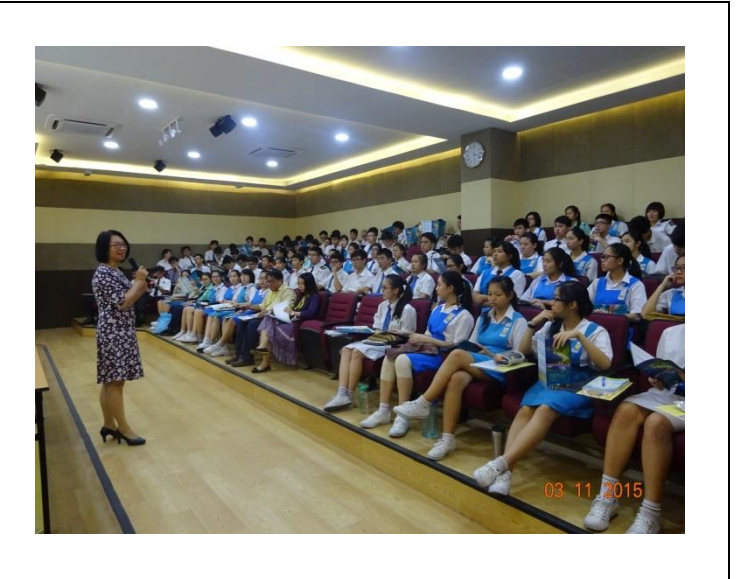
檳城鐘靈獨中升學輔導說明會照片