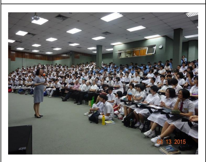
居鑾中華中學升學輔導說明會照片