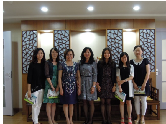
本計畫參訪人員與盧灣實小虞校長及教師代表座談後合影留念