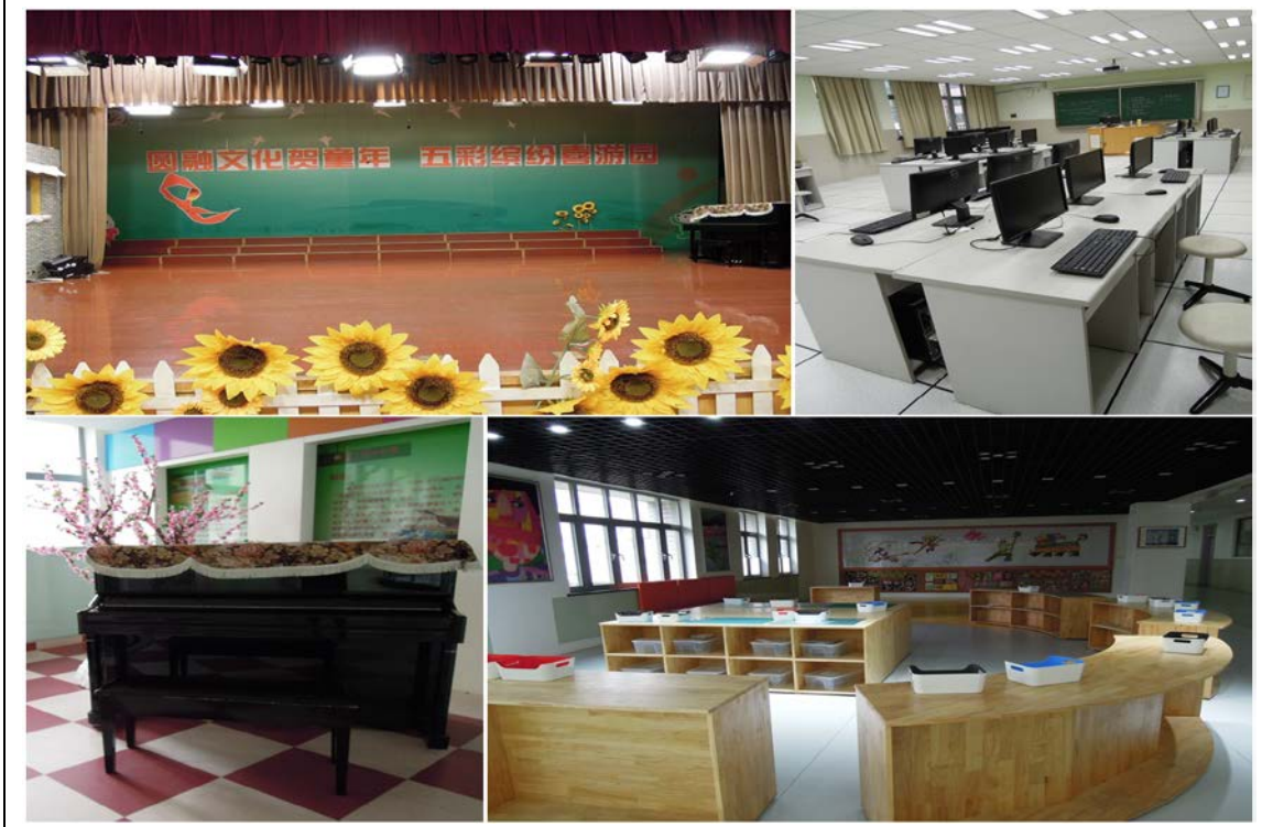
盧灣實小多元課程學習角（二）