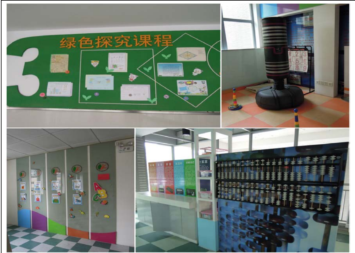
盧灣實小多元課程學習角（一）