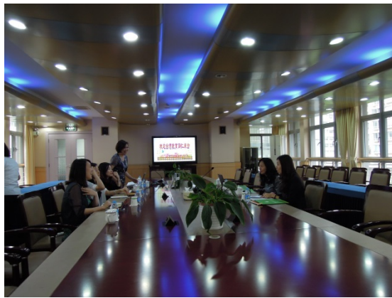
盧灣實小虞校長向本計畫參訪人員簡報辦學理念